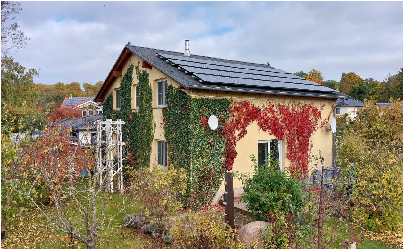
Blick von SW