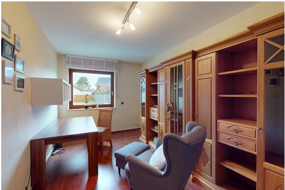
Gästezimmer / Büro