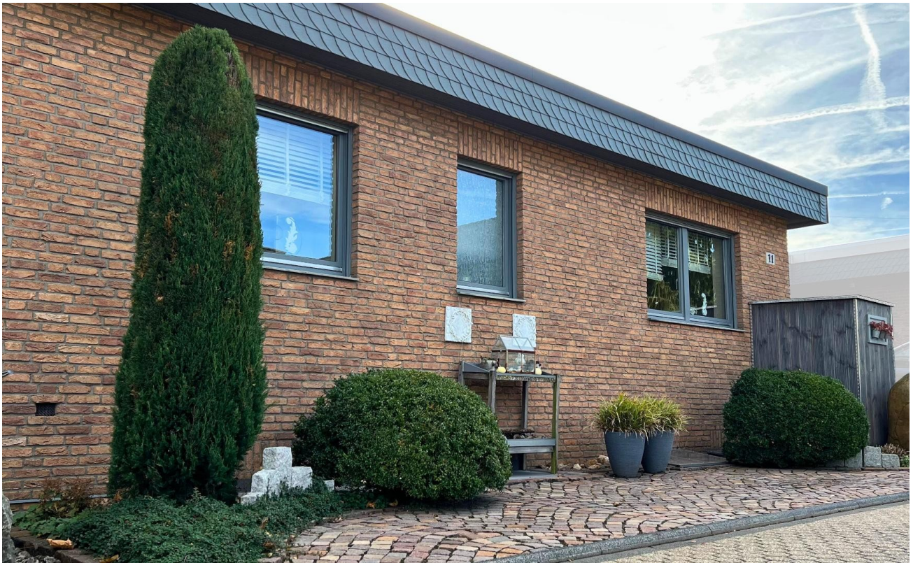
Vorgarten mit Stellplatz