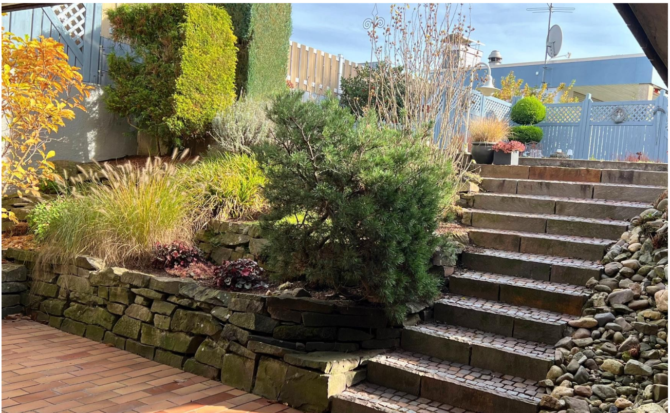
Zweite Terrasse 2