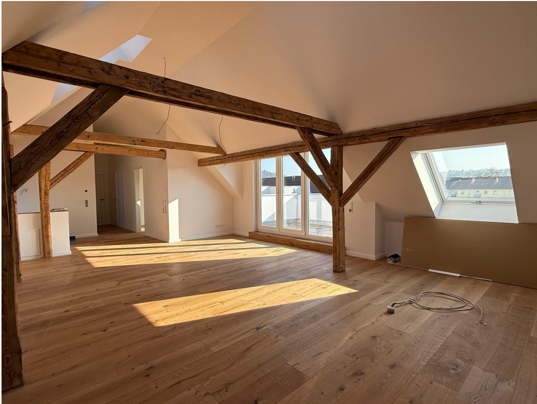
Wohnen / Essen / Kochen