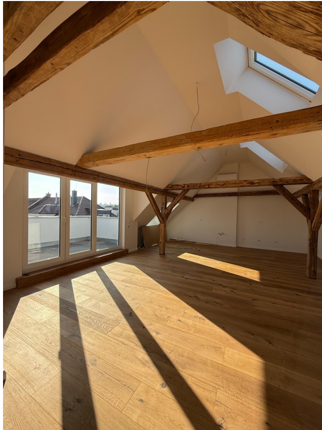
Wohnen / Essen / Kochen