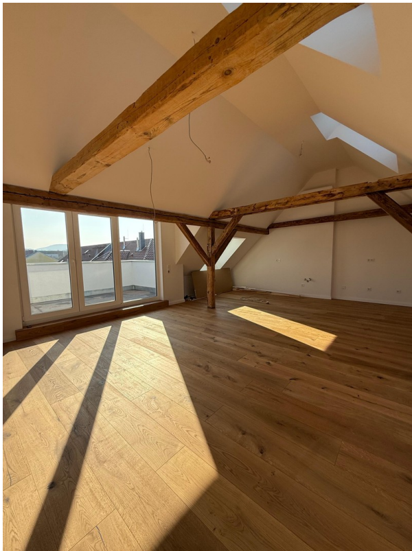
Wohn / Essen / Kochen