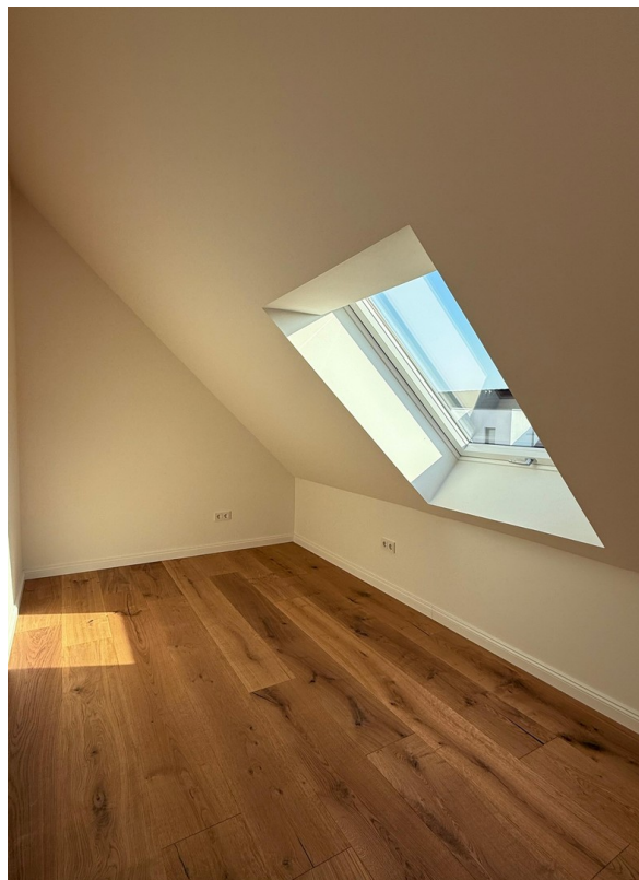
Gästezimmer / Büro