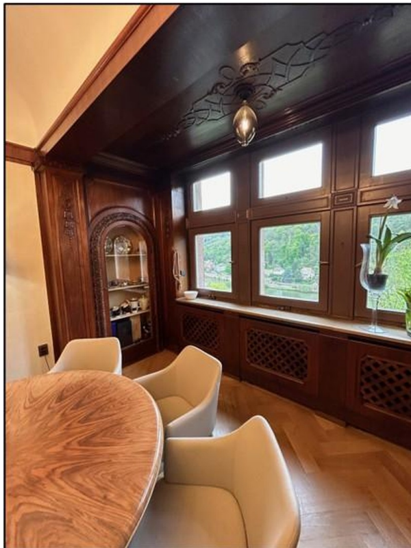
Esszimmer - Dinner