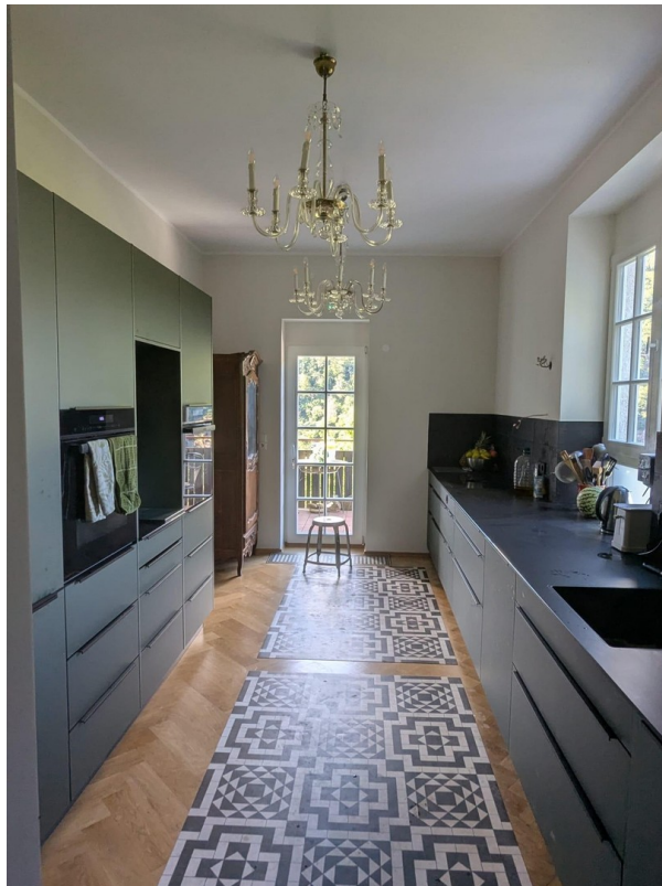
Küche - Kitchen