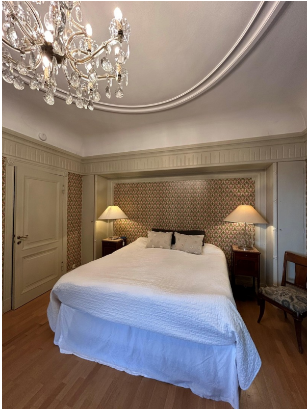
Schlafzimmer - Bedroom