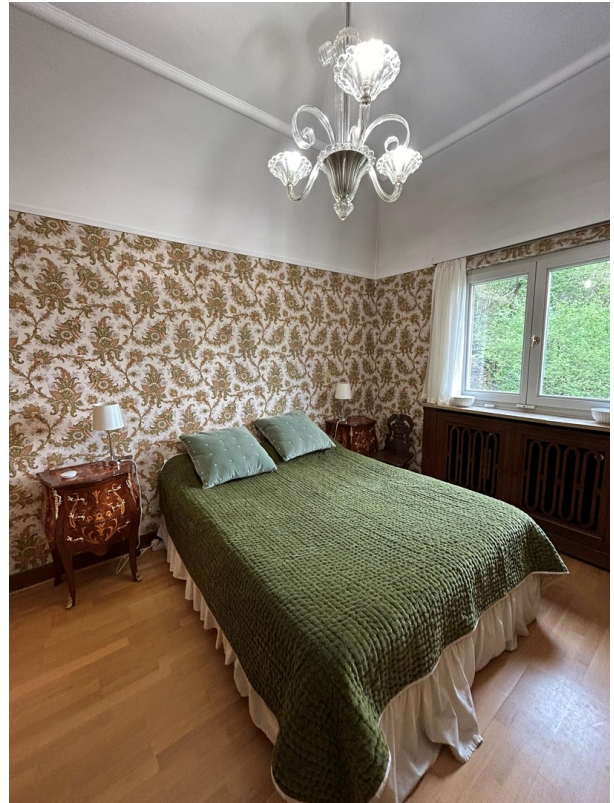
Schlafzimmer - Bedroom