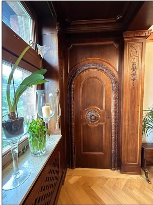
Esszimmer - Dinner