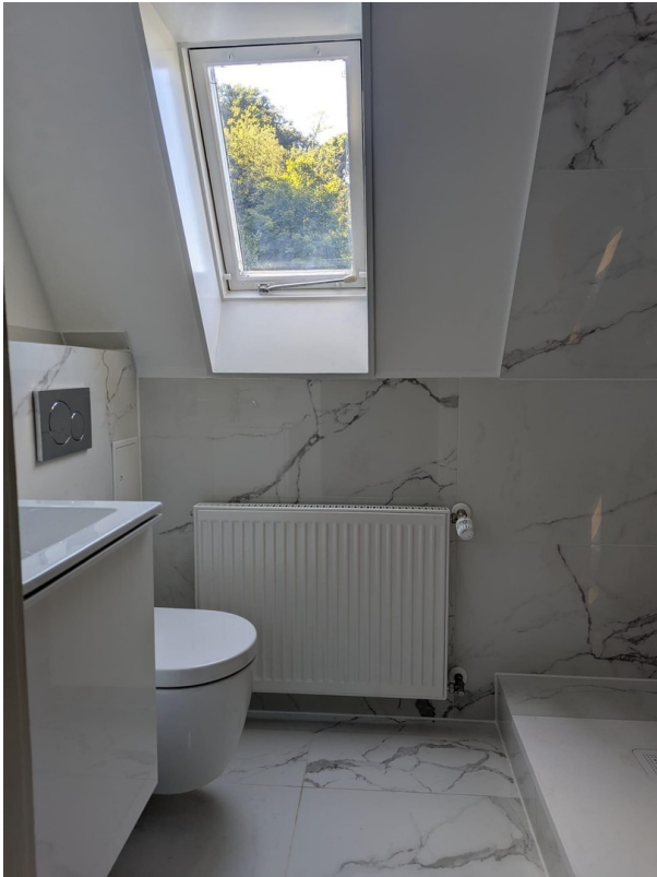
Badezimmer - Bathroom