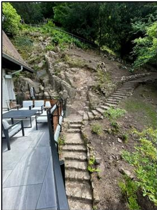
Garten - Garden