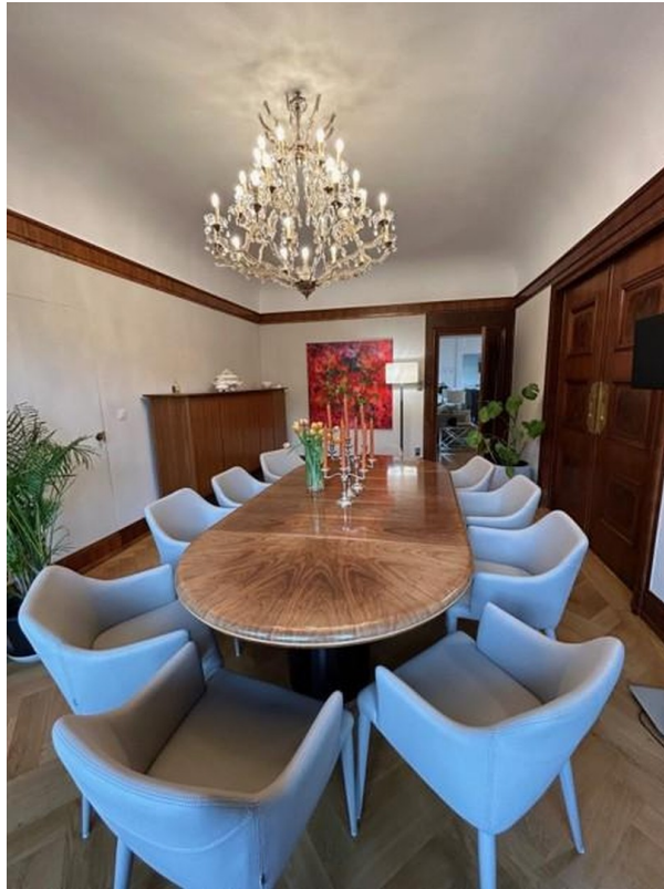
Esszimmer - Dinner