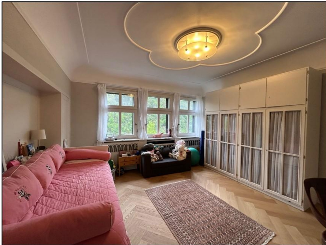
Schlafzimmer - Bedroom