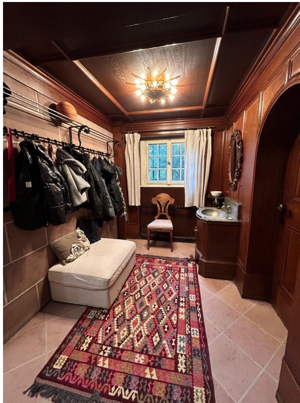
Flür - Hall