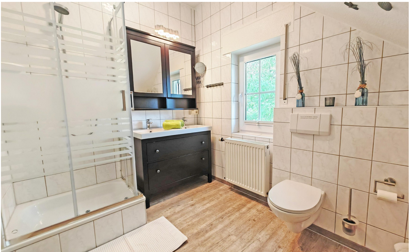
Badezimmer m. Doppelwuschtisch