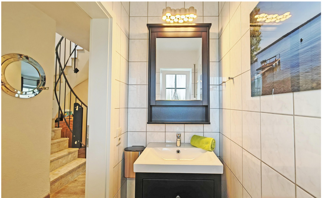
Gäste-WC Ferienhaus Plauer See