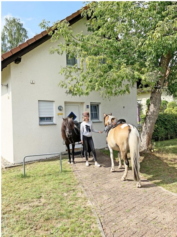
Aus der Haustür - auf's Pferd!