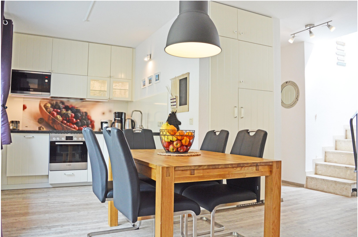
Für 6 Pers. m. Lederstühlen