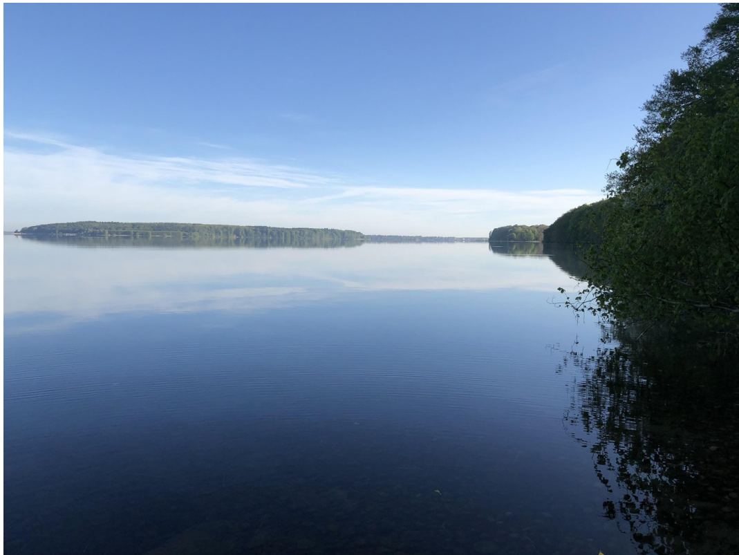
Wunderschöner Plauer See