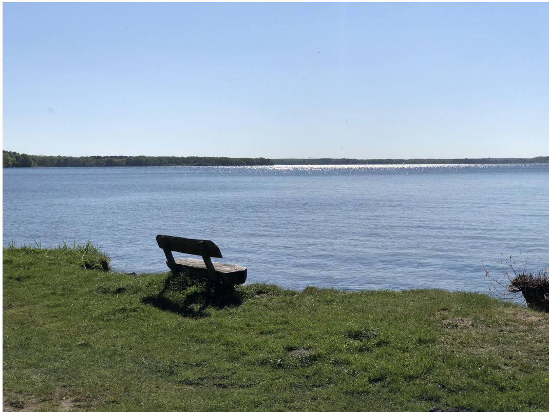
Ihr Platz am Plauer See. :-)