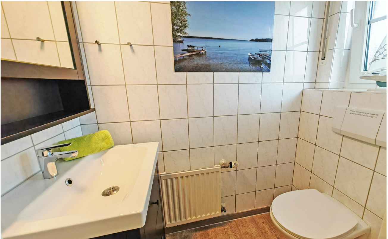
Gäste-WC im Erdgeschoss