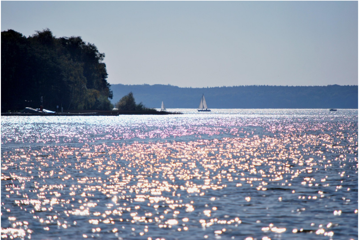
Mit dem Boot auf dem PlauerSee