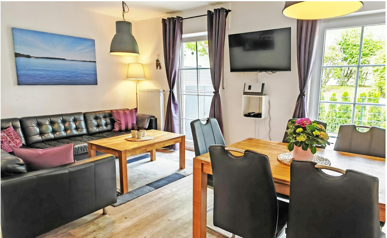
Mit 43" Smart-TV u. Blu-Ray