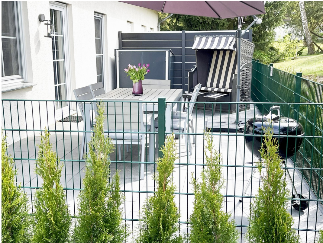
Terrasse m. Grill + Strandkorb