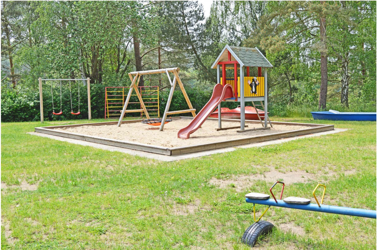
Spielplatz Lenzer Höh nur 100m