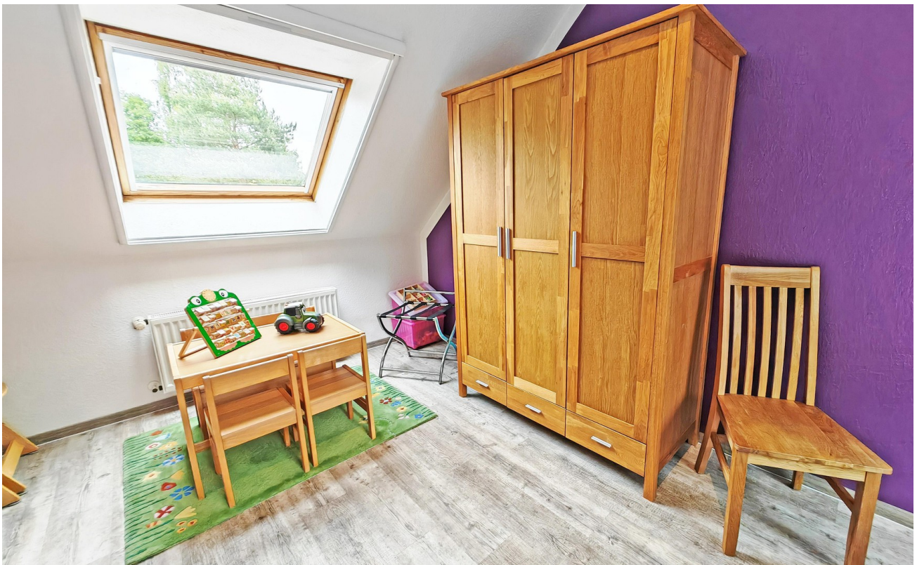
2 Reisebetten, Spielsachen...