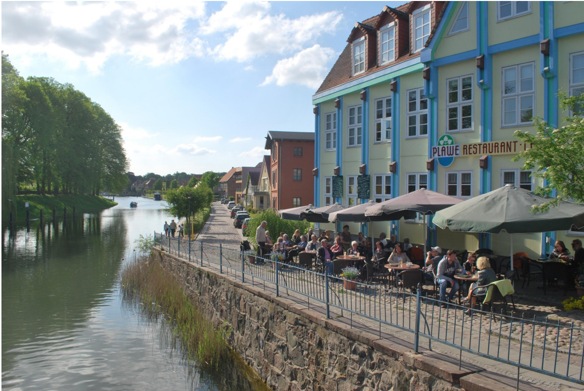
Plau am See m. vielen Cafés...