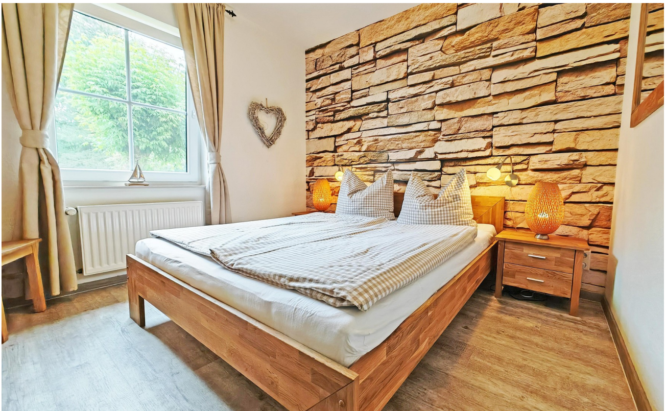
Schlafzimmer voll abdunkelbar