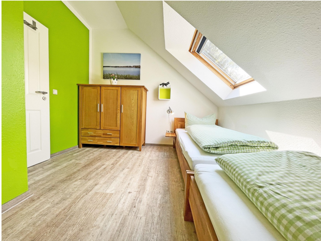
Schlafzimmer m. 2 Einzelbetten