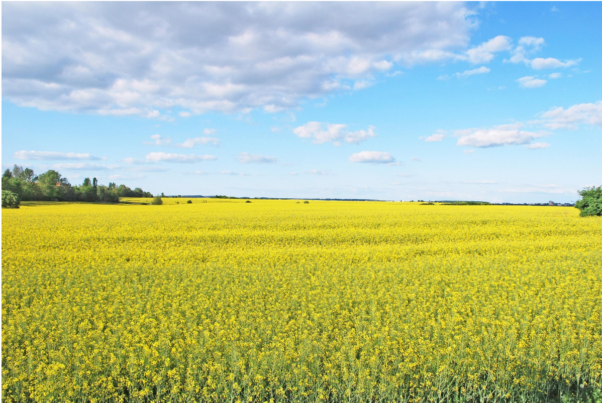
Rapsfelder kurz vor Lenz