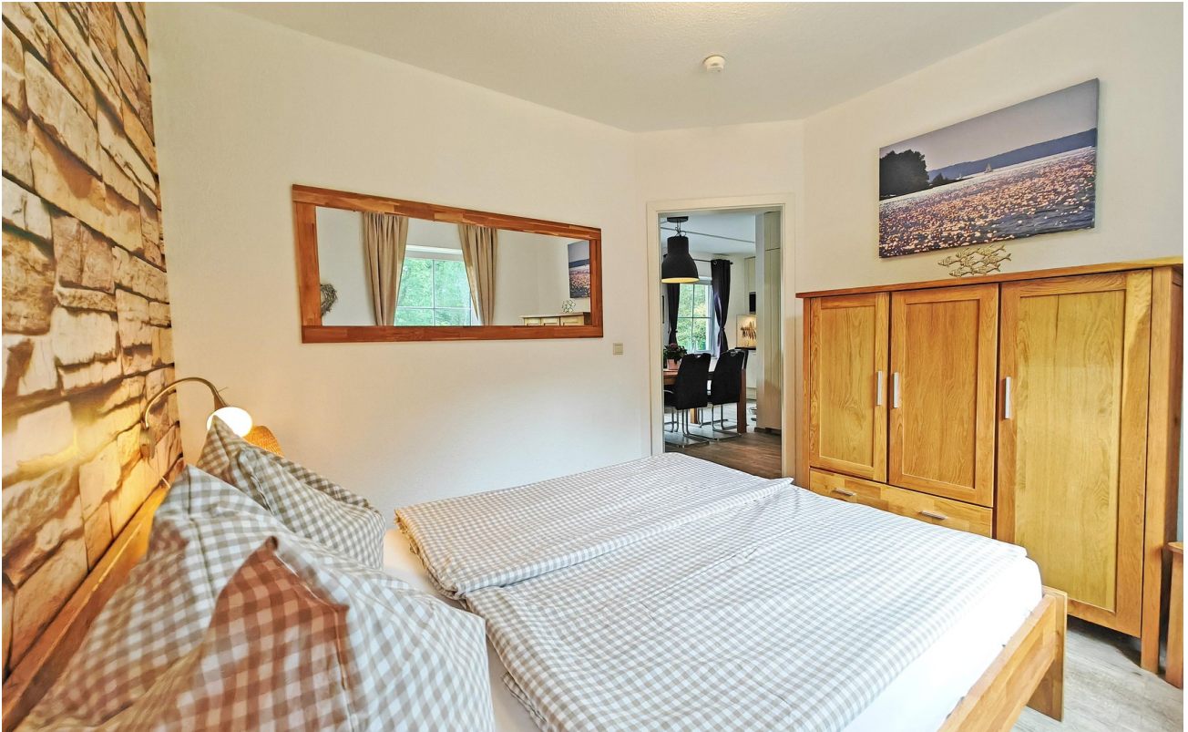
Franz. Bett im Erdgeschoss