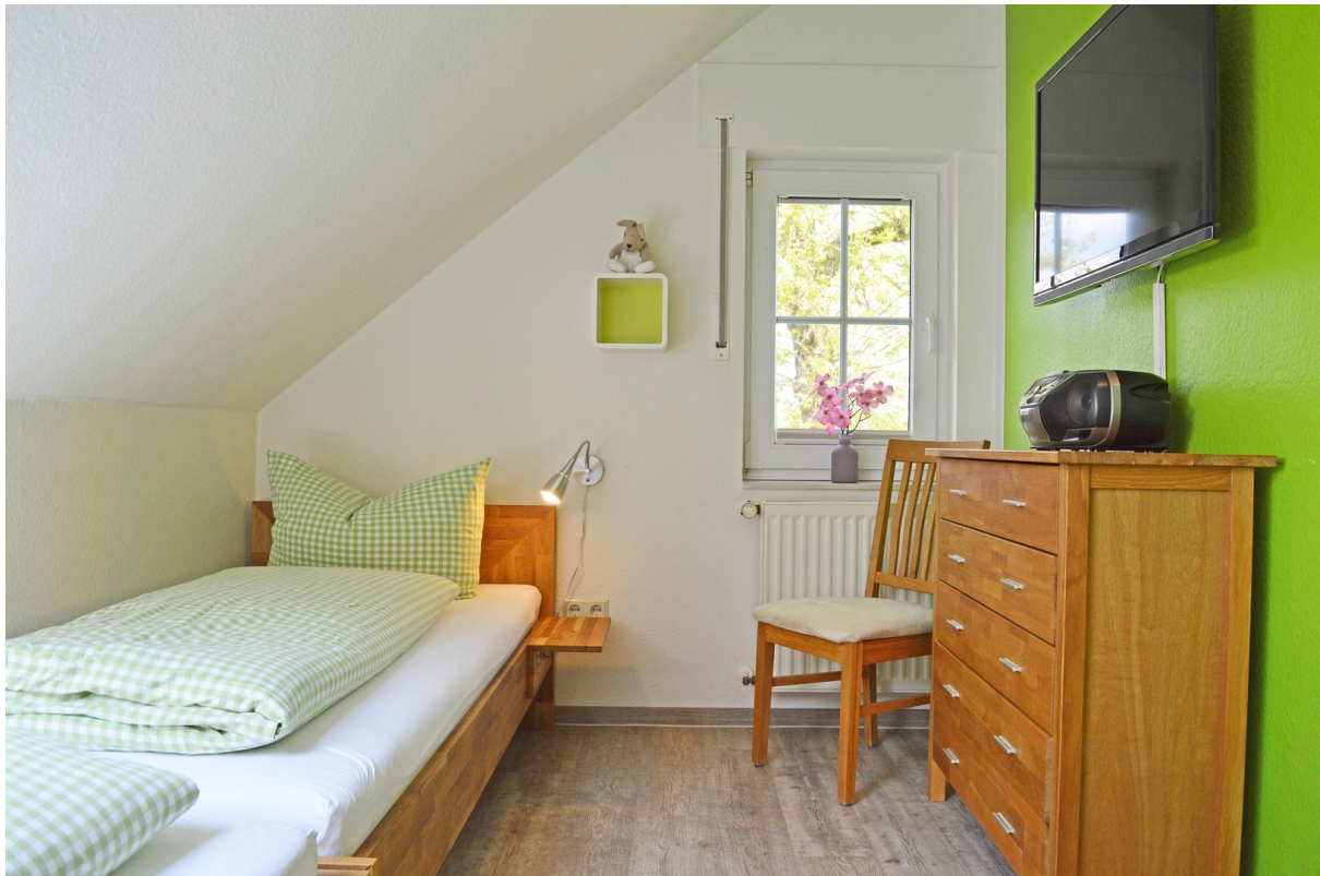
TV u. Blu-Ray, abdunkelbar