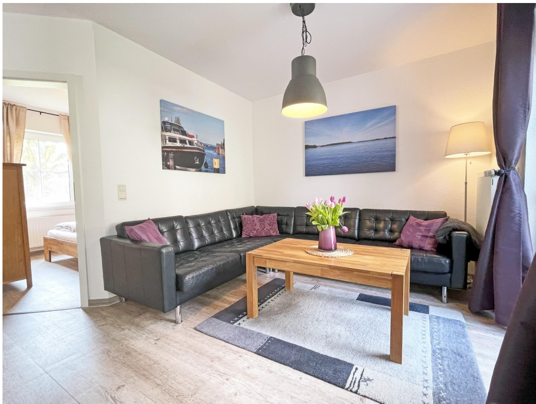
Mit großer Echt-Ledercouch