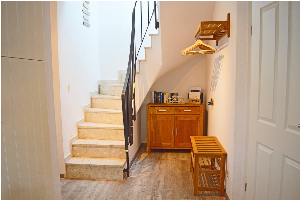
Heller Flur mit Garderobe