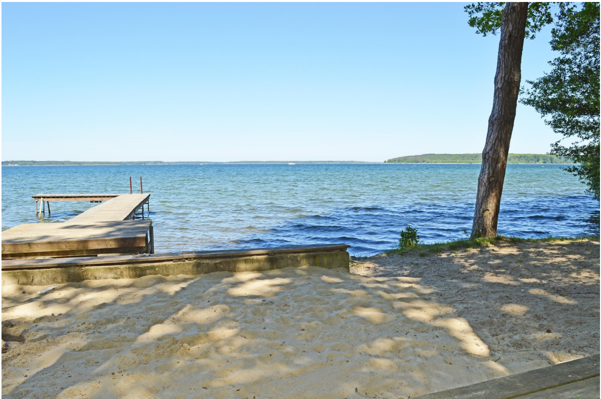
Badestelle Lenzer Höh.