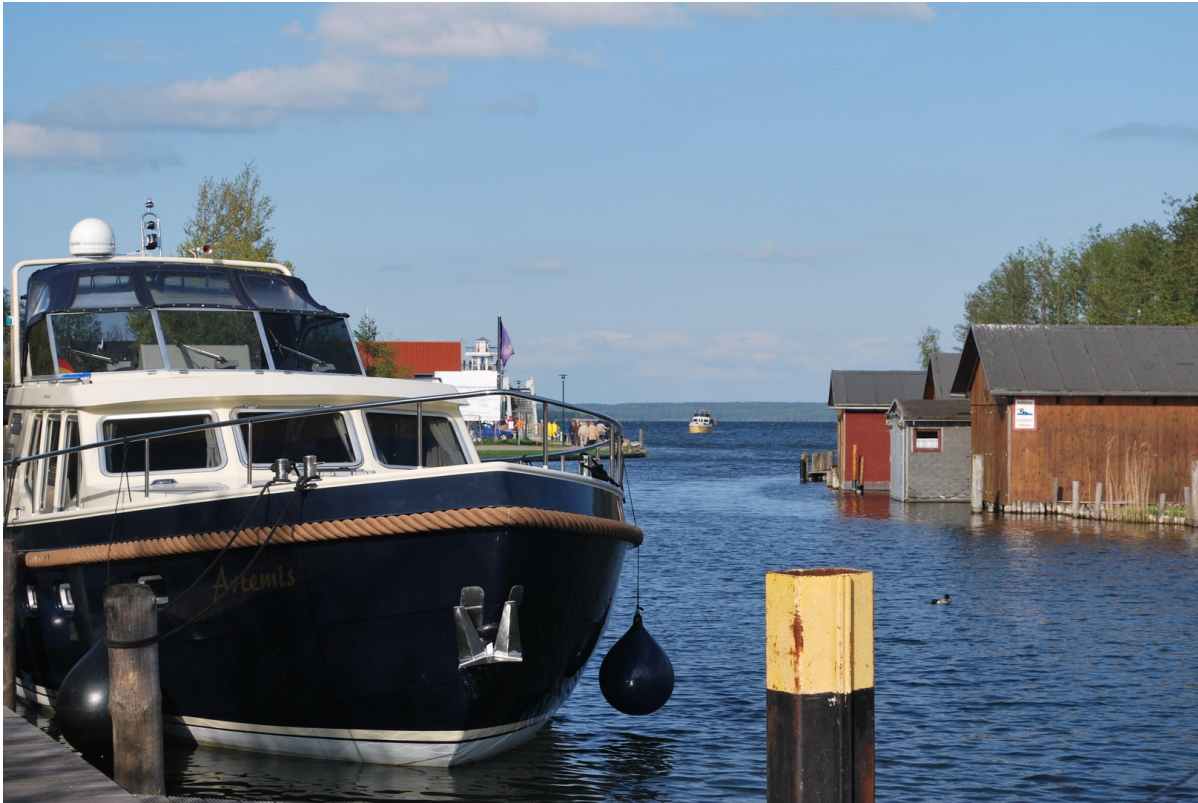
Boote können Sie sich leihen