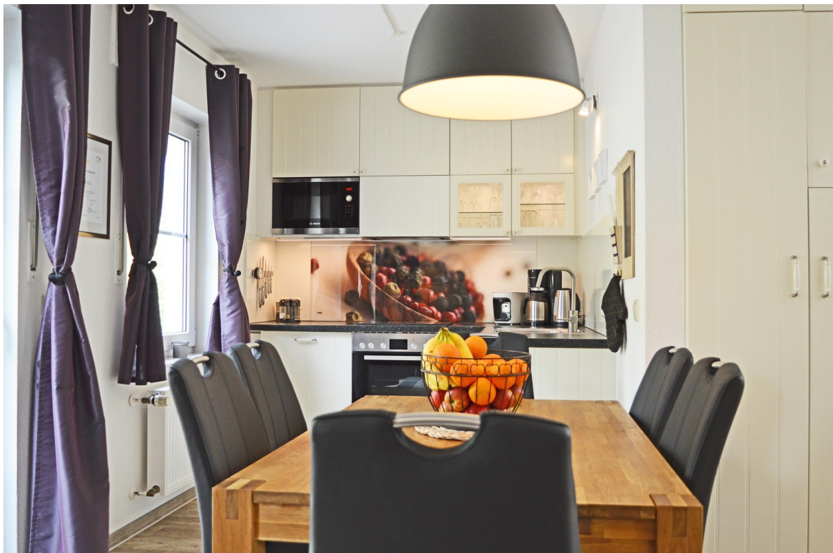
Voll ausgestattete Ikea-Küche