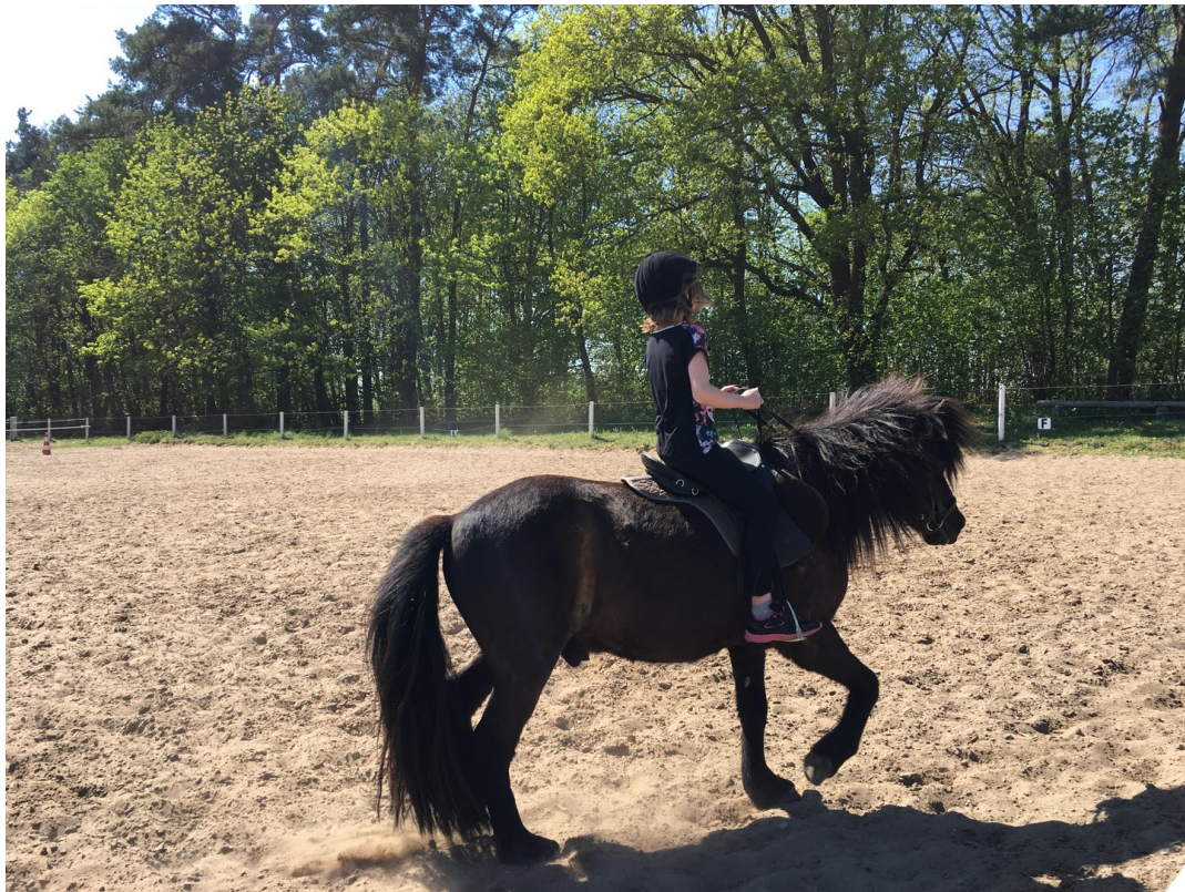
Top Reitunterricht nebenan