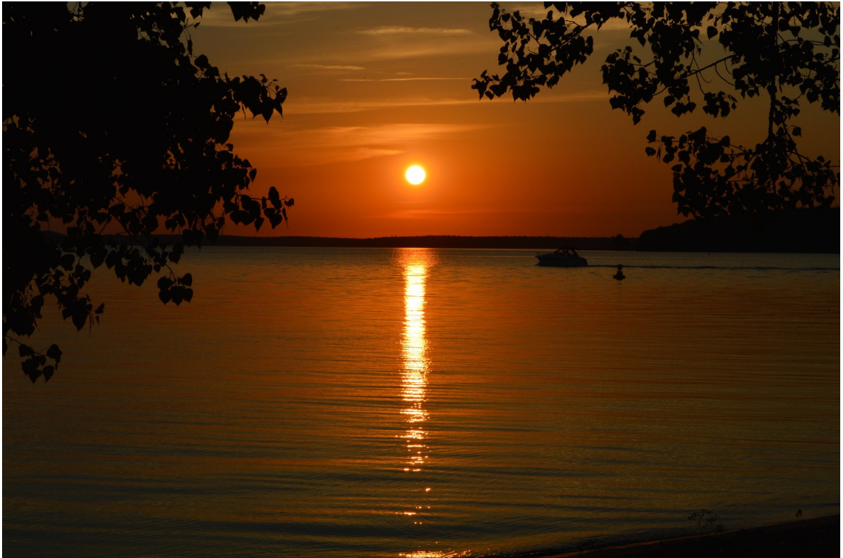
Sonnenuntergang Plauer See