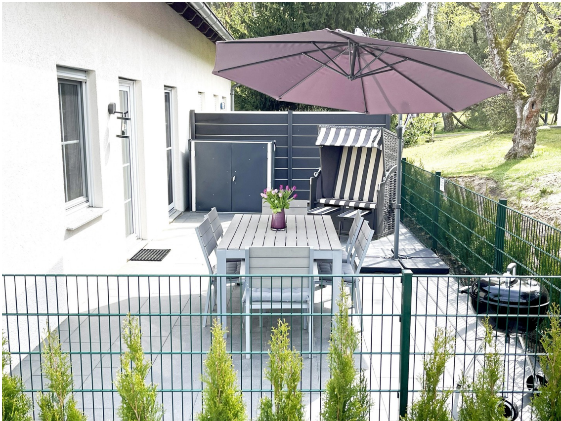
Voll umzäunte Terrasse