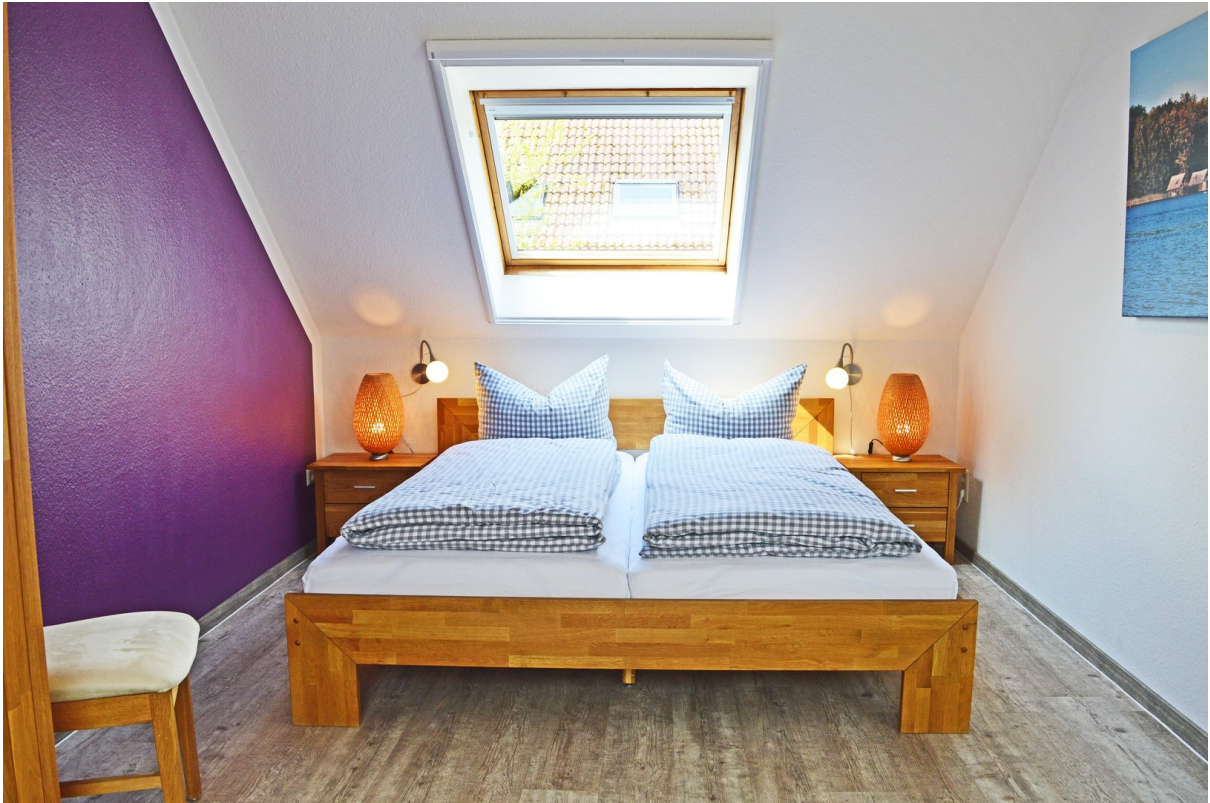
chlafzimmer m. gr. Doppelbett