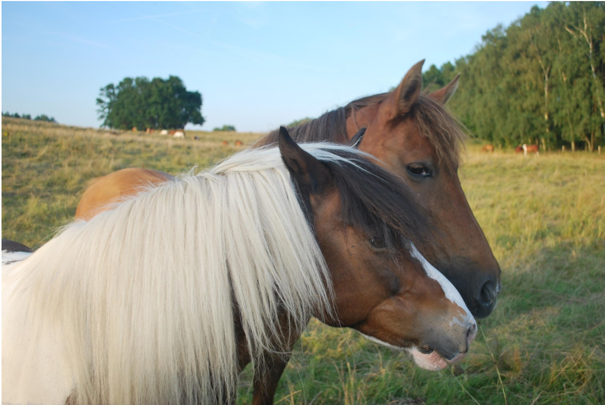
Pferdehof Lenz nebenan