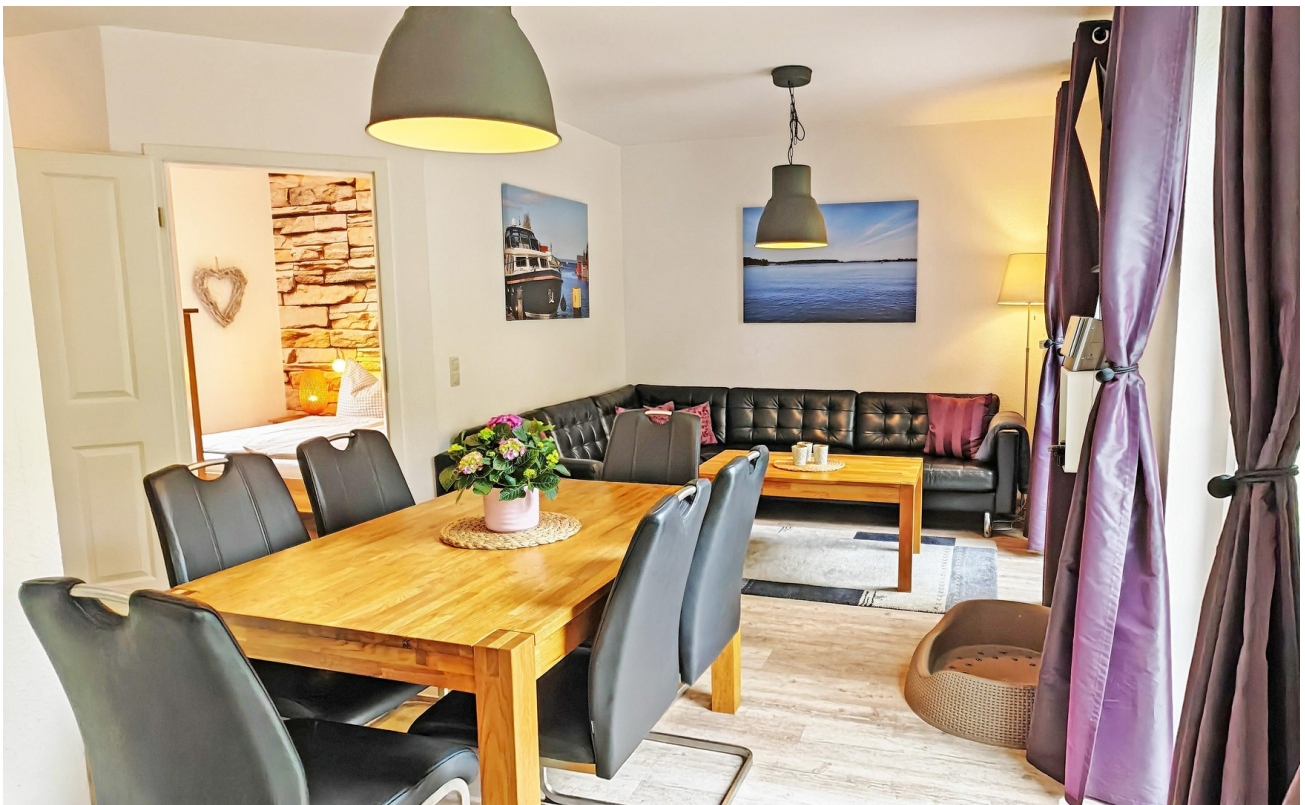
Moderner Ess- u. Wohnbereich