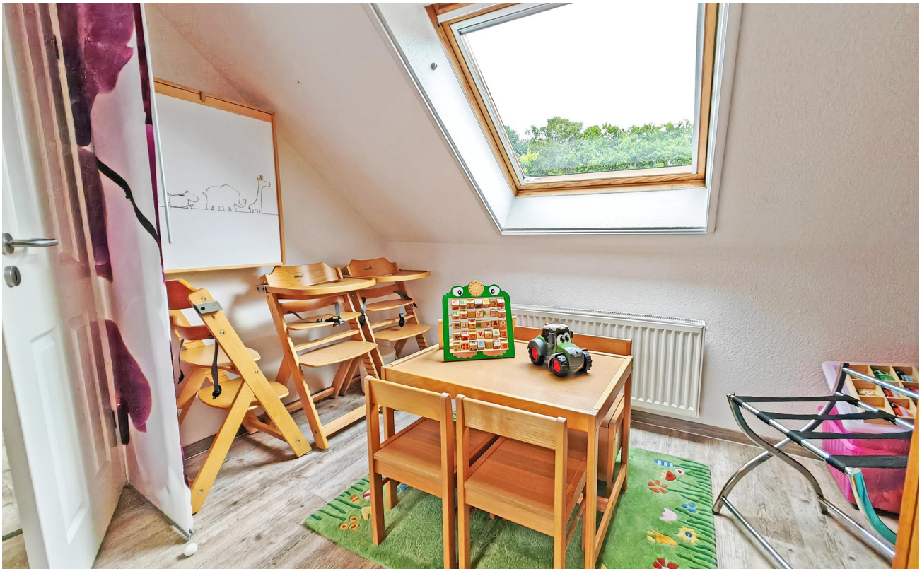
Wickeltisch und 3 Hochstühle