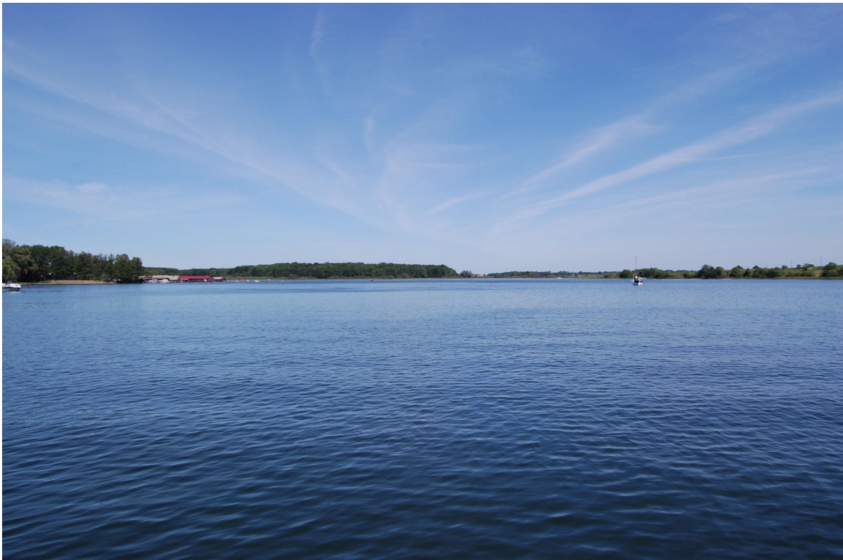
Der Fleesensee bei Malchow