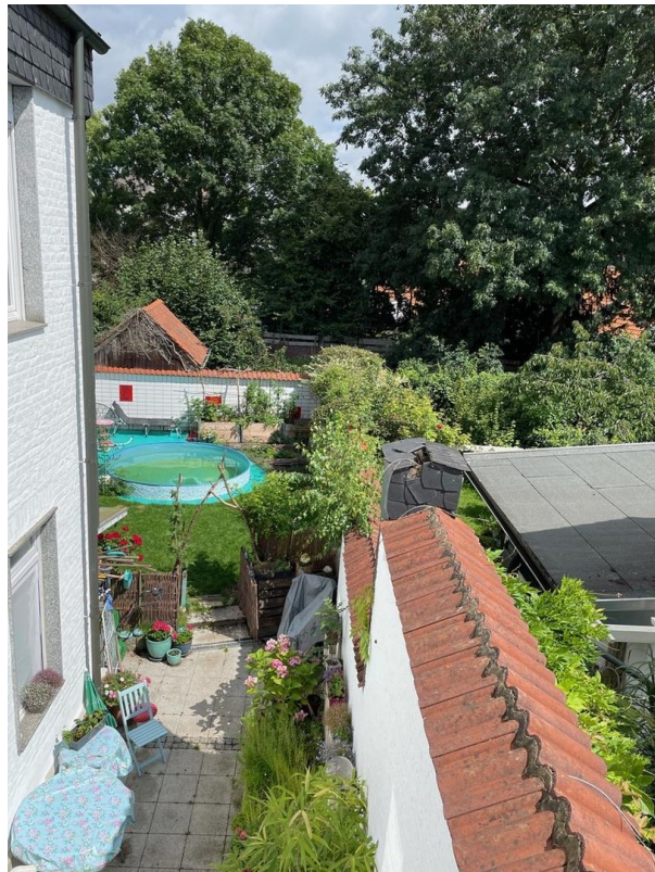
GARTEN IM SOMMER