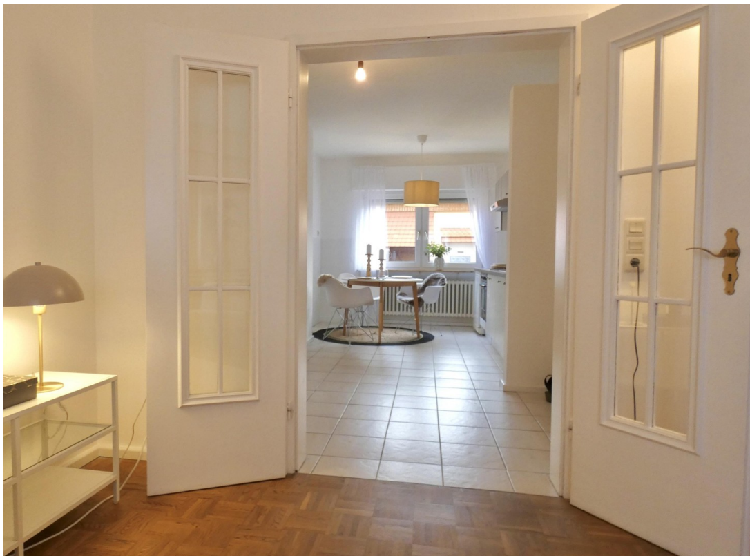
Blick in die Wohnküche