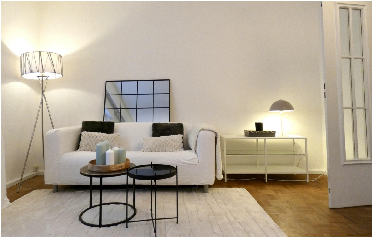
Wohnbereich im grossen Raum