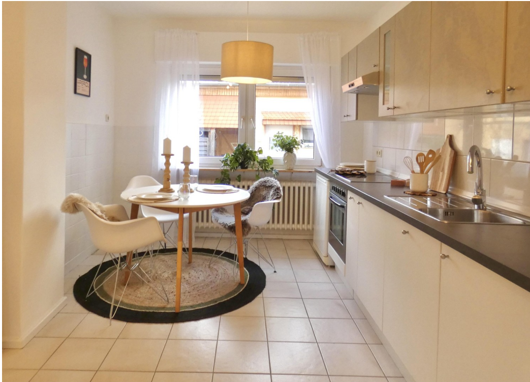
Wohnküche zum Innenhof