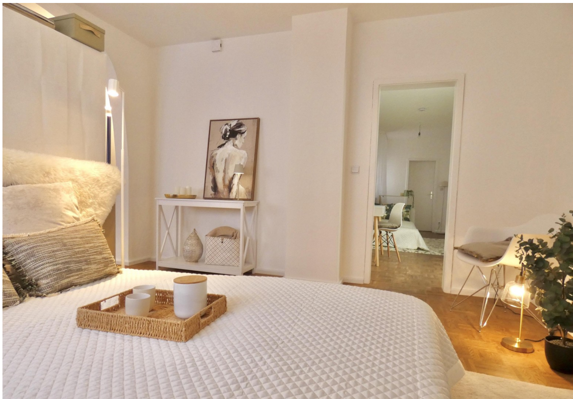
Grosser Raum - Schlafbereich