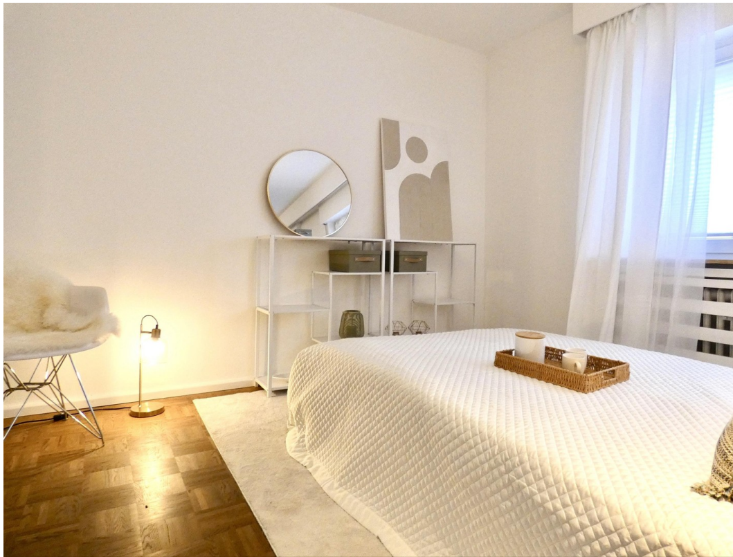
Grosser Raum - Schlafbereich