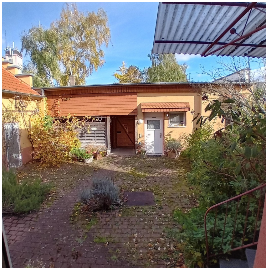
Blick in den Innenhof