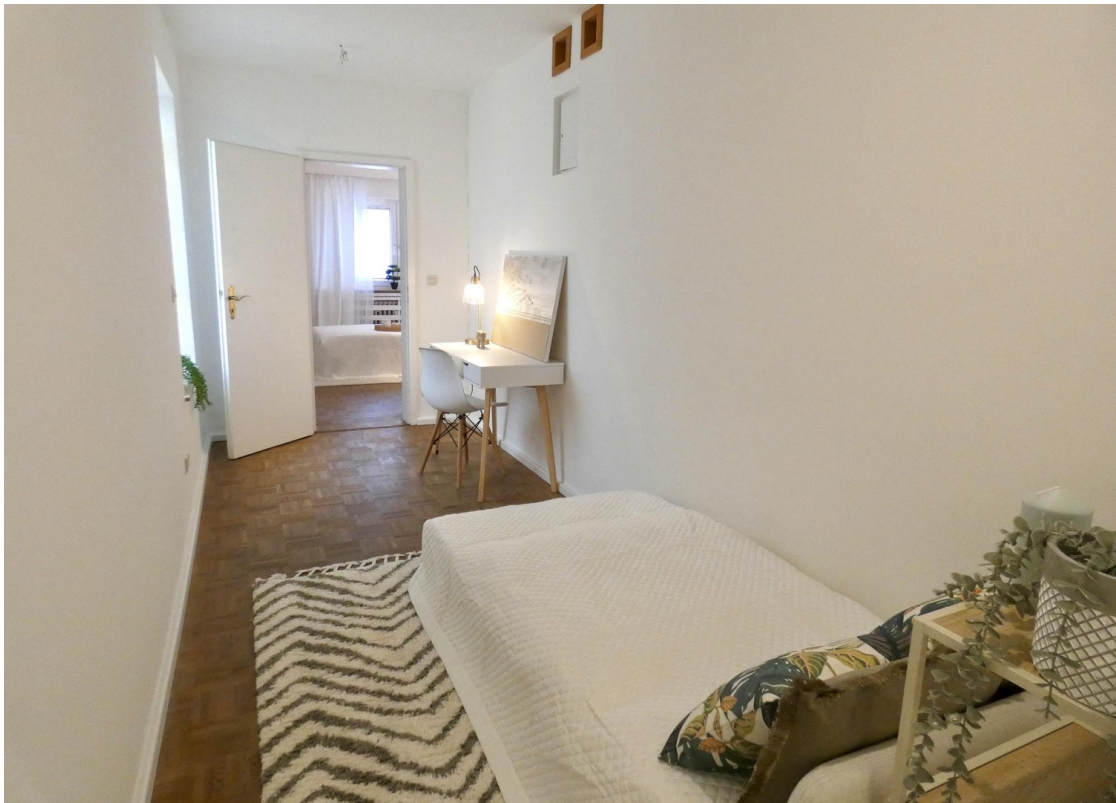
Gästebett / Büro