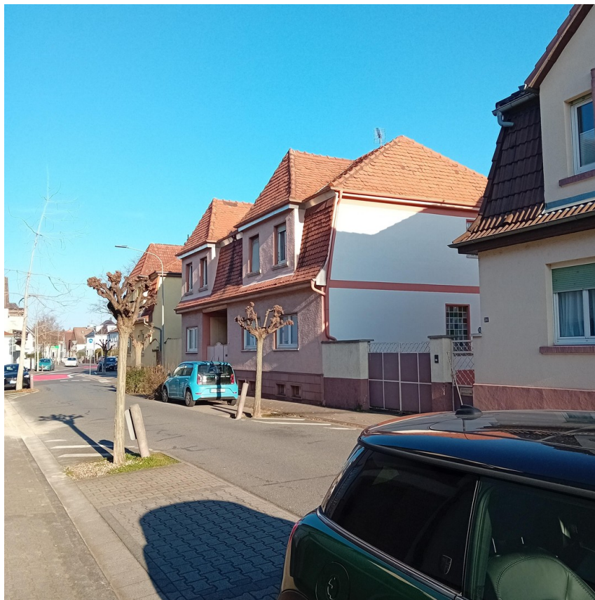
Gedäudeansicht zur Strasse