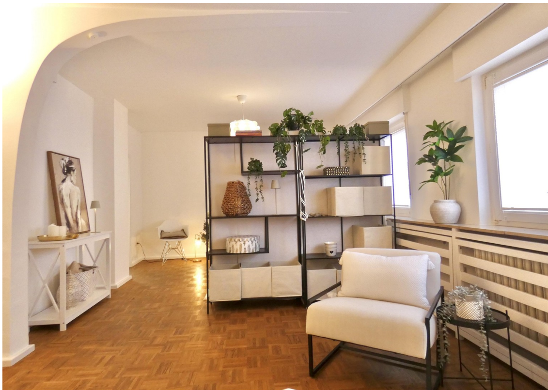
Halbbogen und grosser Raum