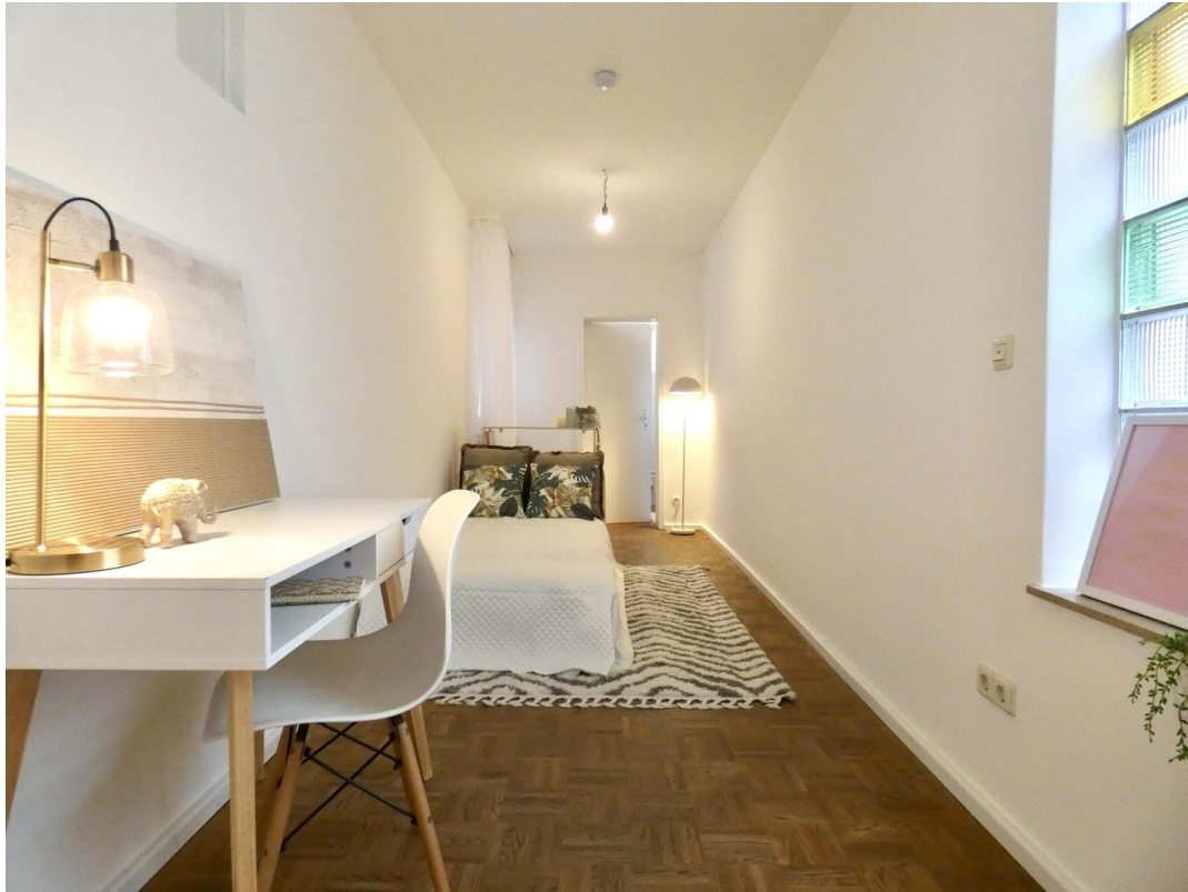
Zimmer zum Tageslichtbad