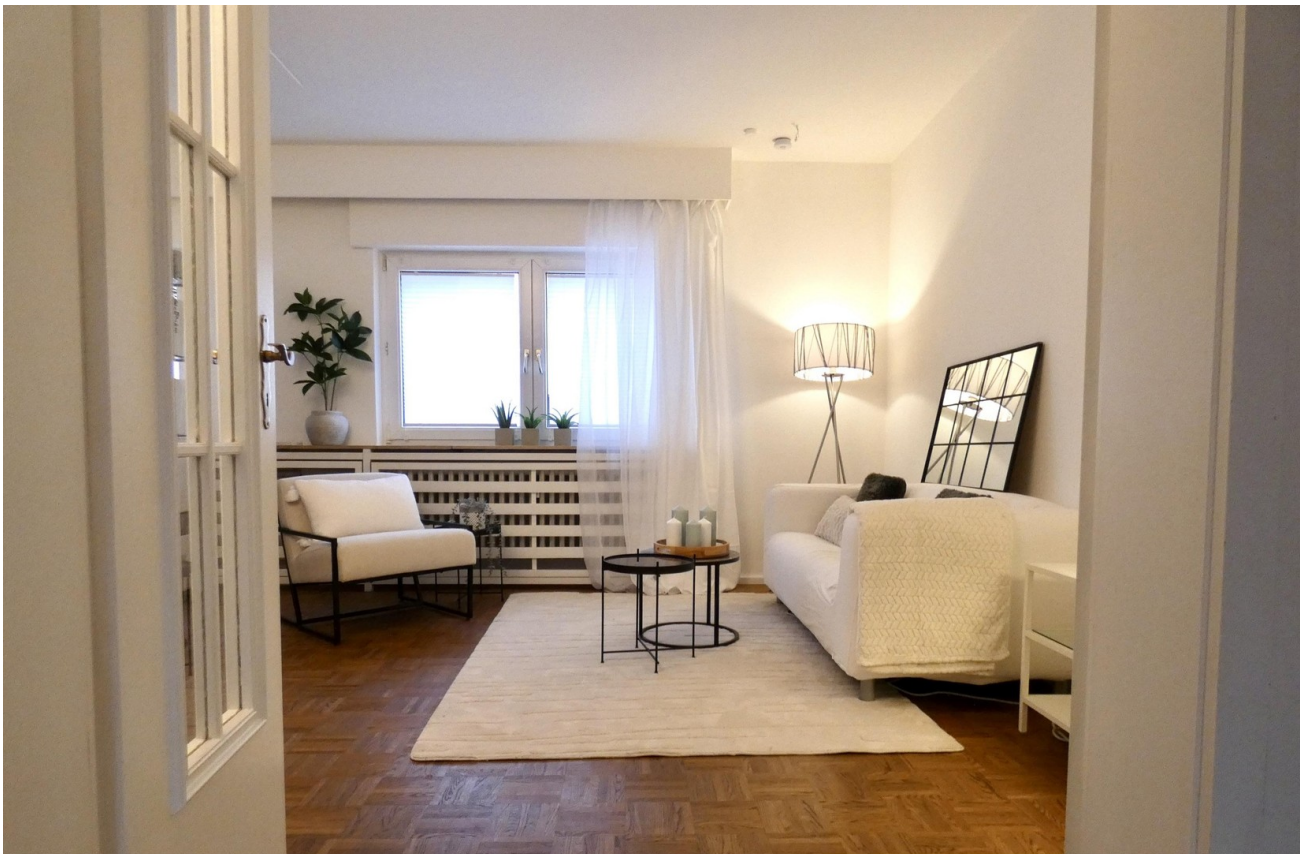
Blick in den grossen Raum