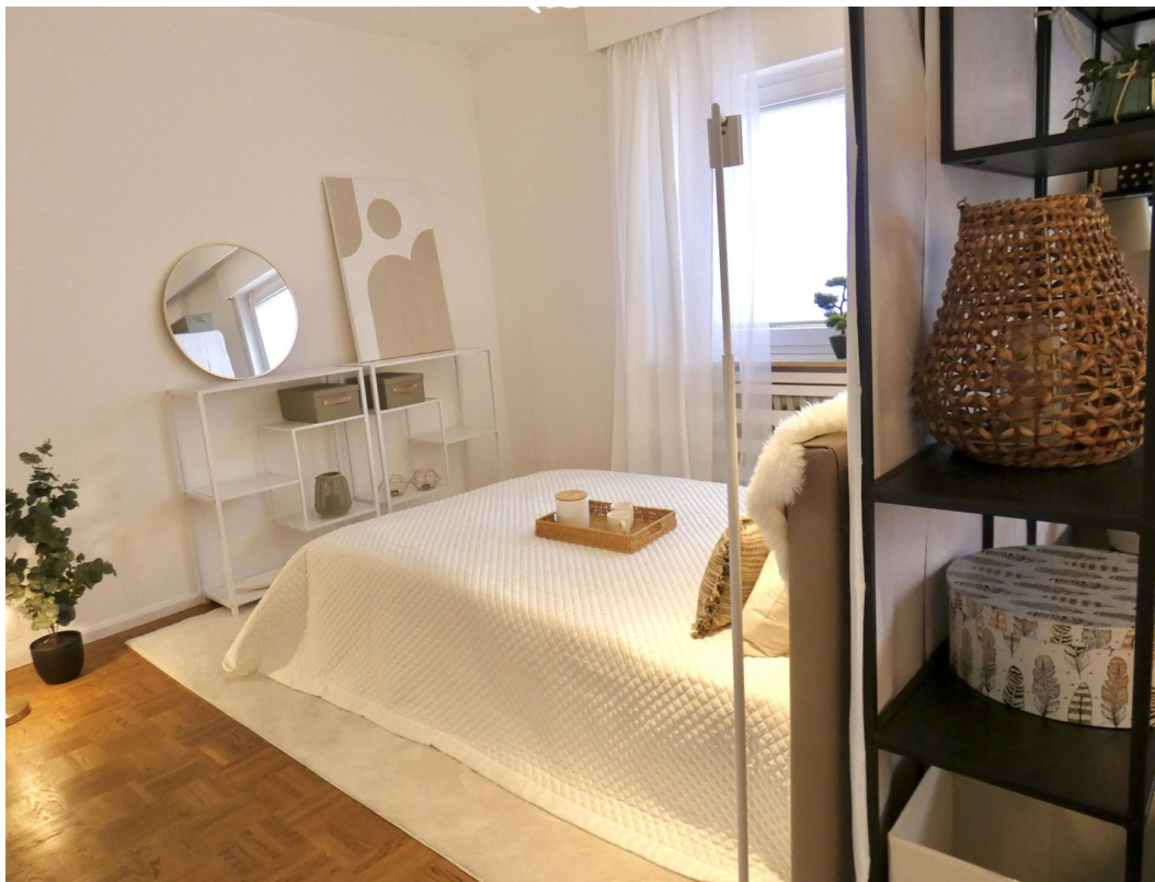
Grosser Raum - Schlafbereich