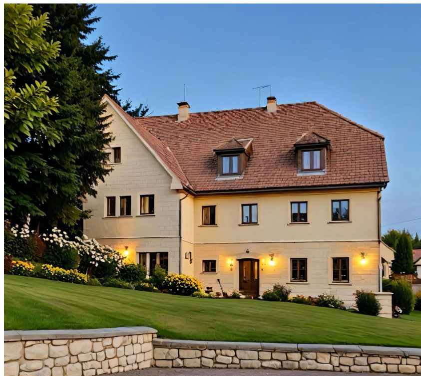
Beispiel nach Fertigstellung