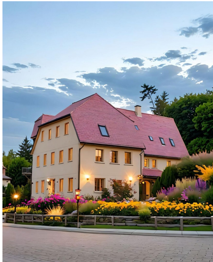
Beispiel nach Fertigstellung