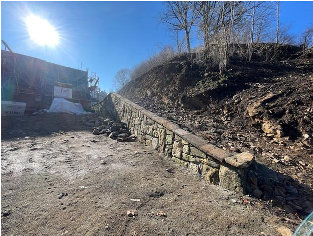
Zuegung mit neu err. Mauer