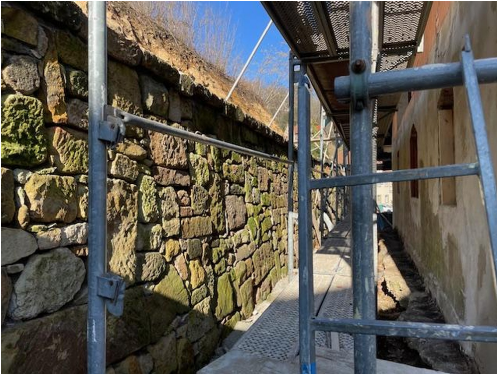
rückwärtige Mauer neu hergest.