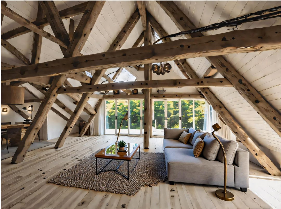
Bsp. Dachgeschoss Hangseite