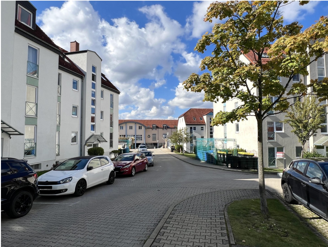
Blick in die Straße