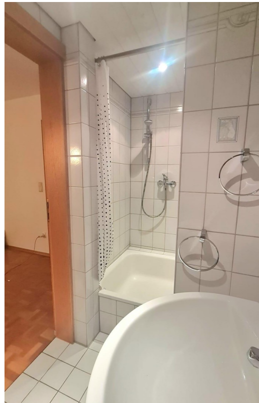
Bad in ELW (Dusche)