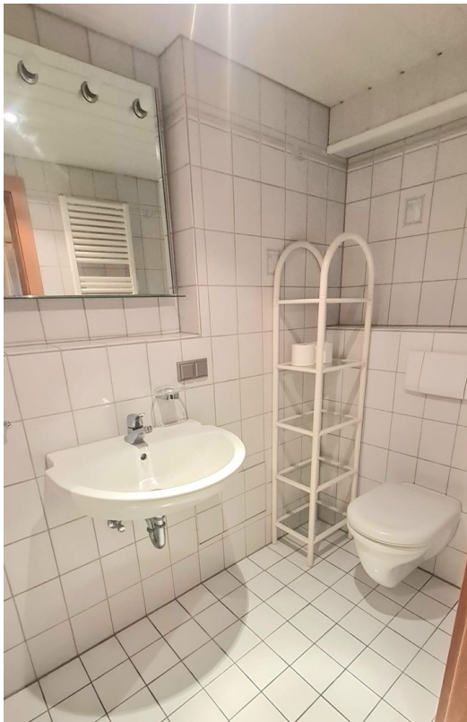
Bad in ELW