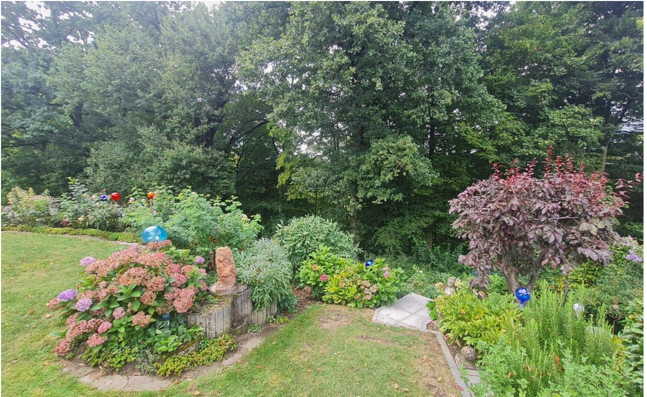
Blick in den Garten