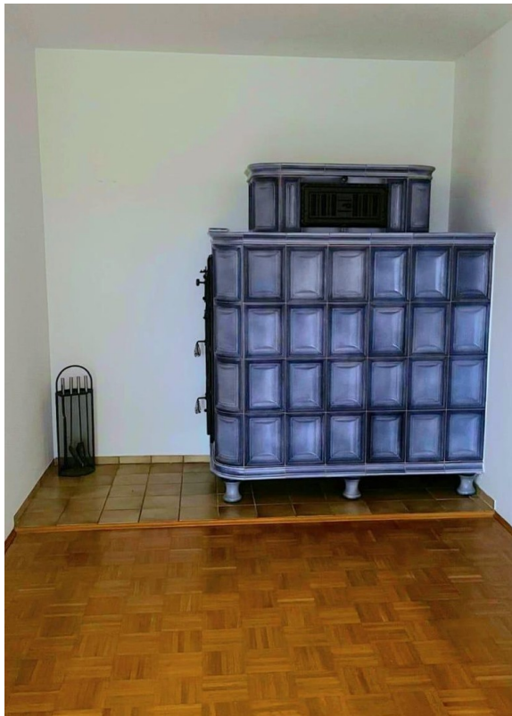
Kachelofen (im Wohnzimmer)