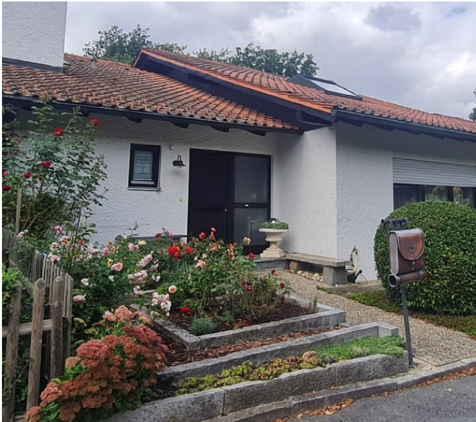
Zugang zum Haus