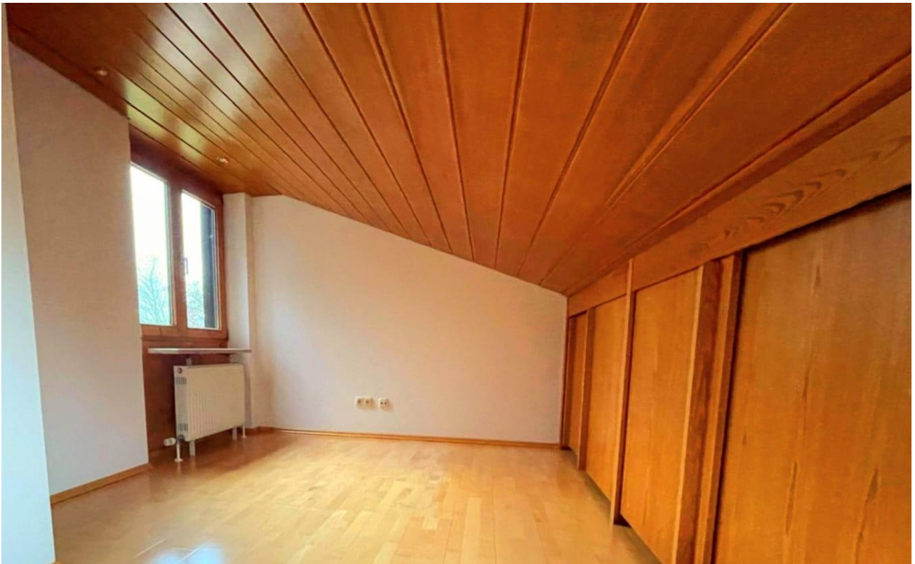
Kind 2 (Zwischenebene)