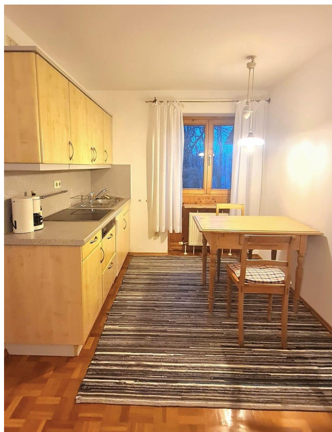
Küche in der ELW