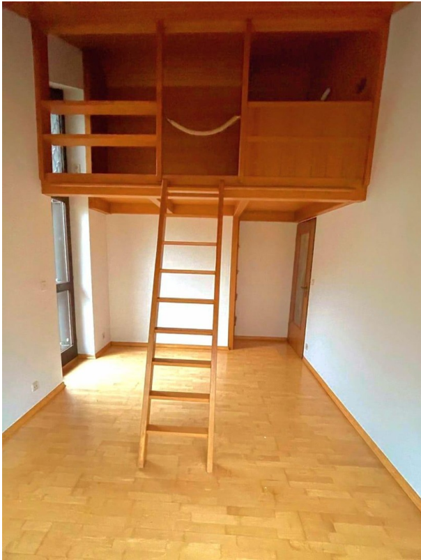
Kind 1 (Galerie)