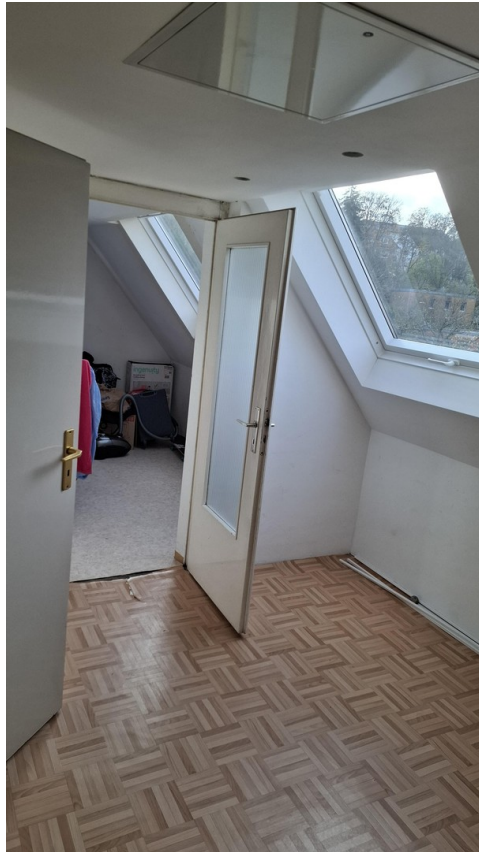
DG Zimmer links