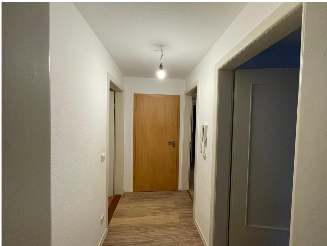
1. Stock Flur