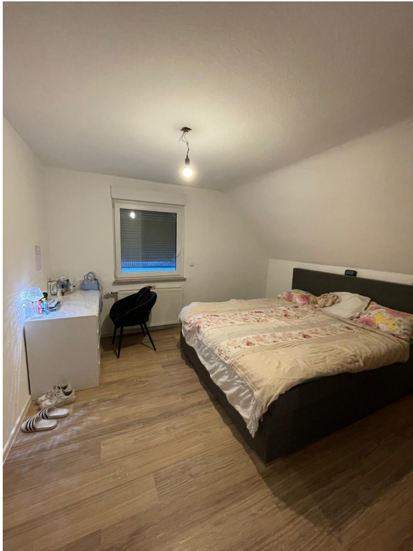
1. Stock Schlafzimmer