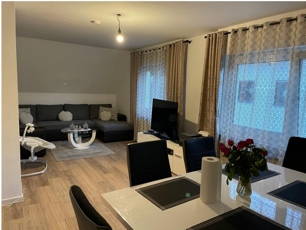
1. Stock Wohnzimmer