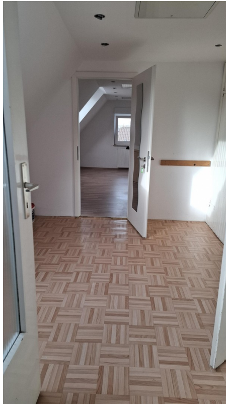
DG Zimmer rechts