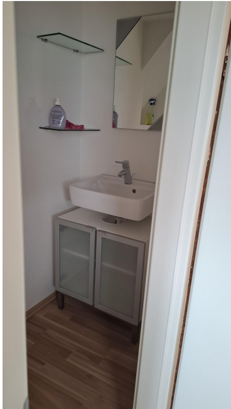
DG Zimmer rechts WC