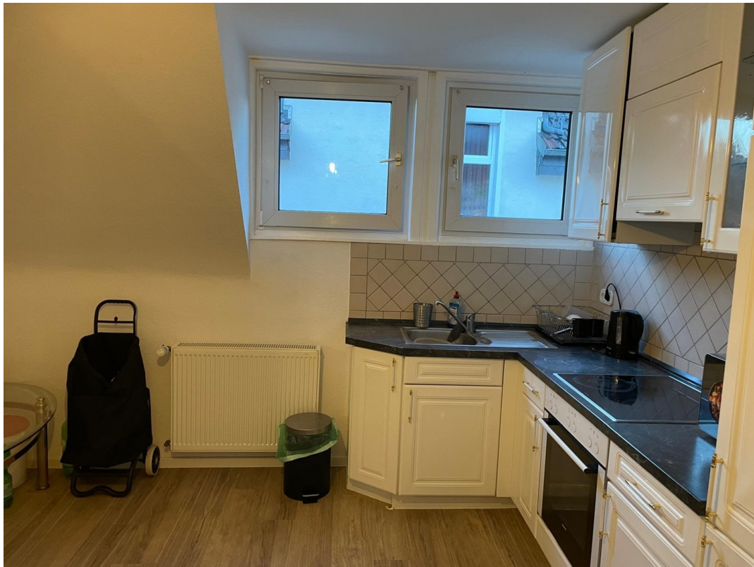
1. Stock Küche