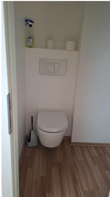
DG Zimmer rechts WC