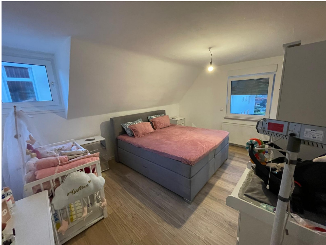
1. Stock Kinderzimmer