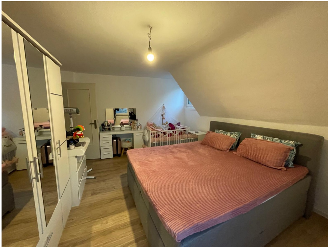
1. Stock Kinderzimmer