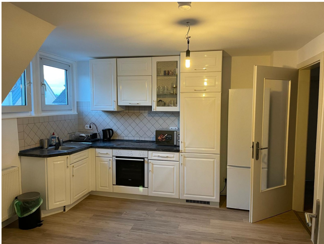
1. Stock Küche