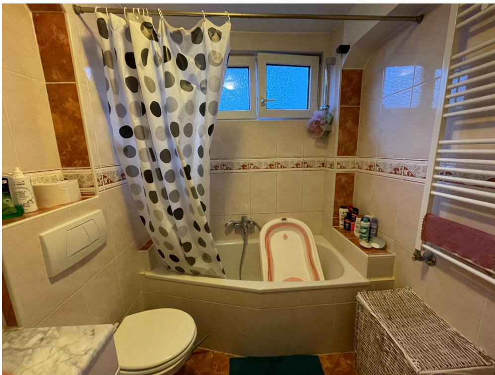
1. Stock Bad