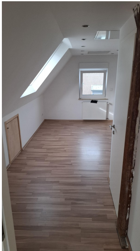
DG Zimmer rechts