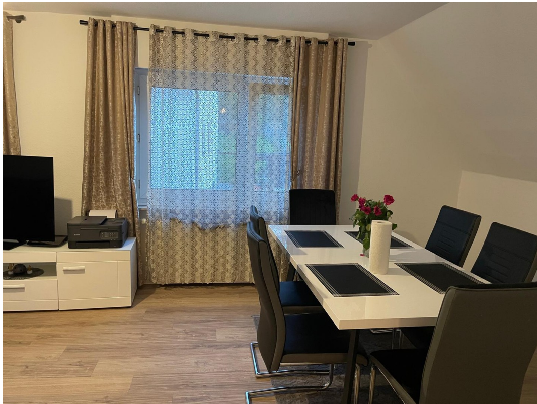
1. Stock Wohnzimmer