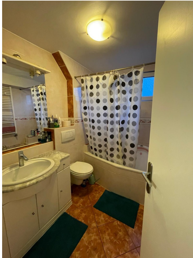
1. Stock Bad