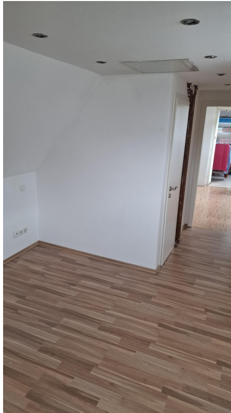
DG Zimmer rechts