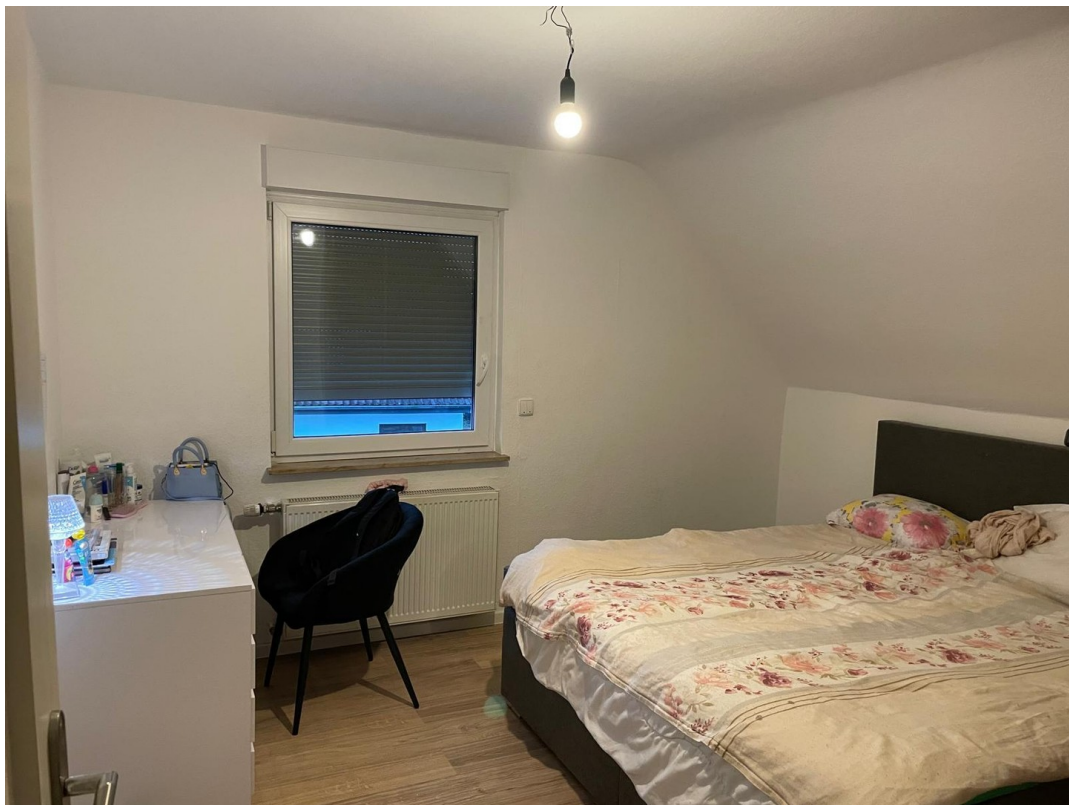
1. Stock Schlafzimmer