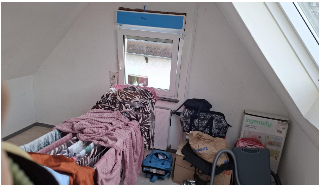
DG Zimmer links