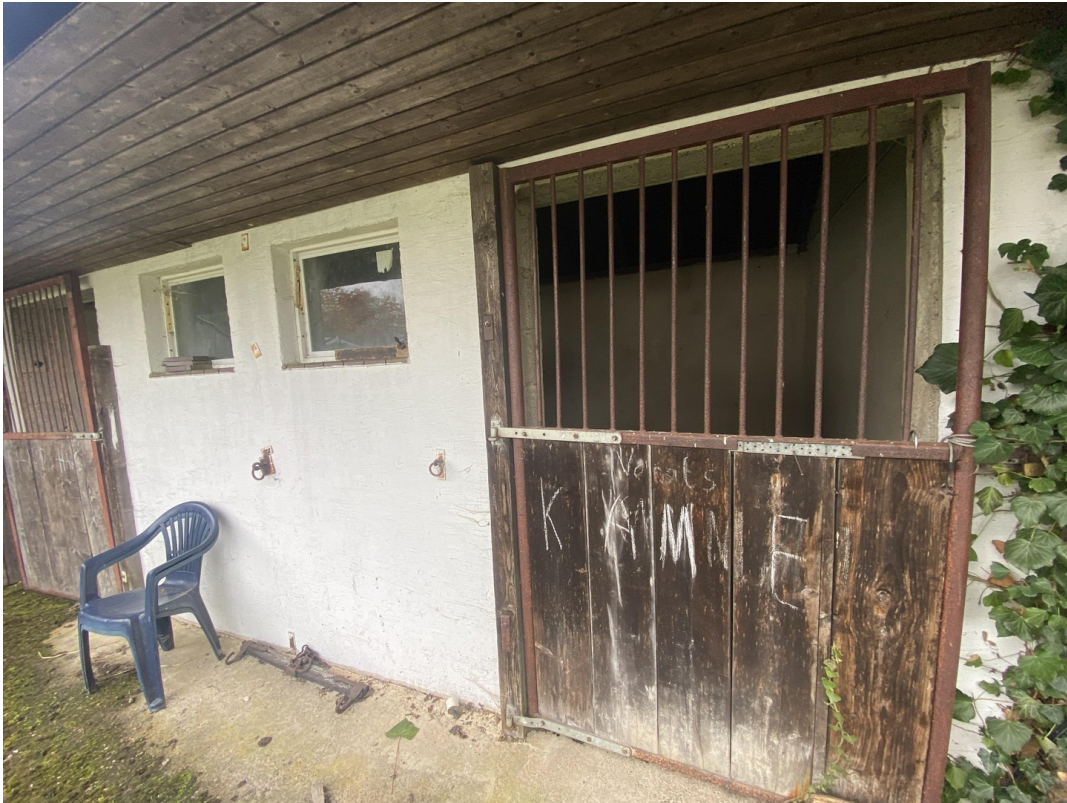
Pferdestall mit 2 Boxen