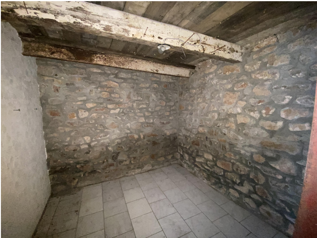
Nutzraum im Eingangsbereich