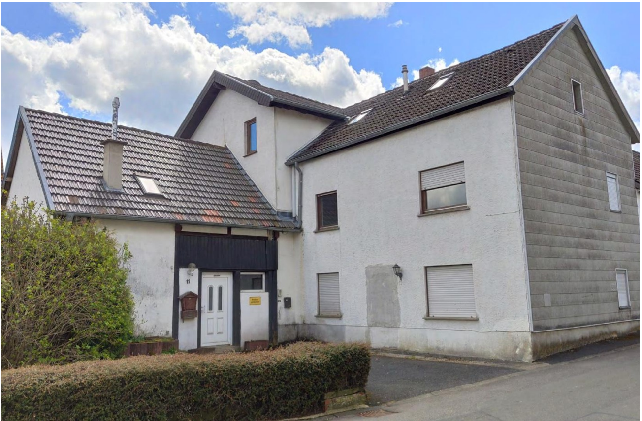
Haus von der Vorderseite