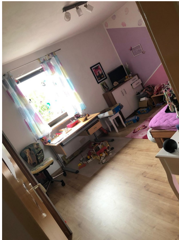
Zimmer 1. OG