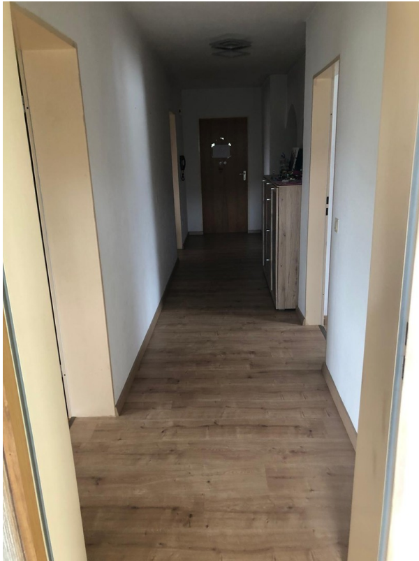
Flur 1. OG