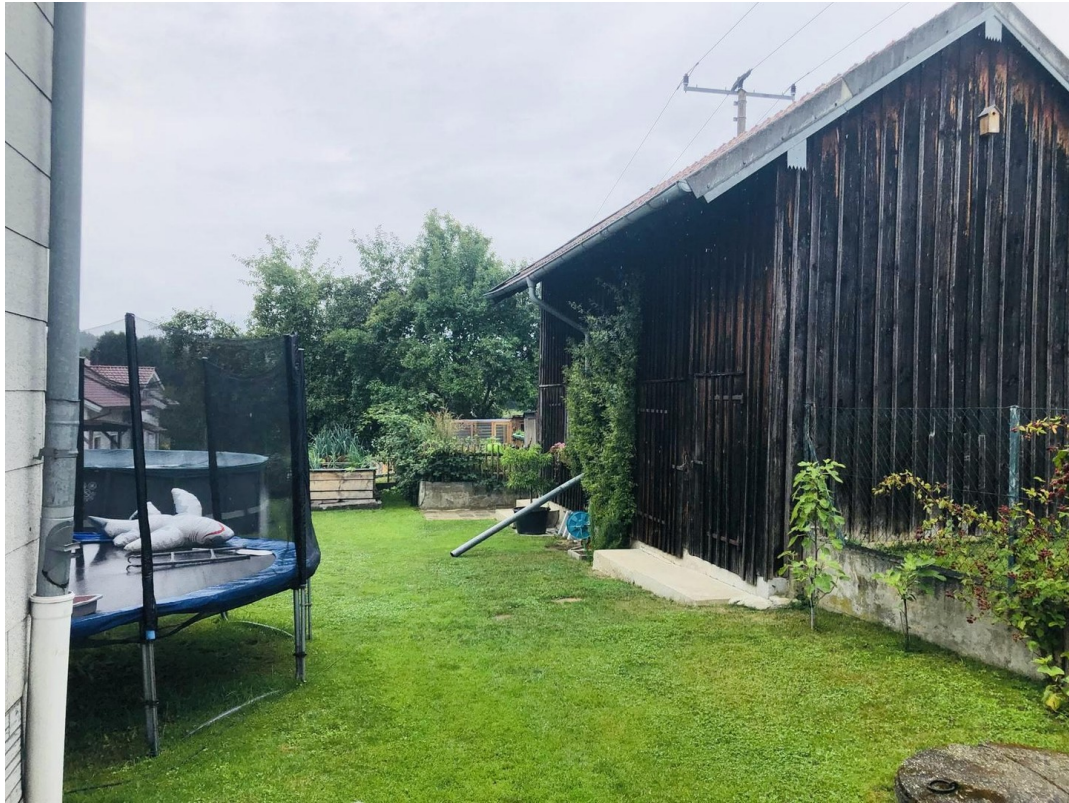
Garten mit Schuppen