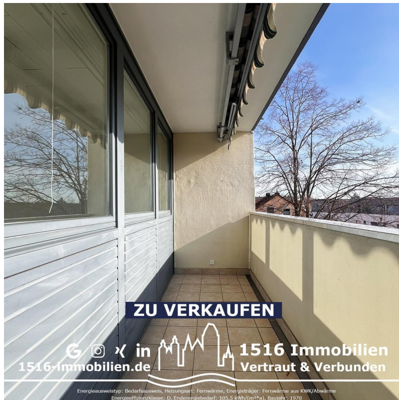
Balkon - Südausrichtung