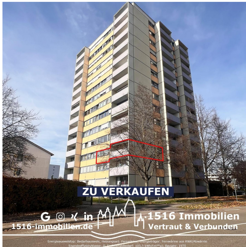
Außen - Gesamt