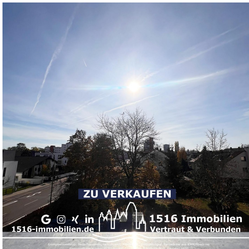
Aussicht - Balkon