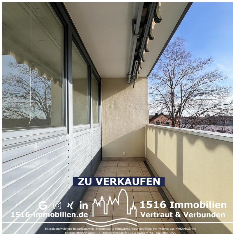
Balkon - Südausrichtung