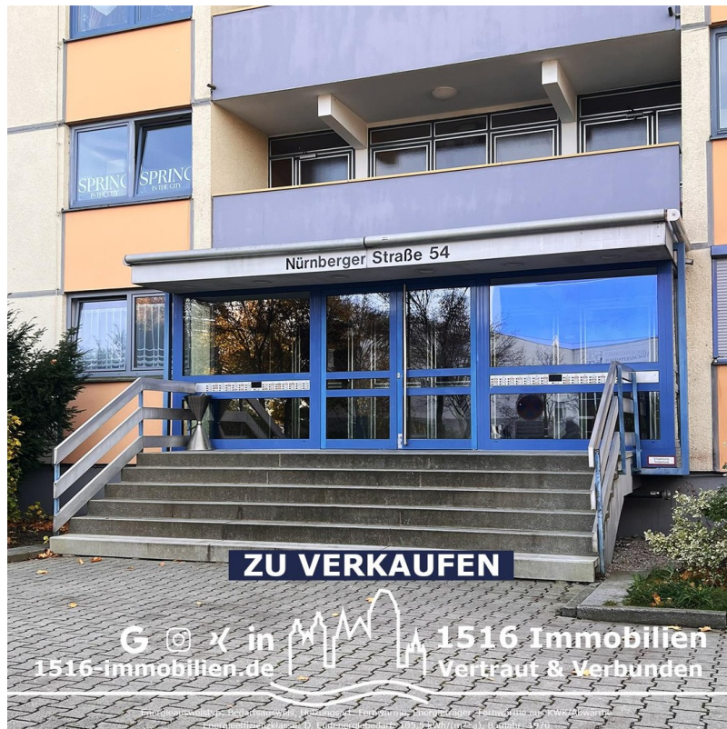
Außen - Eingang