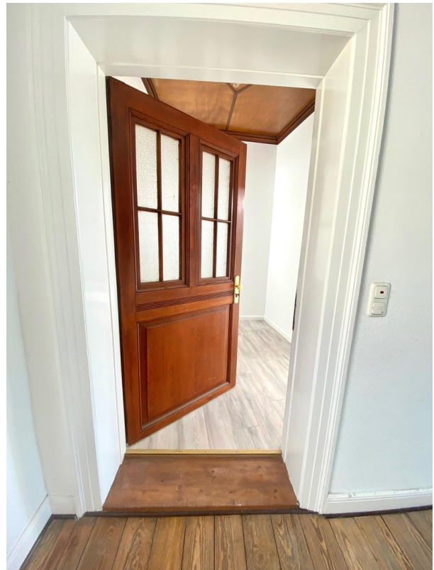
separater Eingang Homeoffice