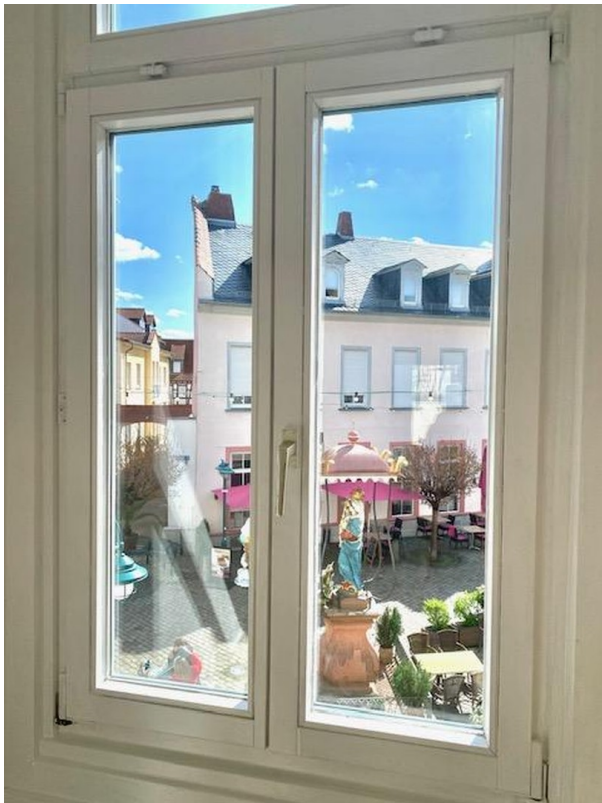
Blick auf die Madonna