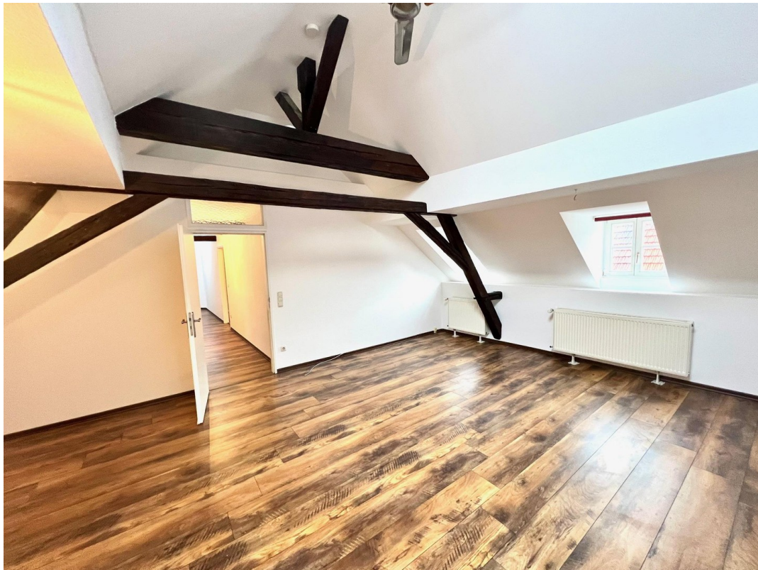
Wohnzimmer Raumhöhe 4 Meter