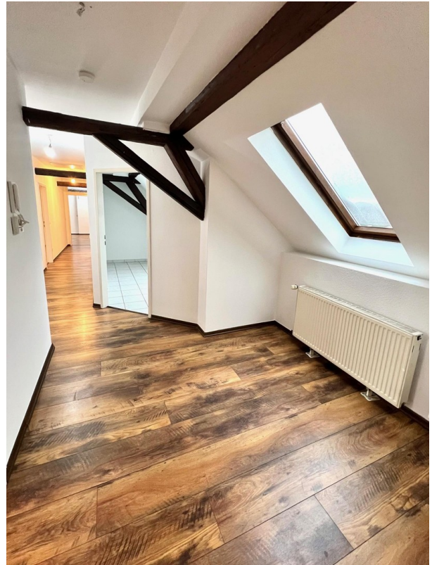
Eingang der Wohnung