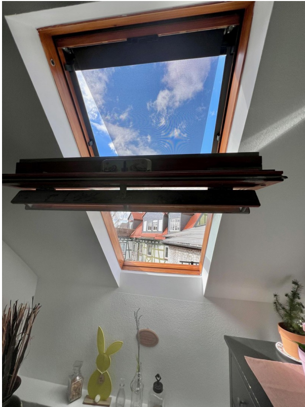
Blick Richtung Hof