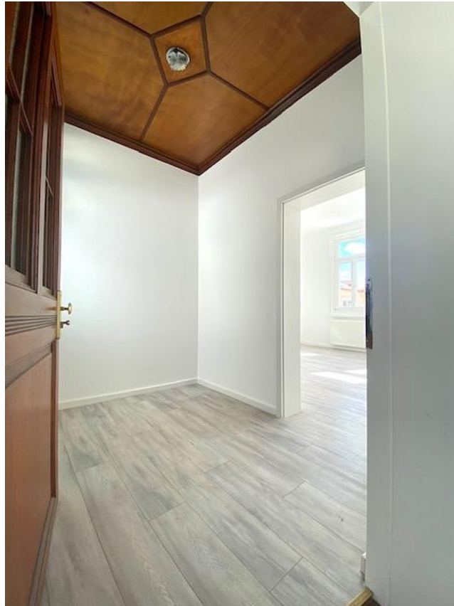
Zusätzliches separates Büro