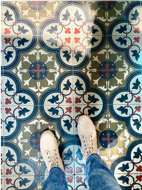
Fussboden im Treppenhaus