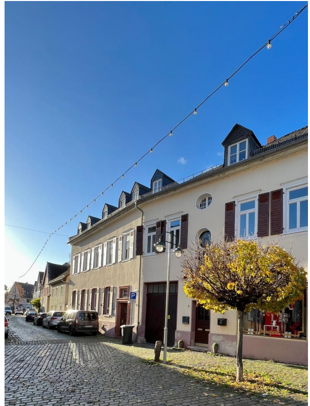
Haus von aussen