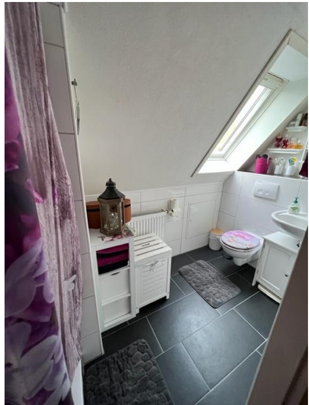
Duschbad OG links