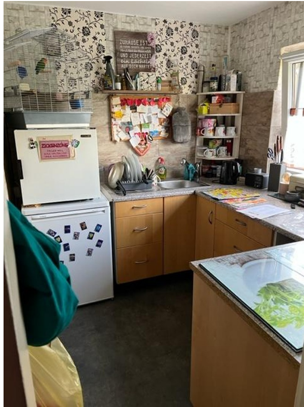
Küche EG rechts