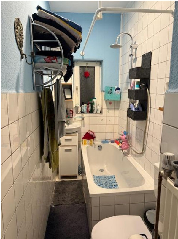
Wannenbad EG links