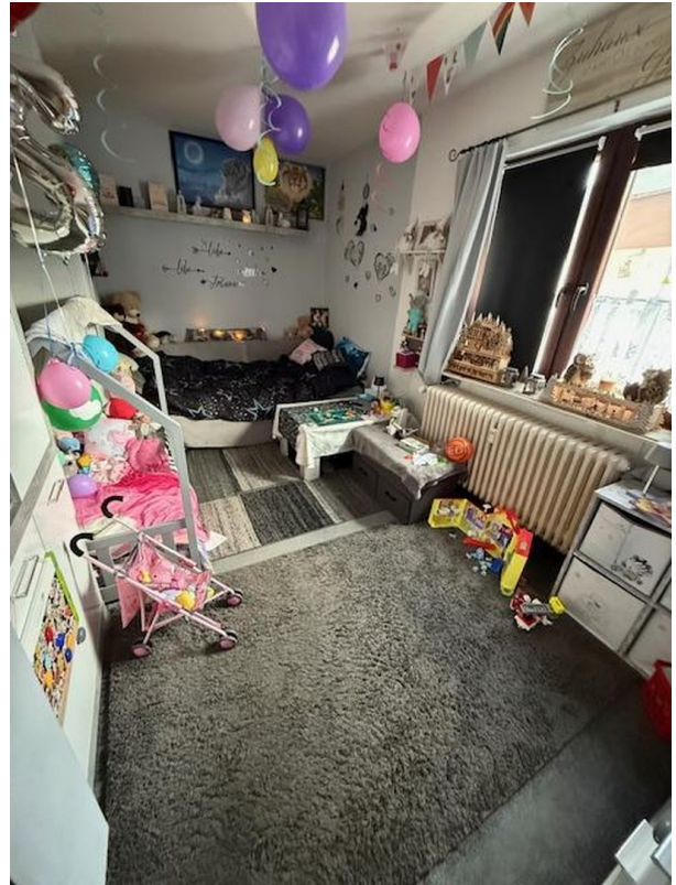
Wohnzimmer EG rechts