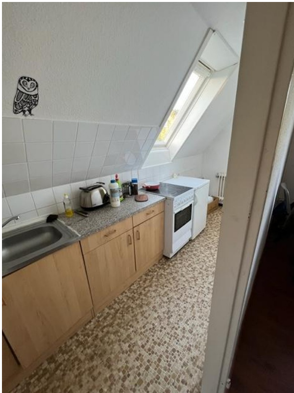
Küche OG rechts