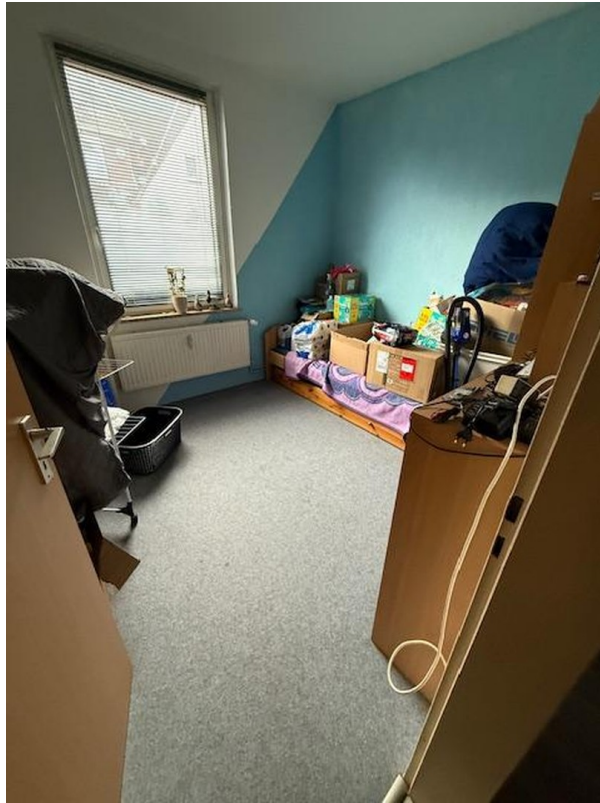
Kinderzimmer EG links