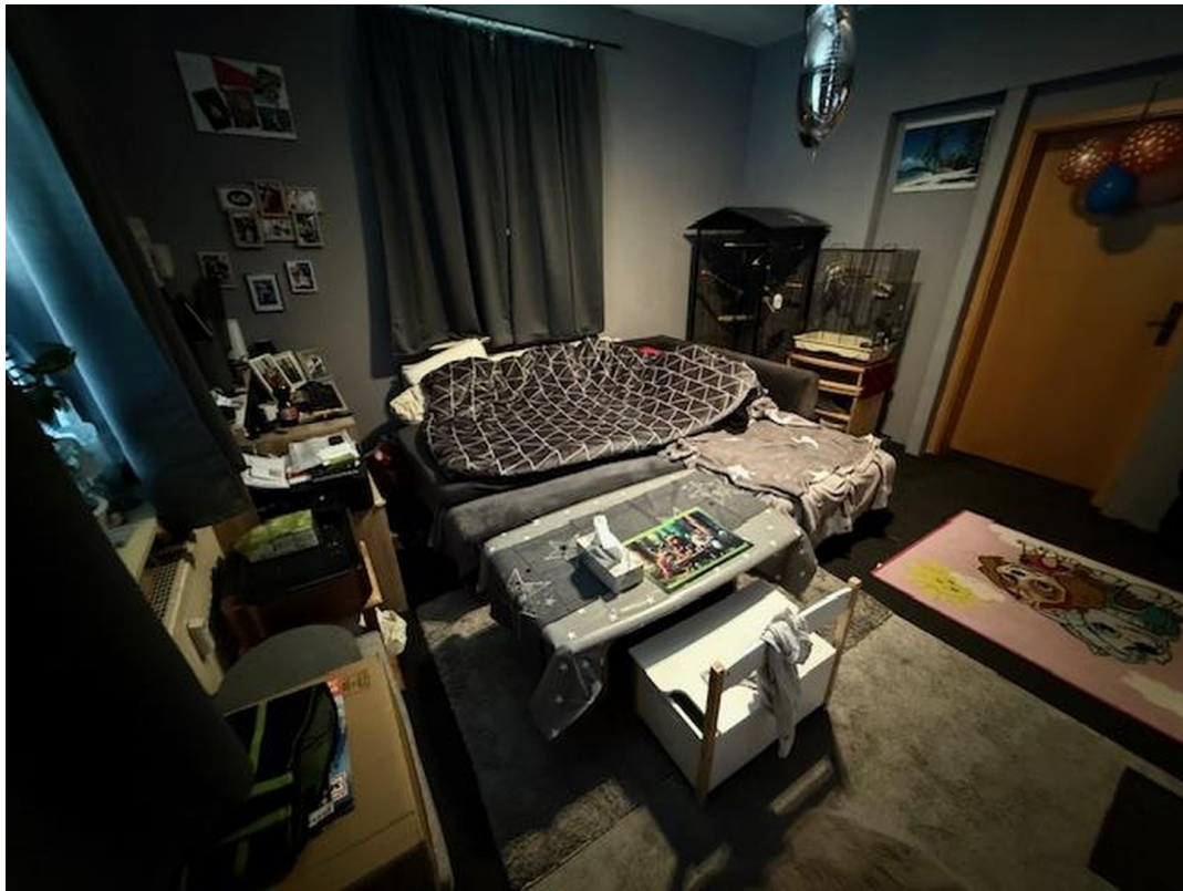
Wohnzimmer EG links