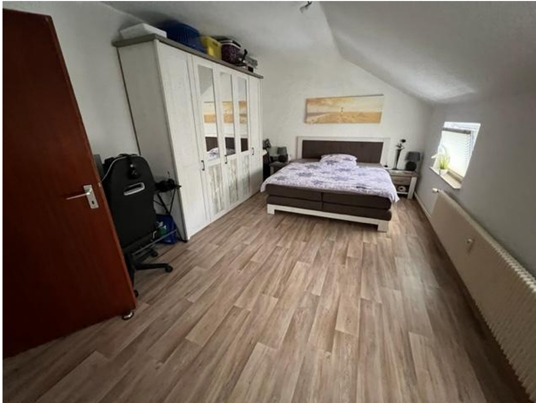
Schlafzimmer OG links