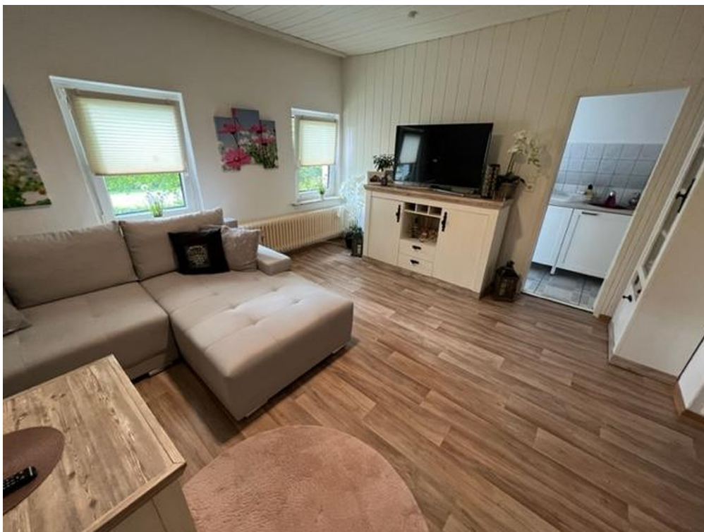
Wohnzimmer OG links