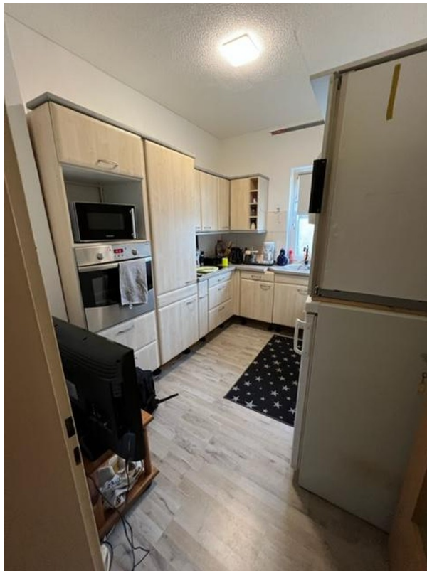
Küche EG links