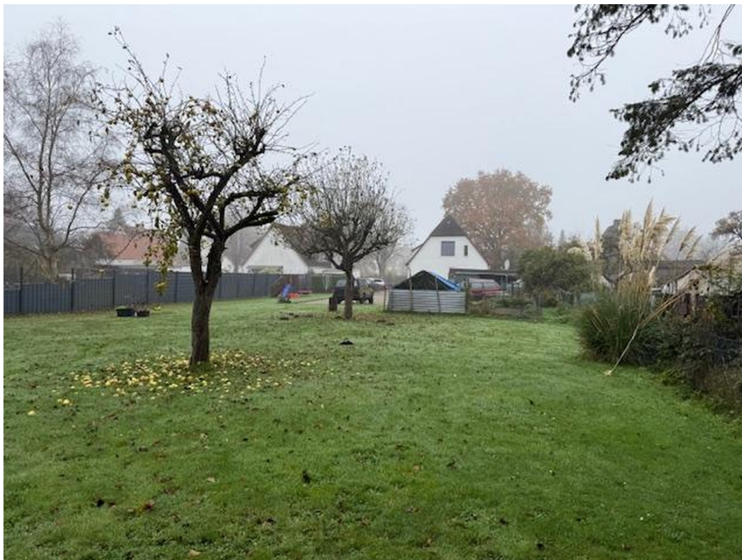
Blick von hinterer Grenze