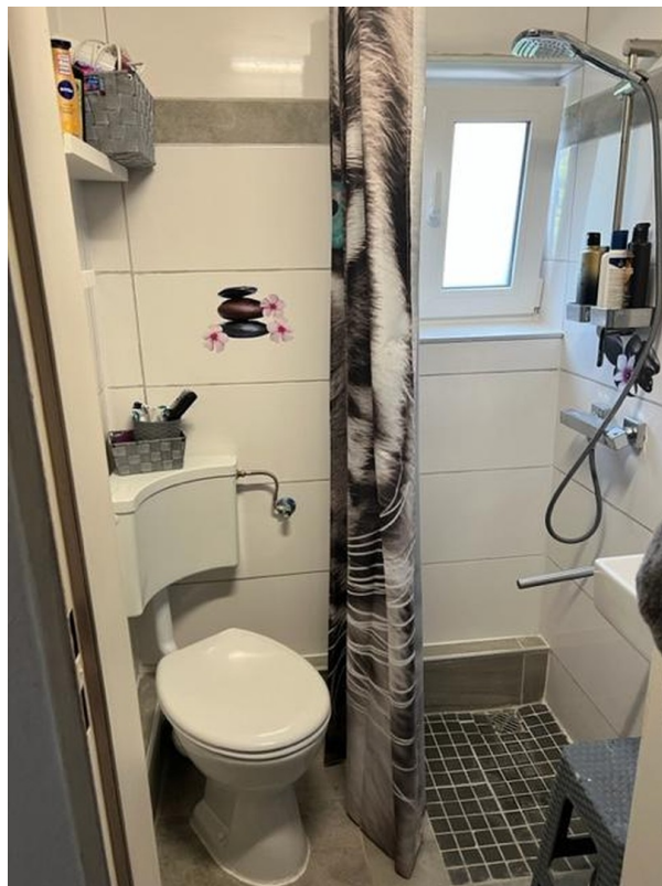
Duschbad EG rechts