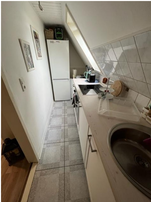
Küche OG links