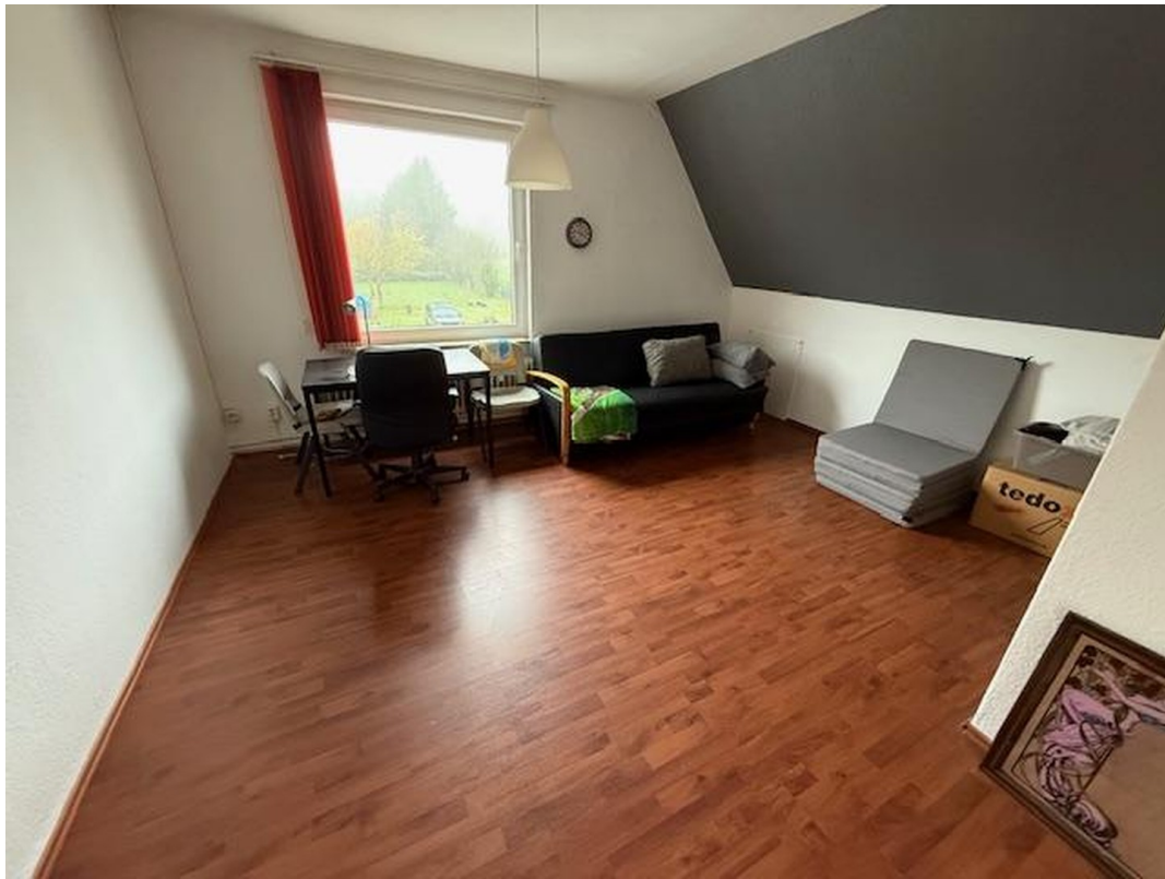
Wohnraum OG rechts