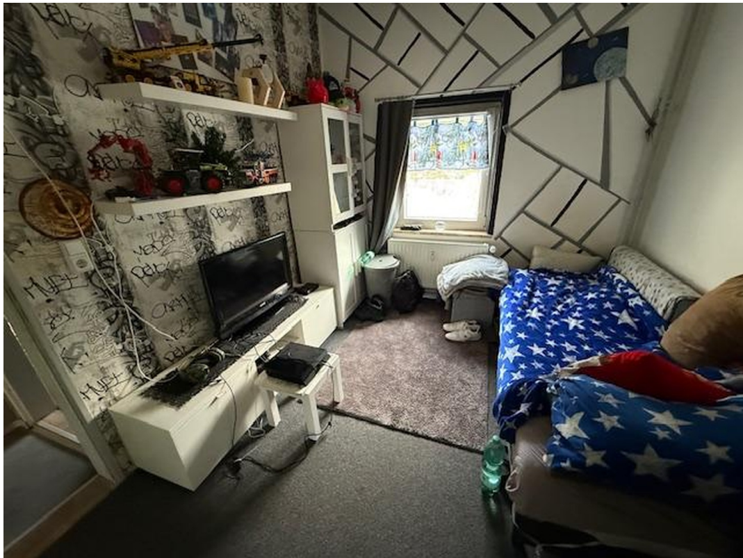
Kinderzimmer EG rechts