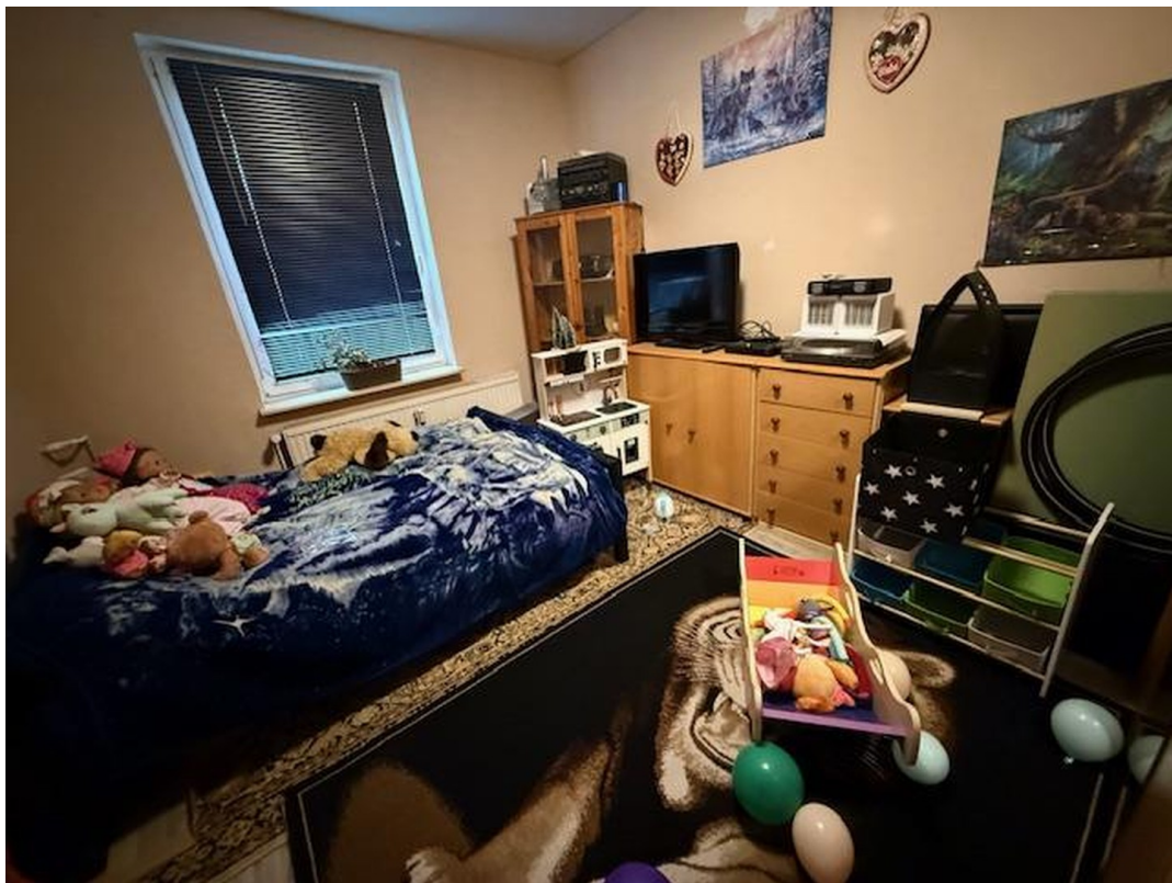
Schlafzimmer EG links