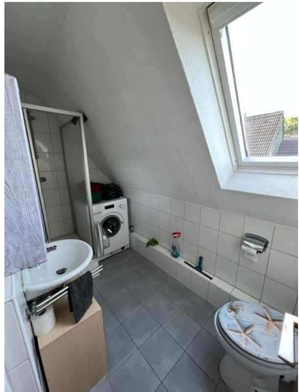
Duschbad OG rechts