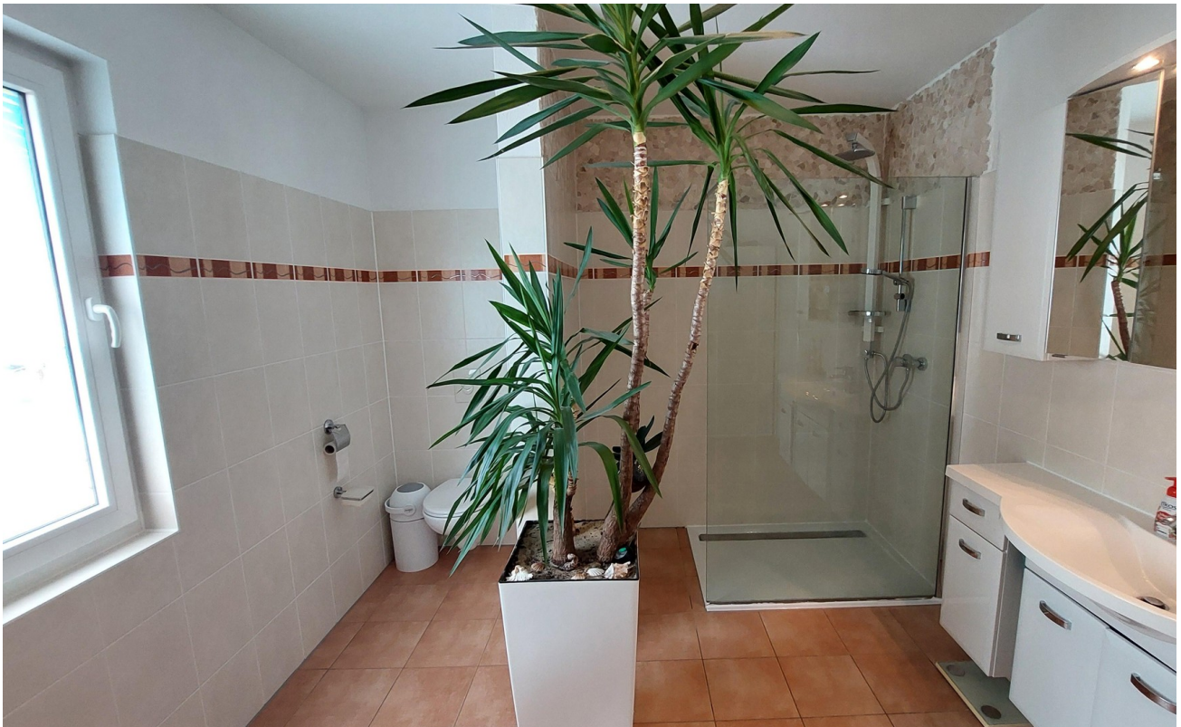
Dusche und WC