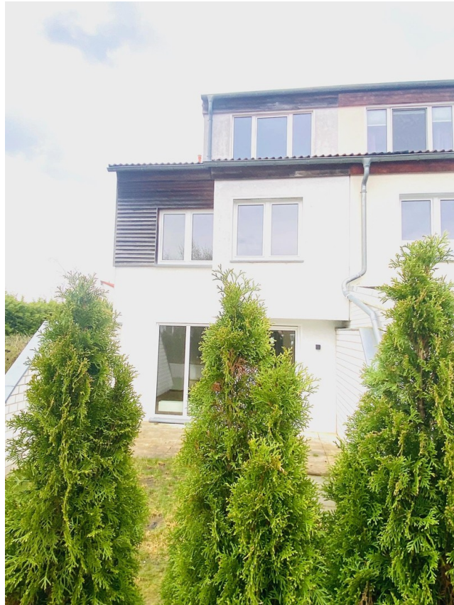
Blick von der Straße