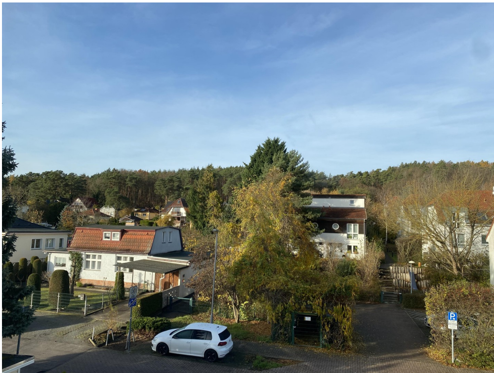
Blick aus Studio