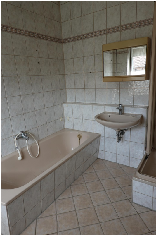
Bad EG (1)