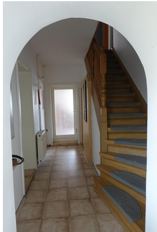
Flur und Treppe