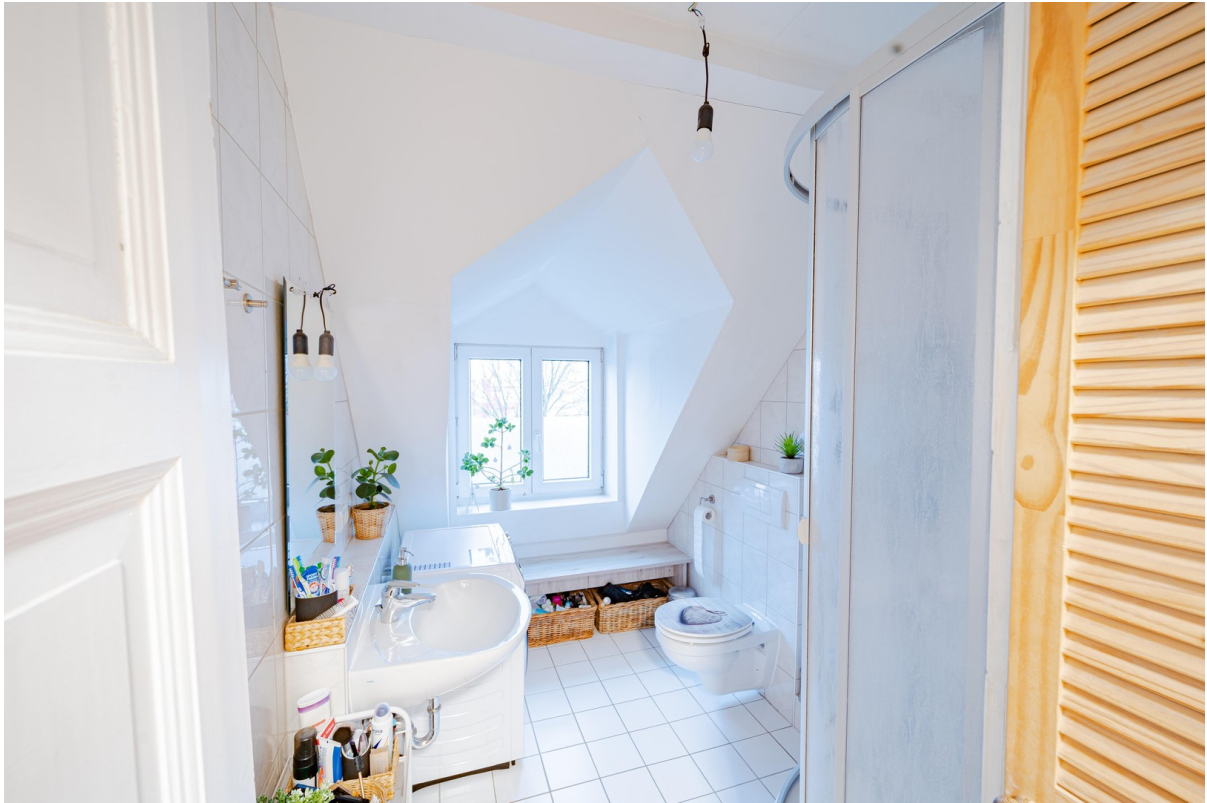
Duschbad - 1