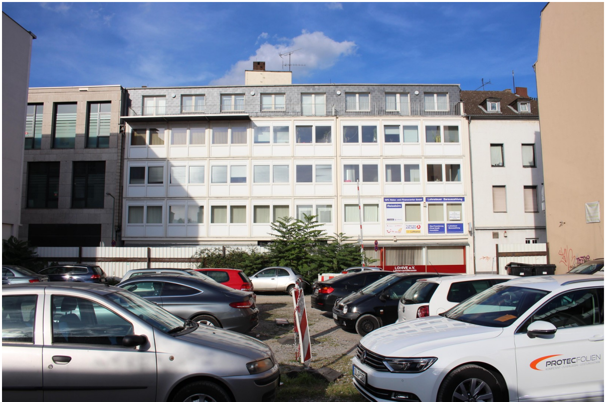
Parkplatz vor dem Haus