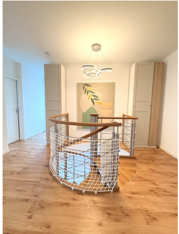
Flur im Obergeschoss