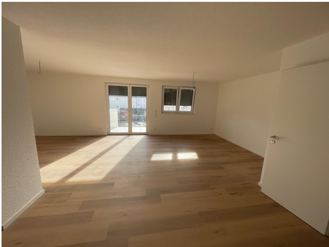
Wohn- und Esszimmer