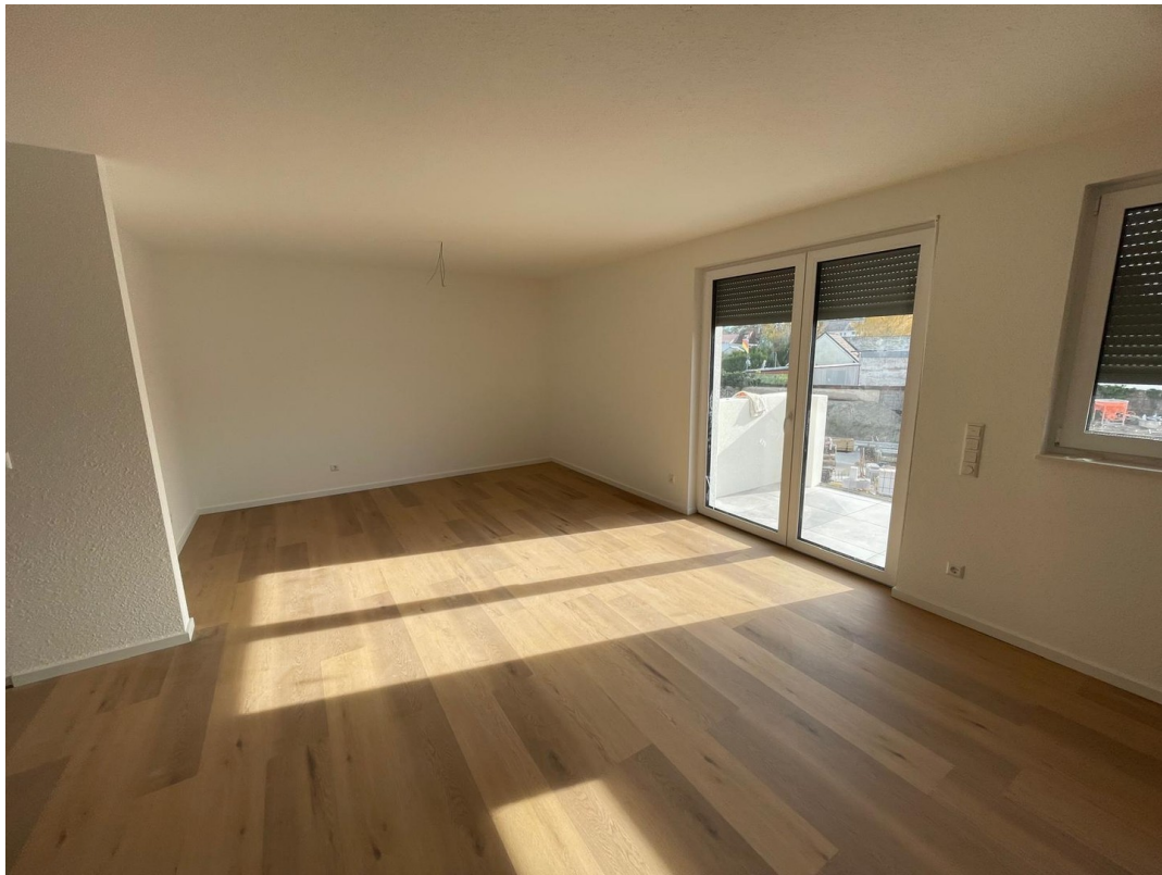
Wohn- und Esszimmer