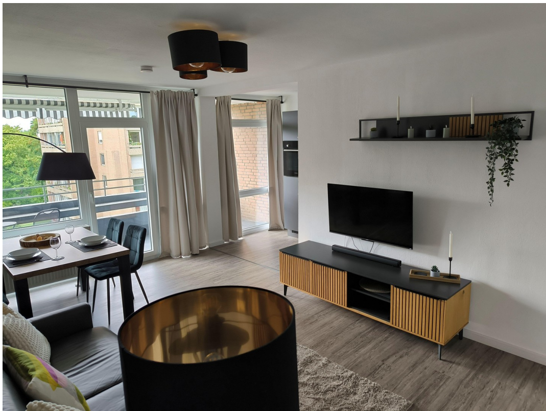
Blick von der Schlafnische