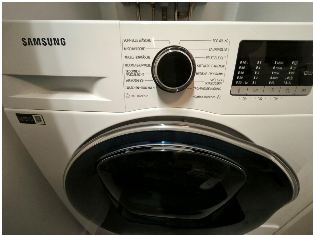
Samsung - Waschtrockner