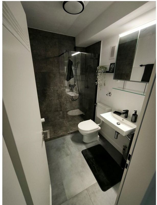
Blick ins Bad