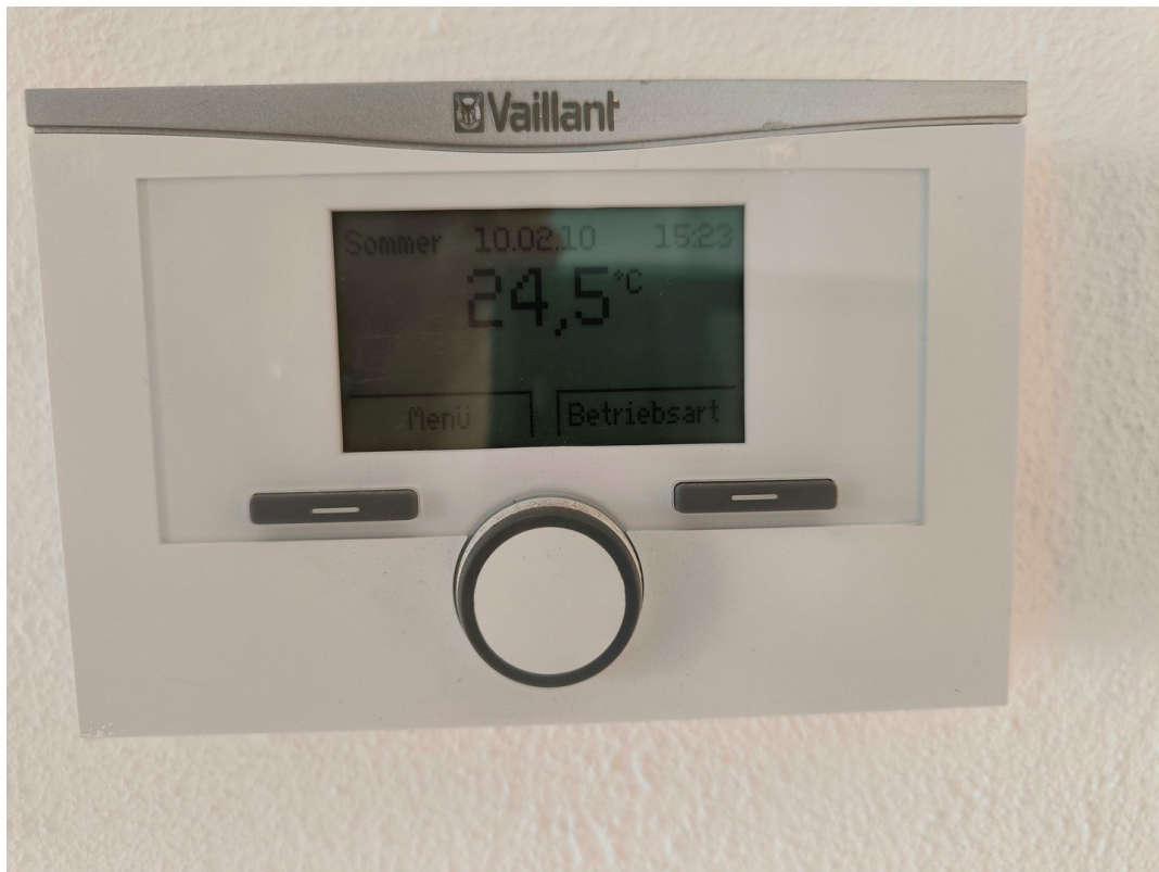
Heizung - Detail - Vaillant