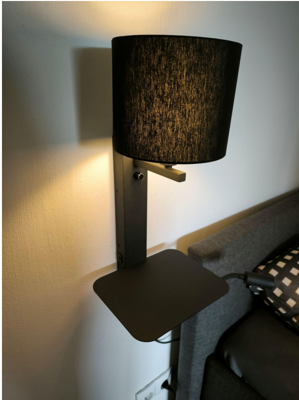
Nachtlampe mit USB