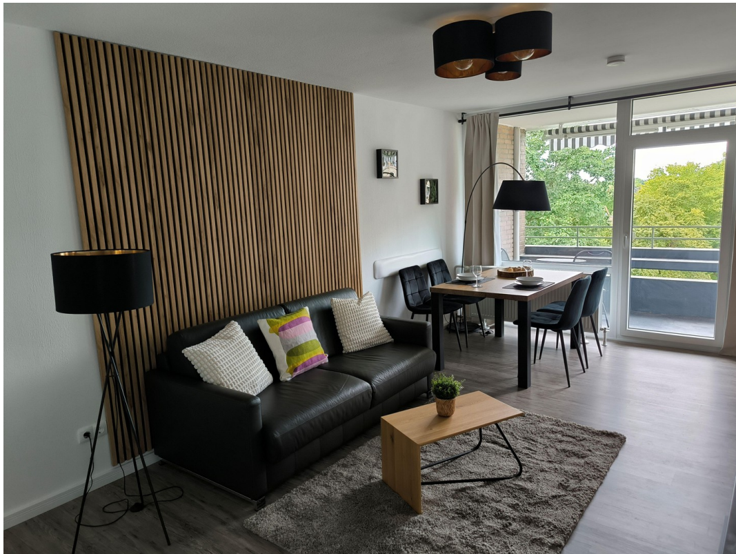
Blick ins Apartment