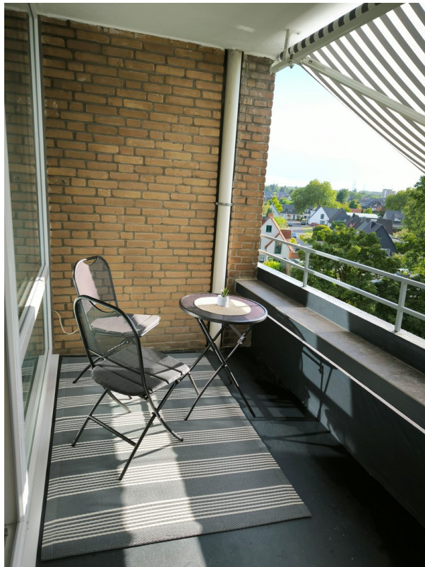
Balkon mit Markise