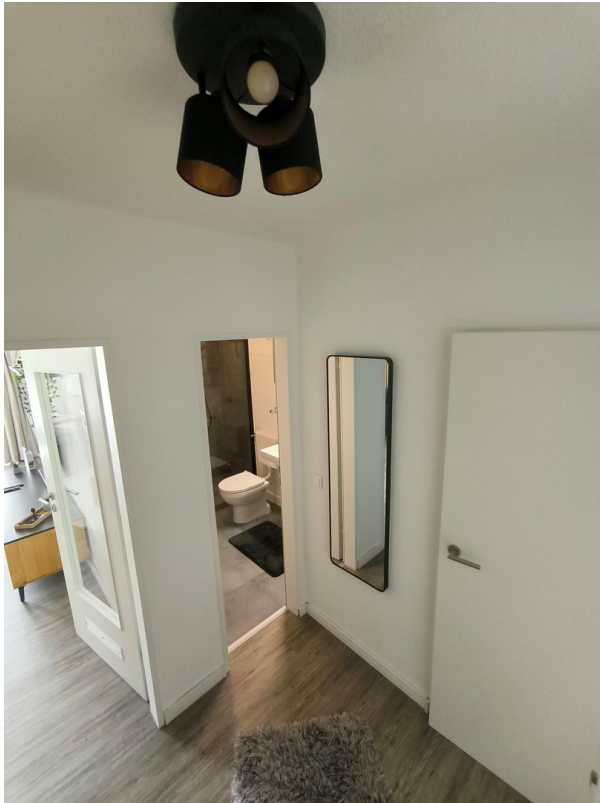
Flur - Blick in das Bad