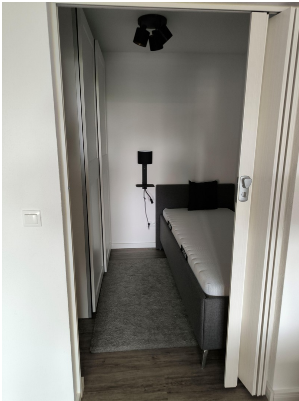
Schlafbereich / Kleiderschrank