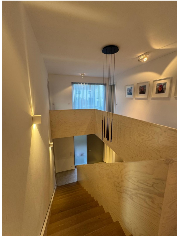
OG mit Luftraum