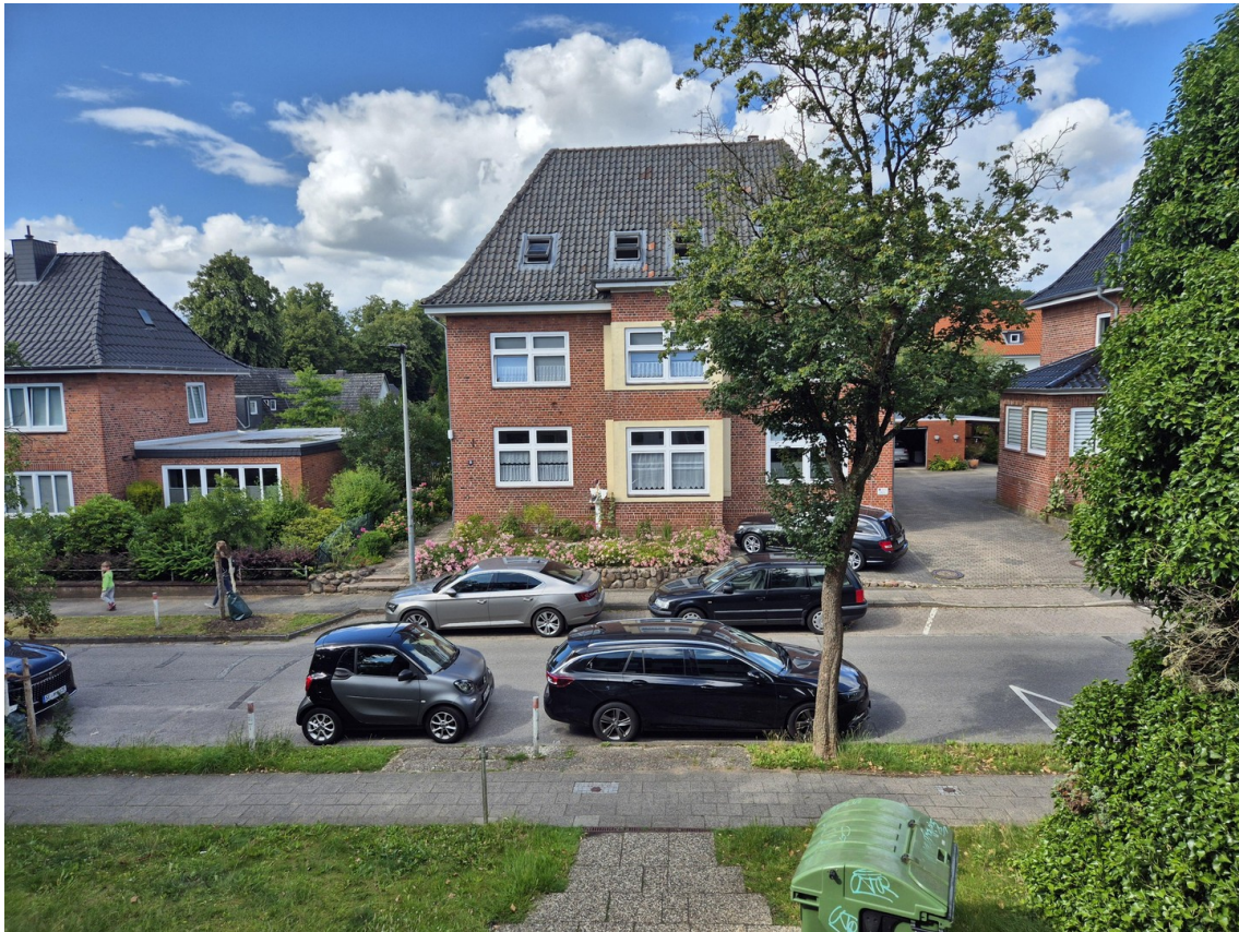
Blick aus dem Fenster