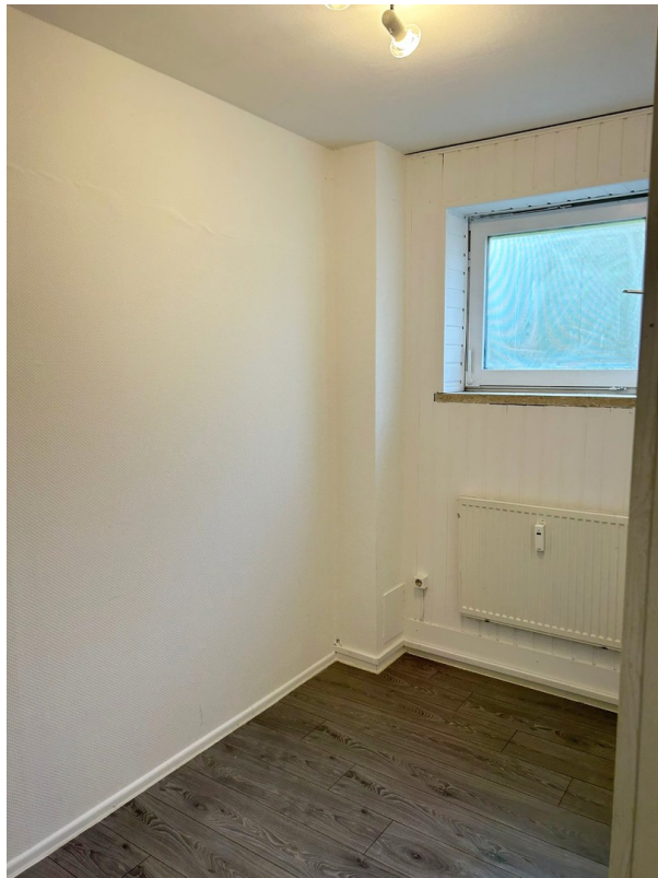
Nebenraum Groß Ansicht 1