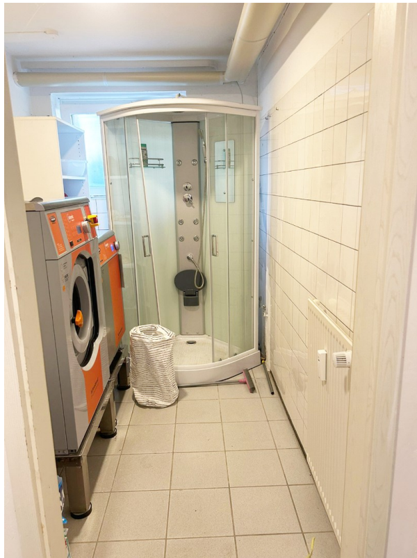
Raum links mit Dusche