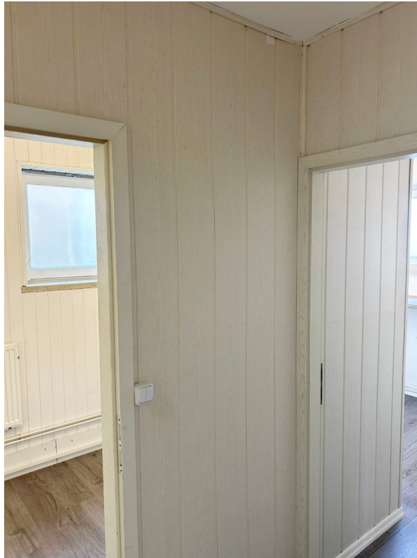
Nebenraum Groß Ansicht 2