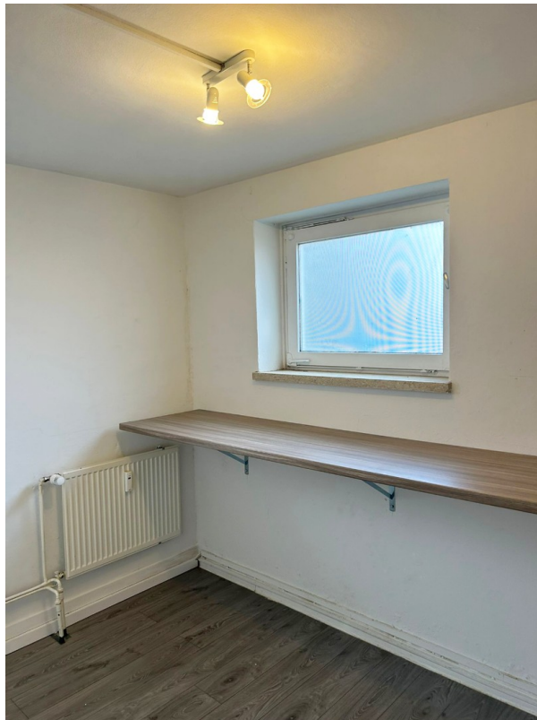
Nebenraum Groß Ansicht 3