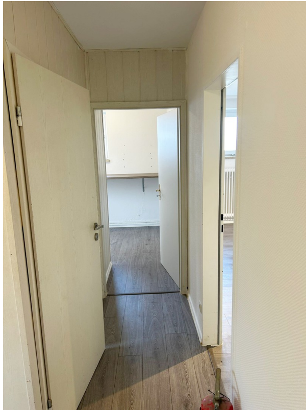
Nebenraum Groß Ansicht 4