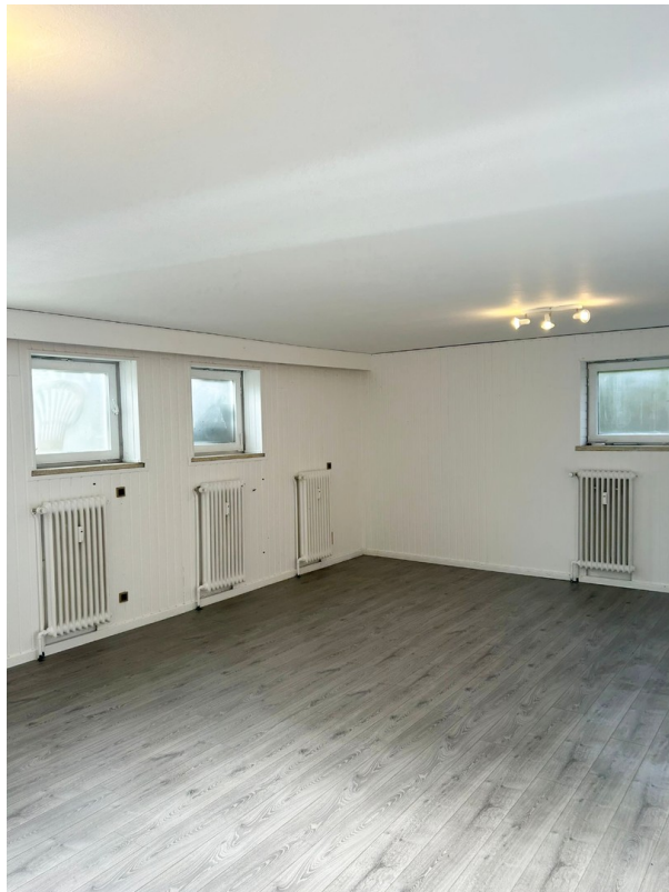
Hauptraum Ansicht 2