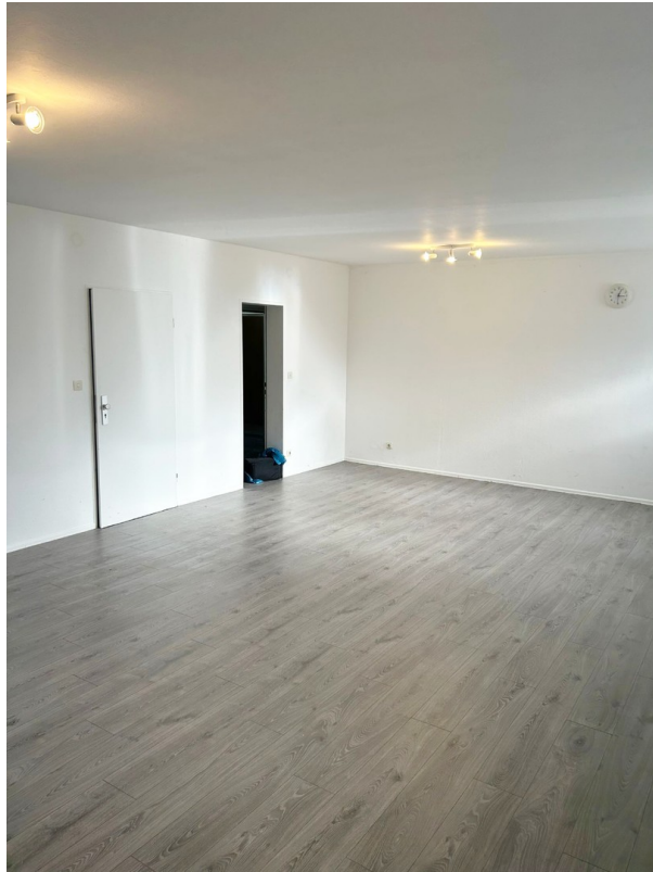
Hauptraum Ansicht 1