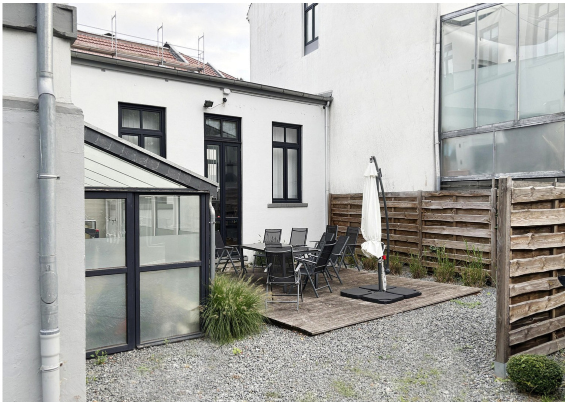
ggf. Garten Nutzung möglich