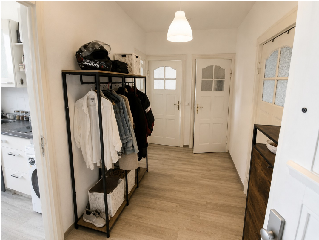
Eingangsbereich und Flur