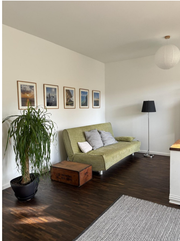
Arbeitszimmer / 2. Wohnzimmer