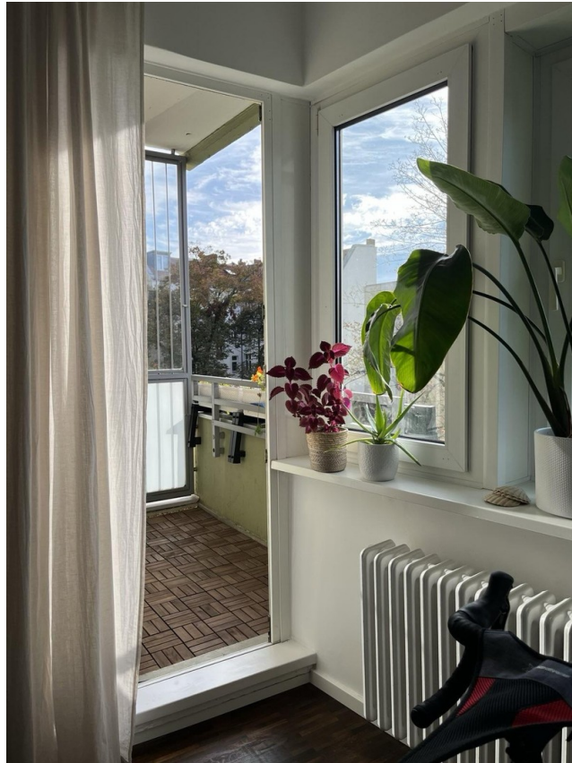
Balkon (einer von zwei)