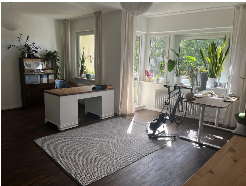
Arbeitszimmer / 2. Wohnzimmer