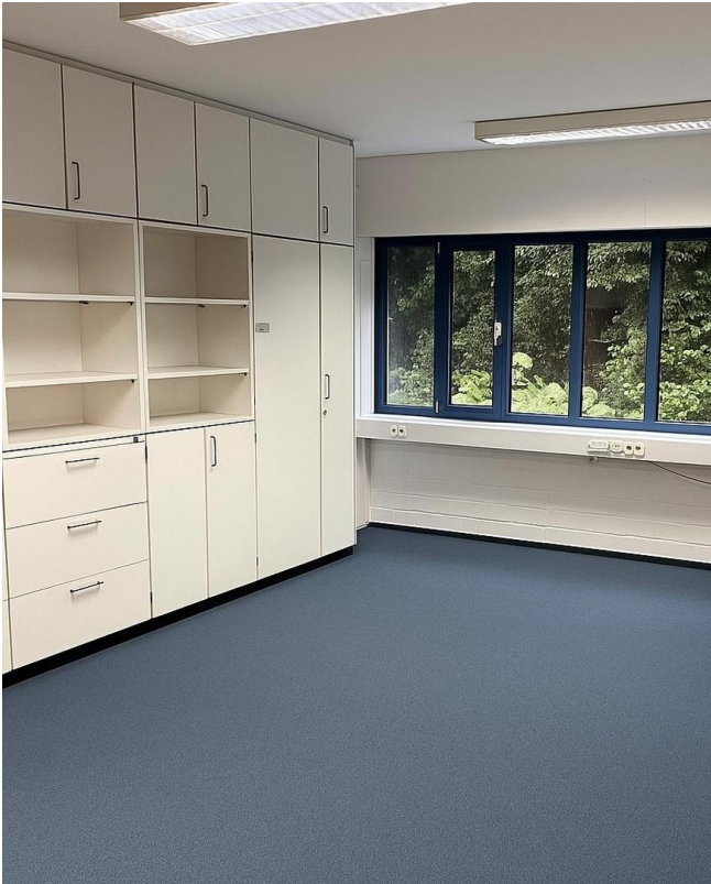
Büro mit Einbauschränk