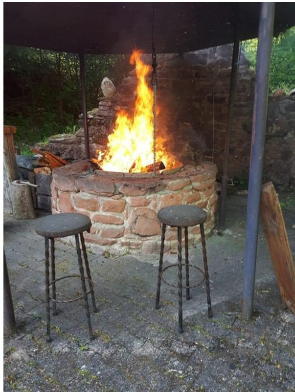
Grillplatz mit Feuerstelle