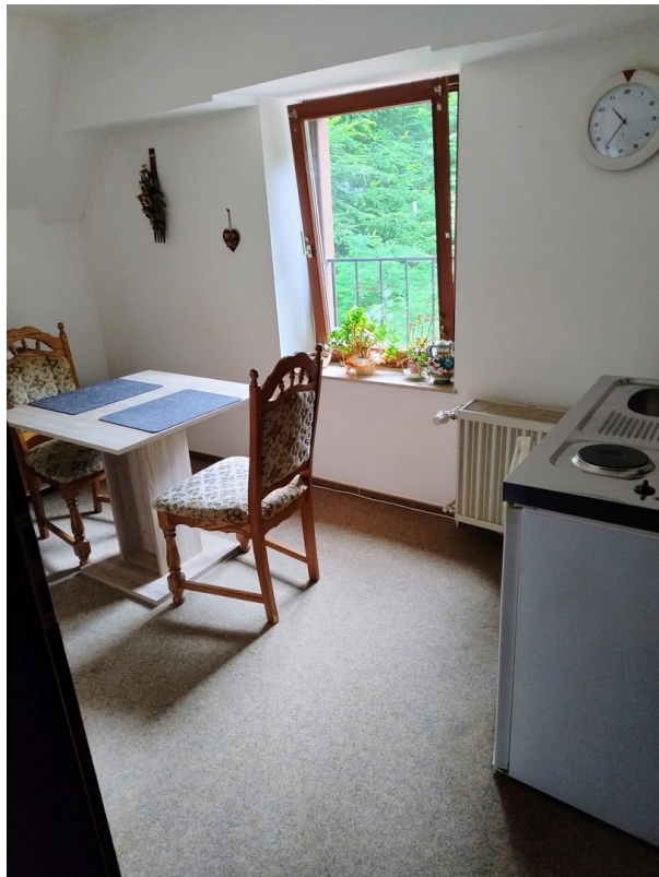
Wohnung im Dachgeschoss