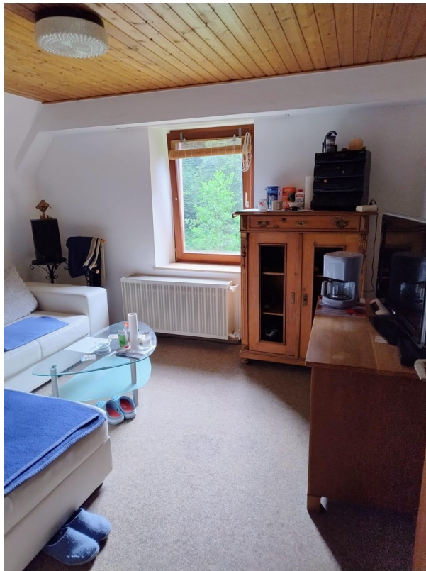
Wohnung im Dachgeschoss