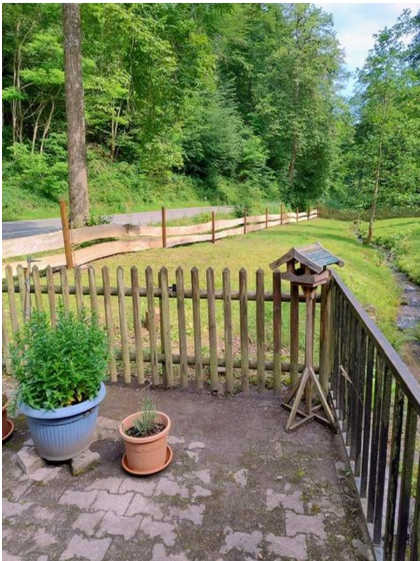
Grundstück entlang der Straße