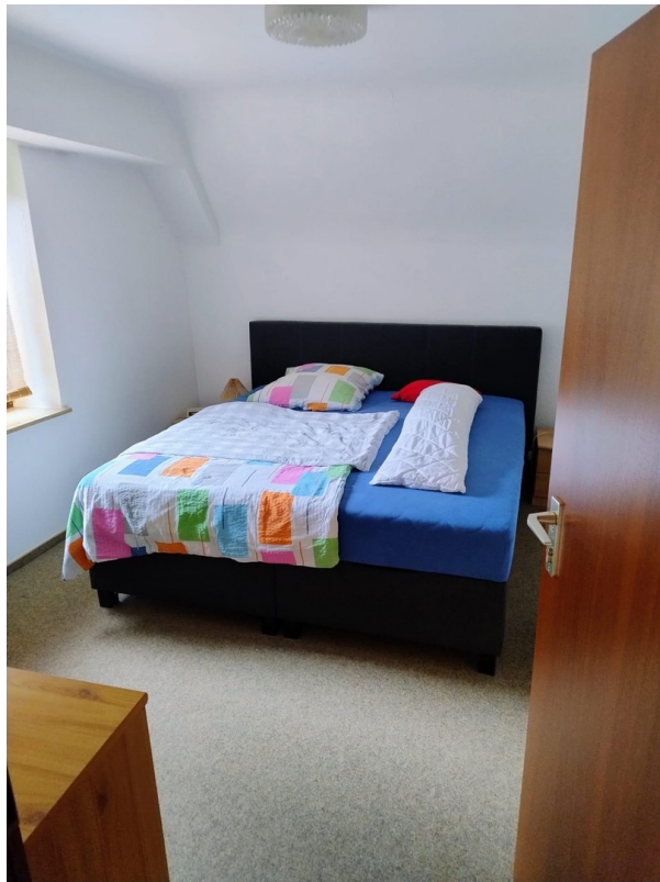
Wohnung im Dachgeschoss