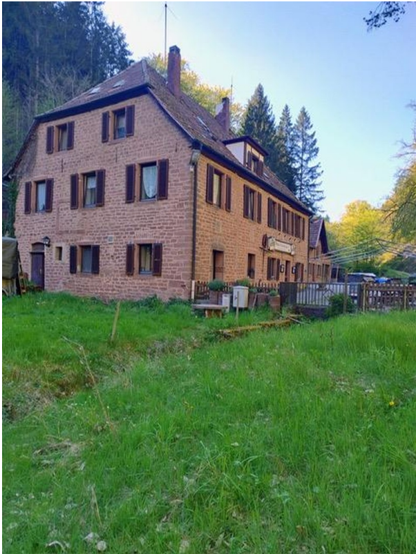
Blick vom Grundstück