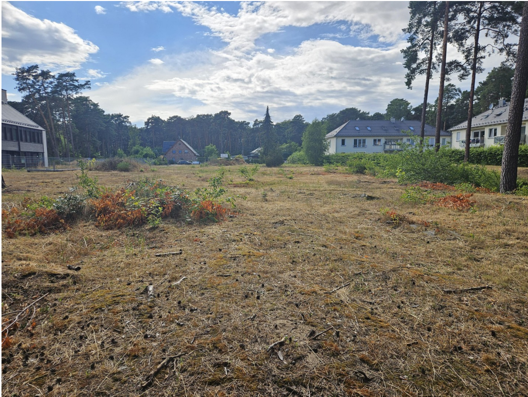
Baugrundstück - Flurstück 1