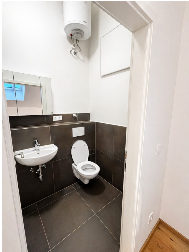
eignes Badezimmer mit Dusche