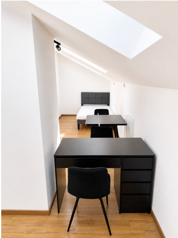
Wohn- und Schlafbereich 2