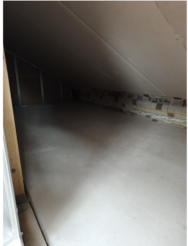
Abstellraum unter Dachschräge