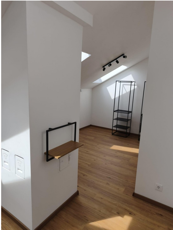
Wohn- und Schlafbereich 3