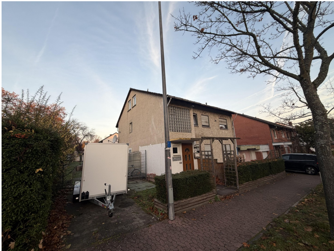
Seitenansicht von der Strasse