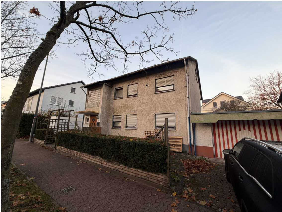
Strasseansicht mit Garage