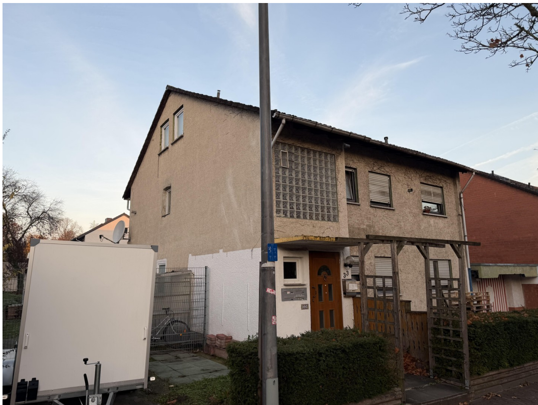
Seitenansicht von der Strasse