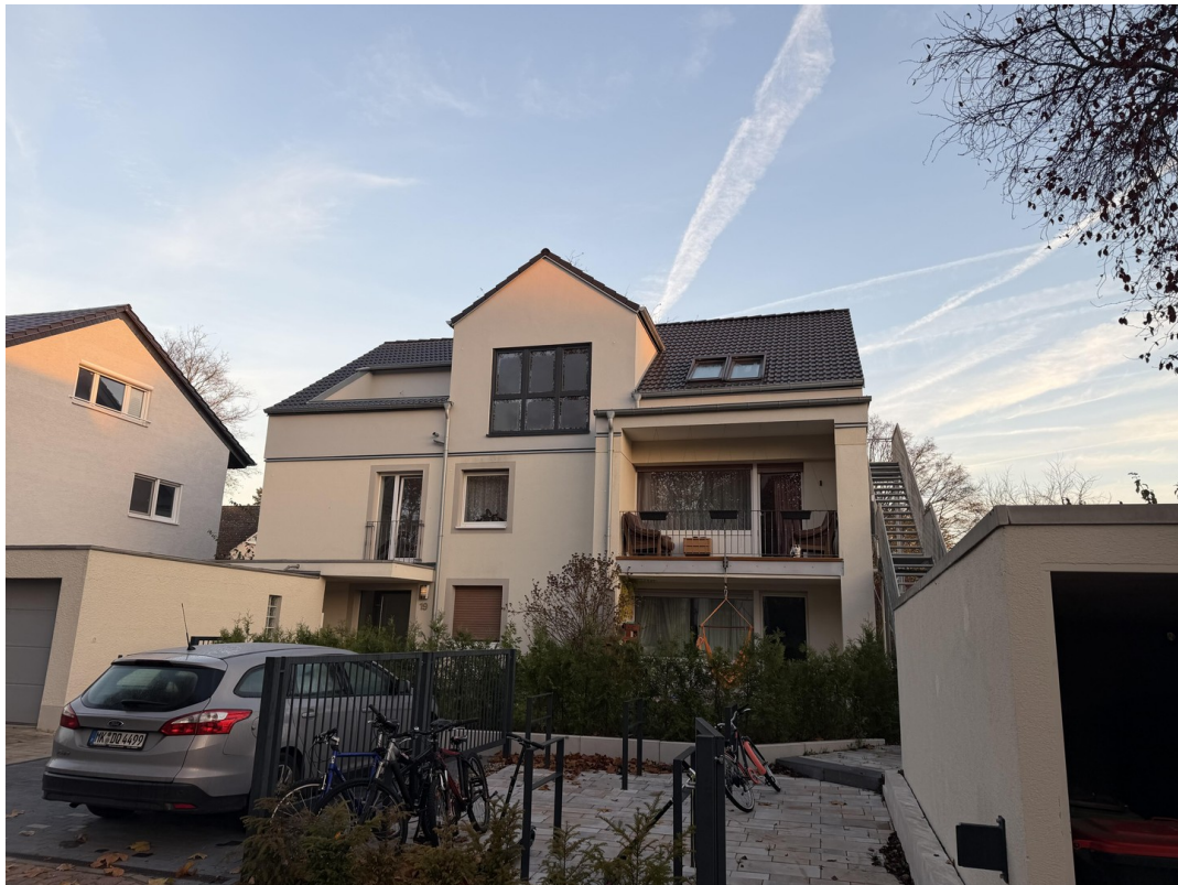
so könnte es Aussehen