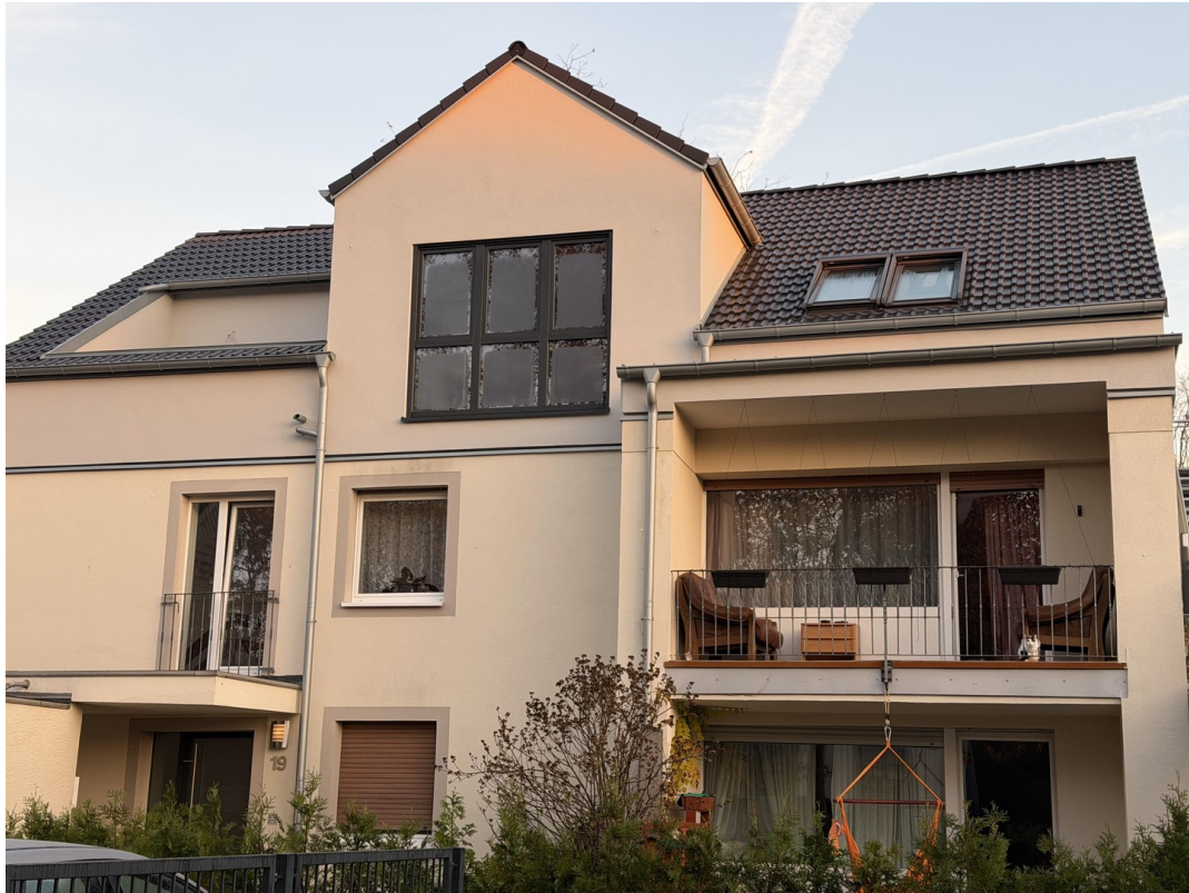
so könnte es Aussehen