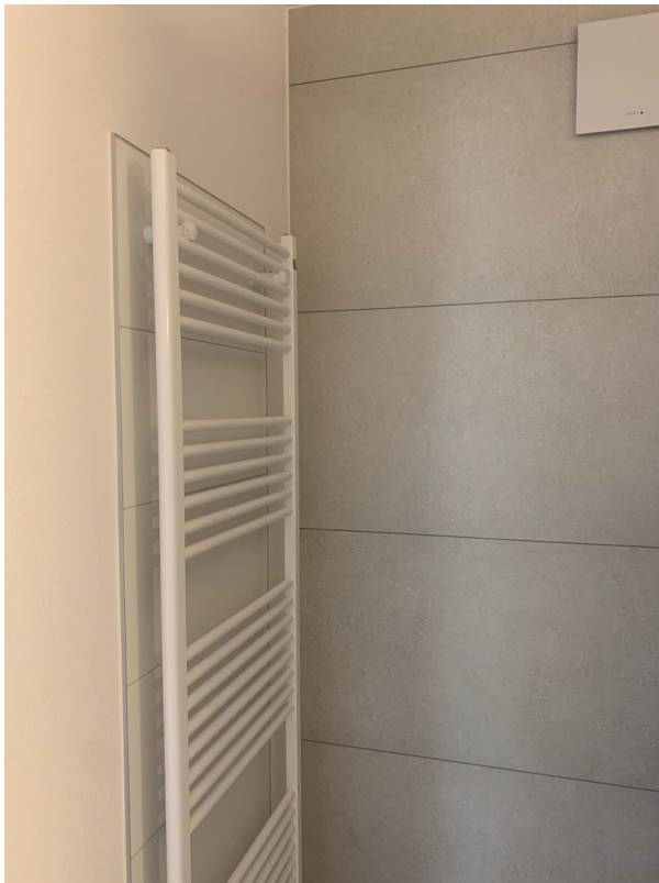
Bad mit Handtuchheizkörper