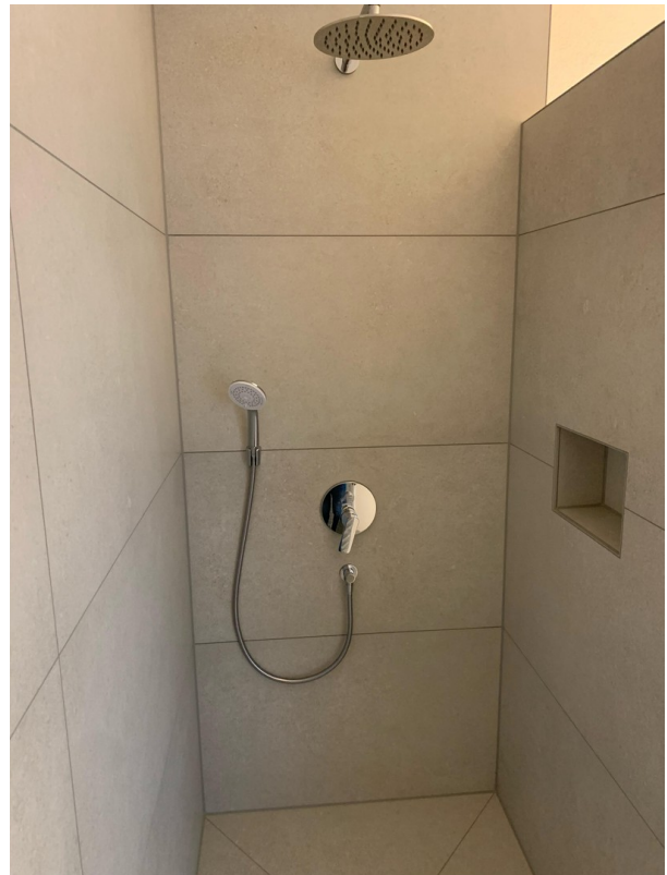
Bad mit Rainshowerdusche