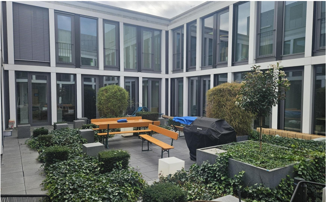
Innenhof mit Grill und Tischen