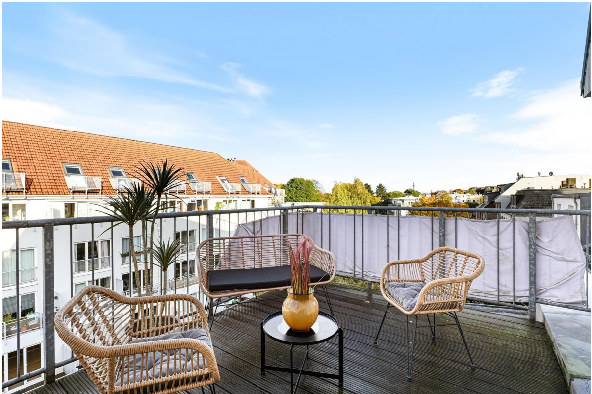
Eine der Dachterrassen