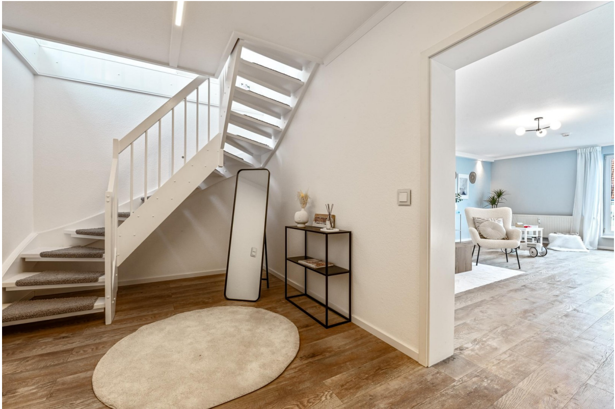
Eingang / Treppe