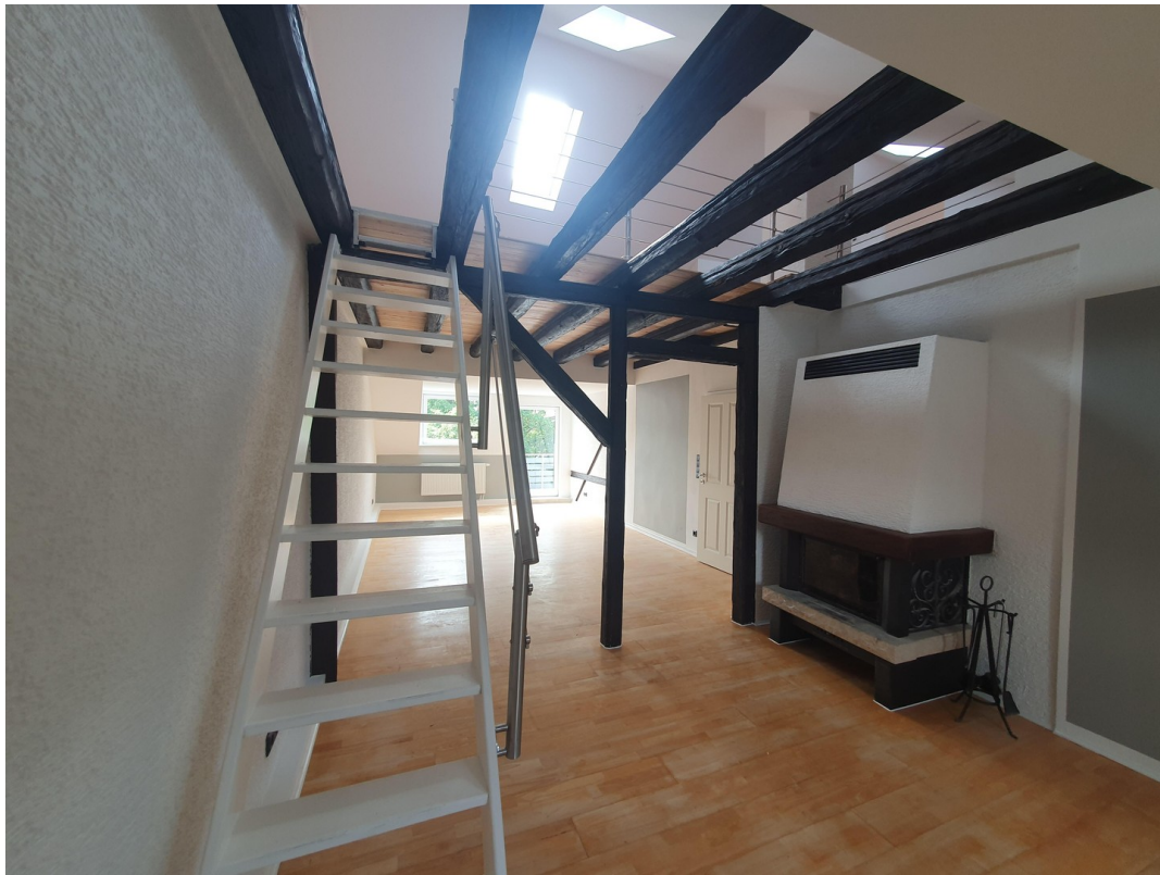
Aufgang zum Spitzboden