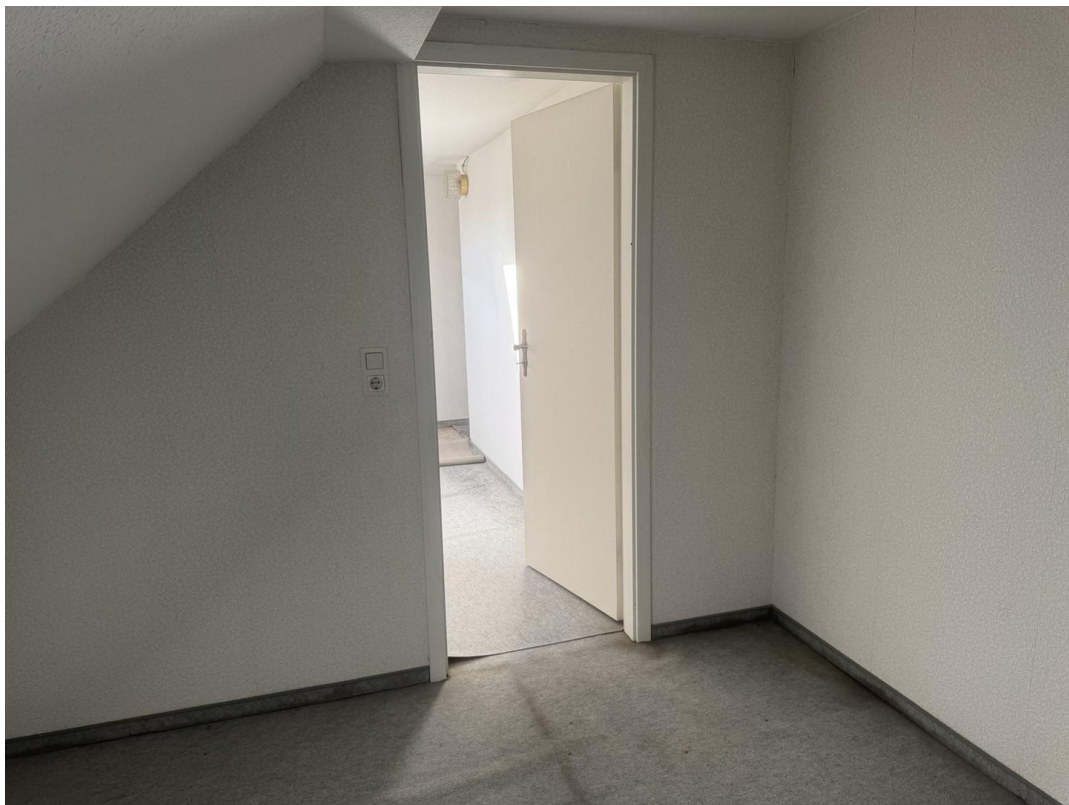
1. OG Schlafzimmer