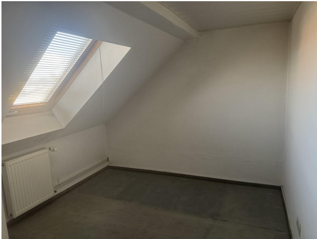
1. OG Vorraum