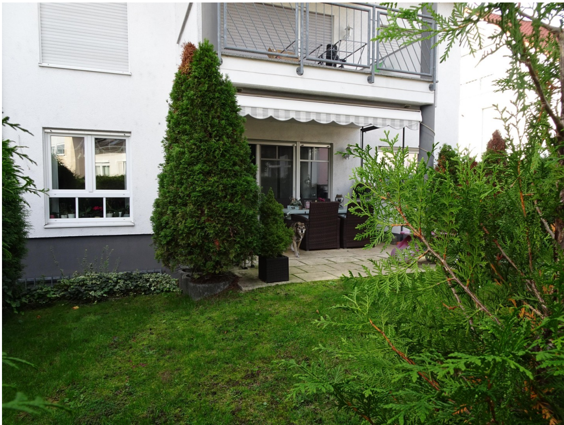
Garten z. alleinigen Nutzung