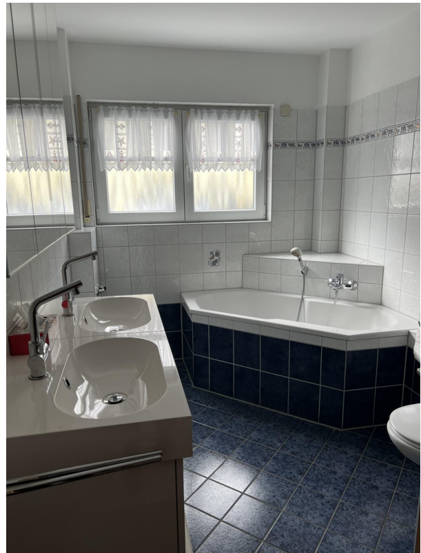
Bad mit Eckbadewanne