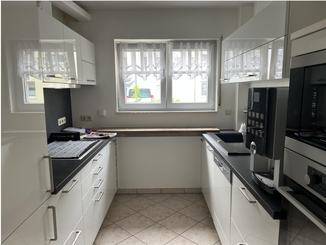
Küche mit hochwertiger EBK