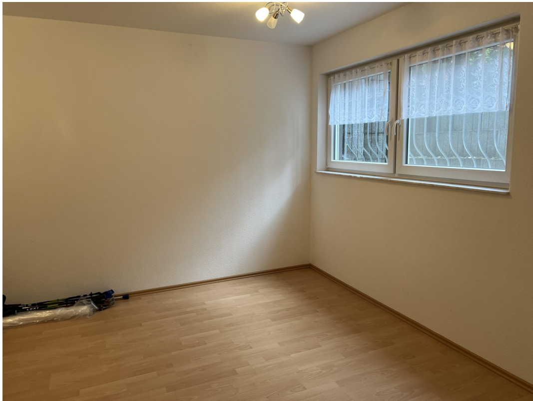
Weiteres Zimmer, Souterrain