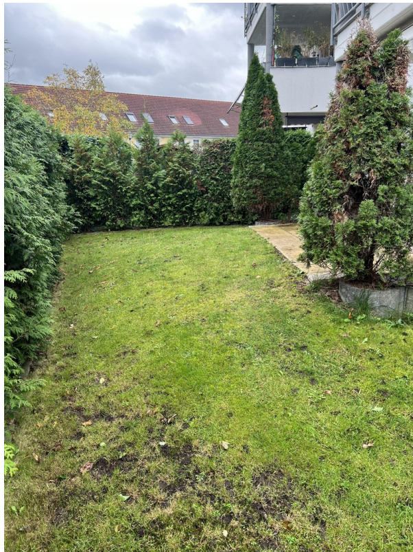
Groß genug zum Spielen