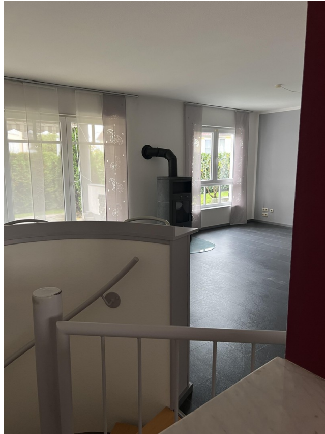
Großes Wohnzi. mit Kamin