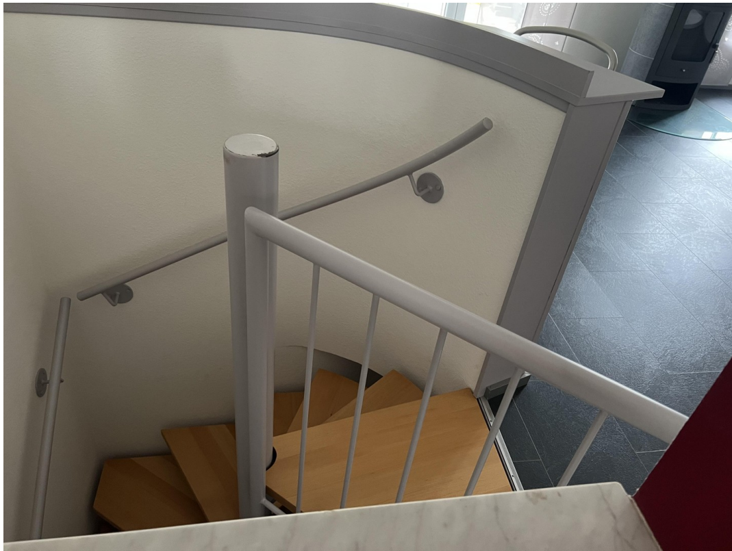
Treppe ins Souterrain