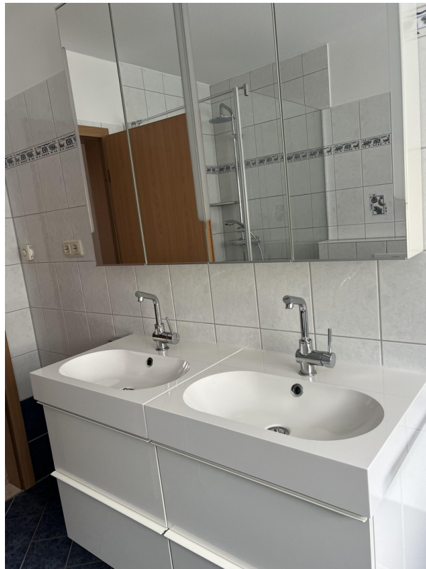
Hochwertige Badmöbel inkl.