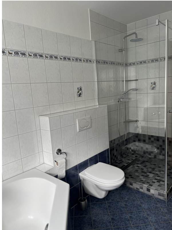
...und große Glasdusche