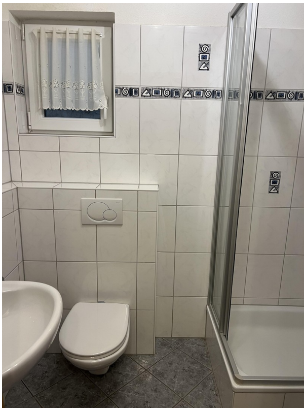
Duschbad im Souterrain