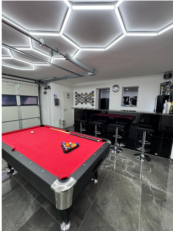
Garage/ Showroom EG