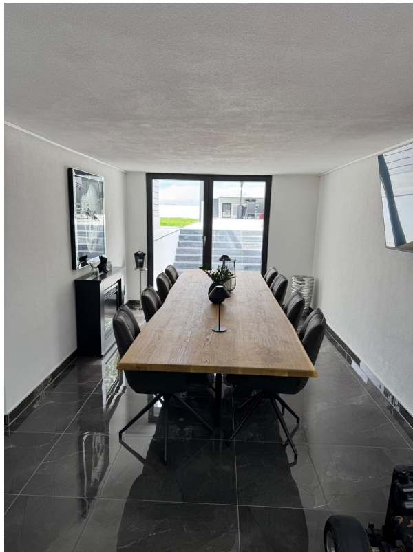
Garage/ Showroom EG