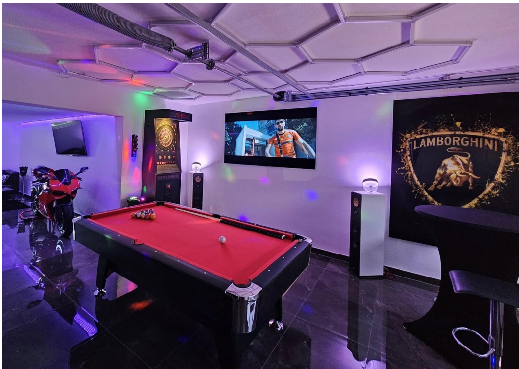
Garage/ Showroom EG