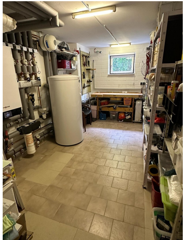
Heiz- und Werkbereich