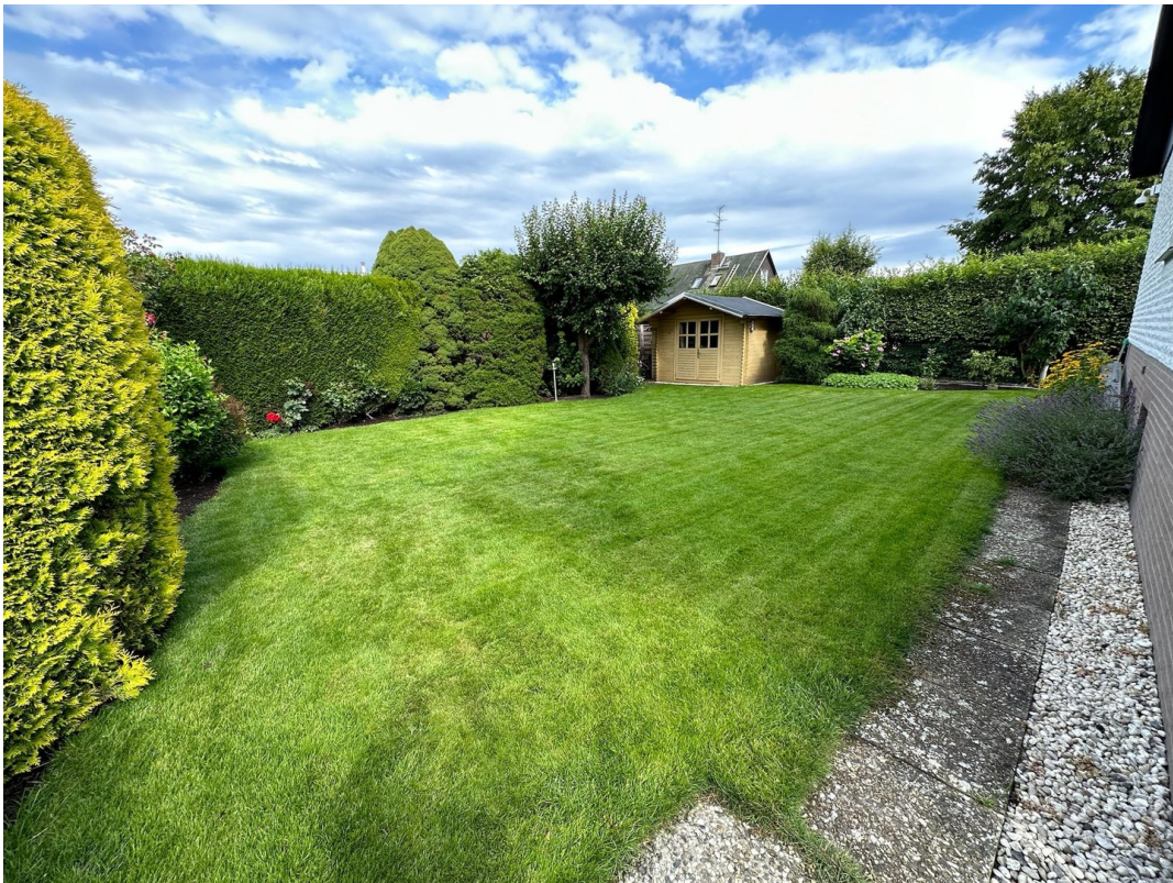
Garten mit Gartenhaus