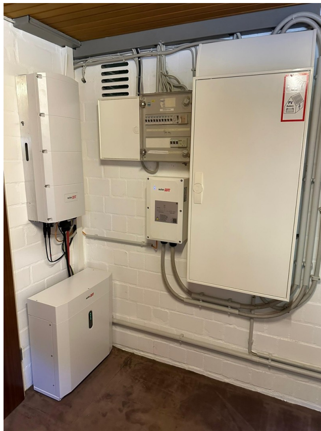
Wechselrichter und Backup PV