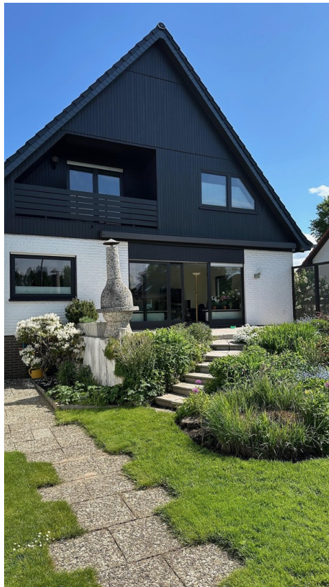
Aufgang zur Terrasse