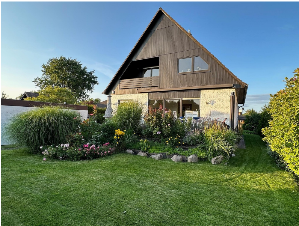
Hausansicht mit Vorgarten