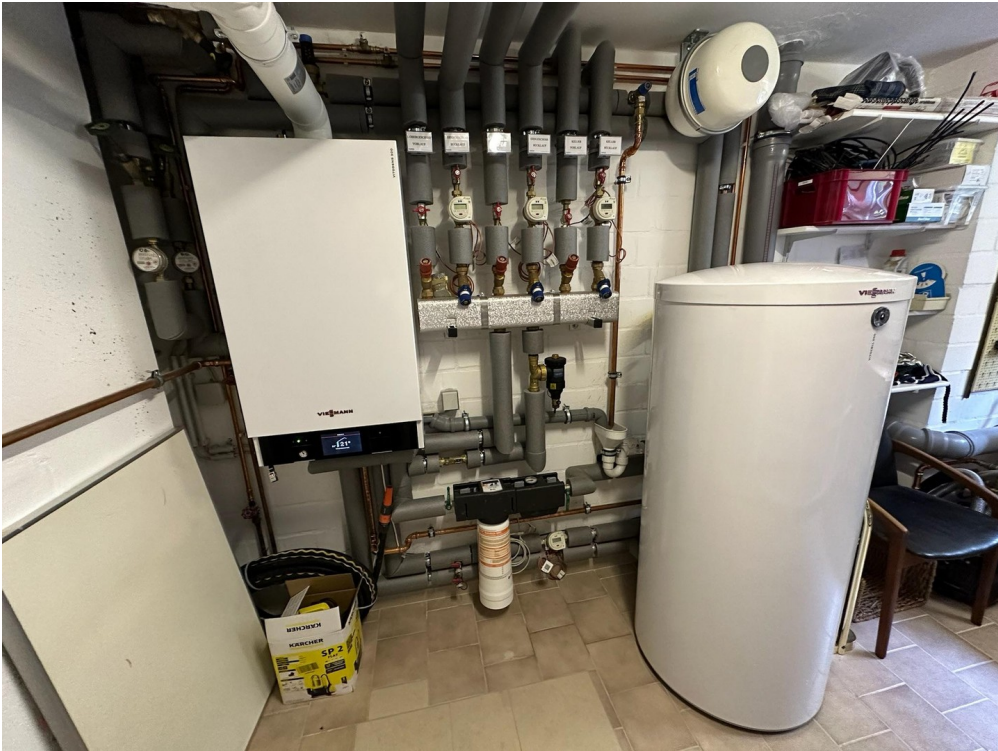
Viessmann - Heizung