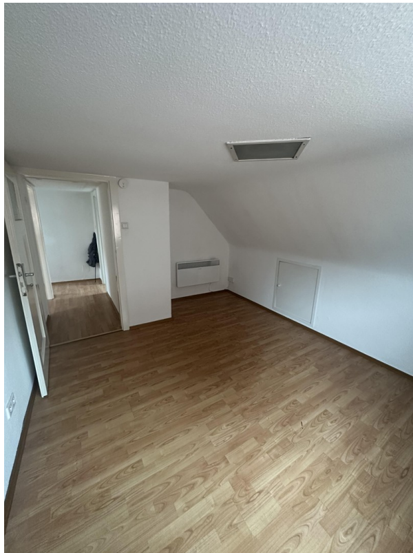
2. OG 1. Schlafzimmer