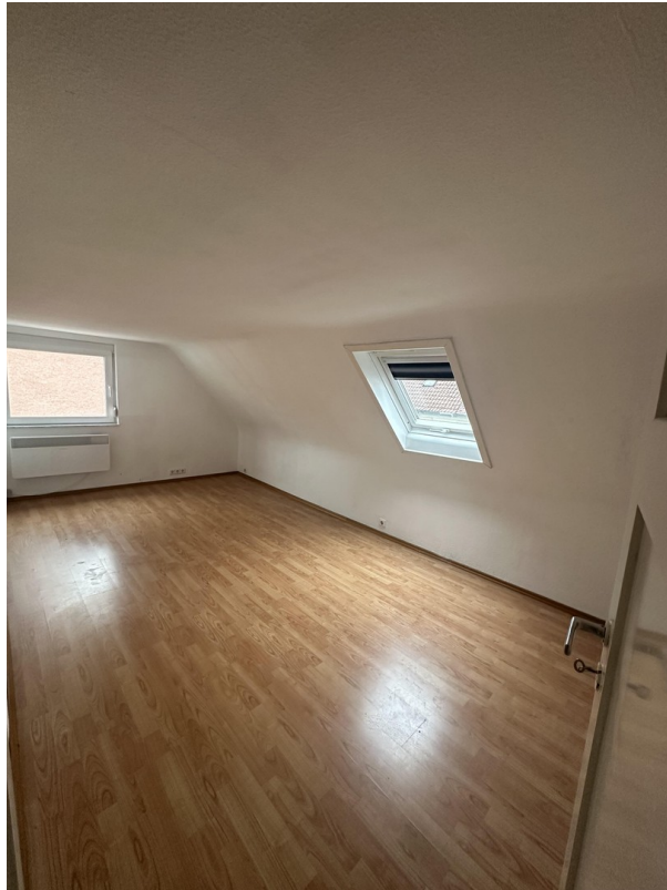
2. OG 2. Schlafzimmer