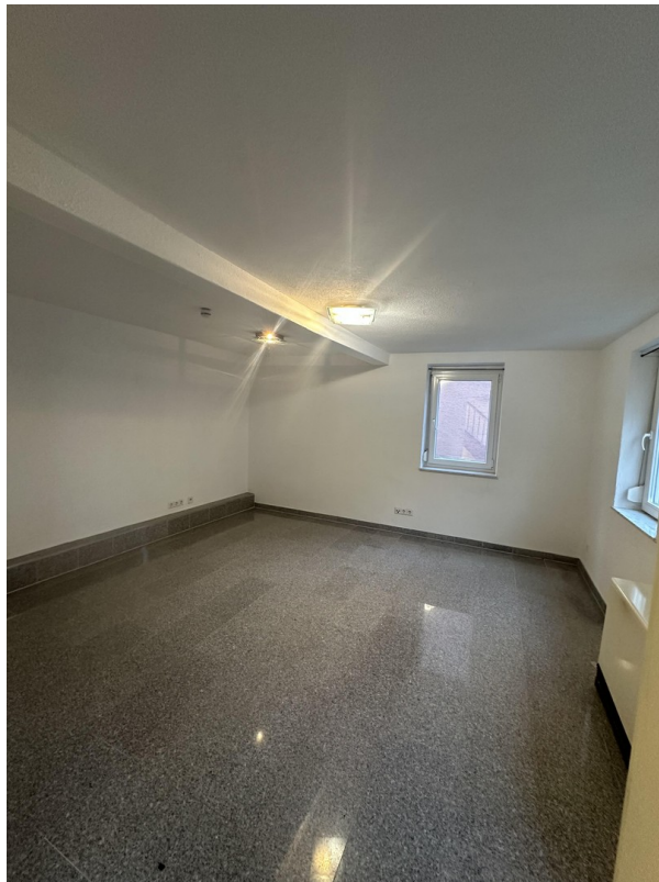
EG Büro/ Schlafzimmer