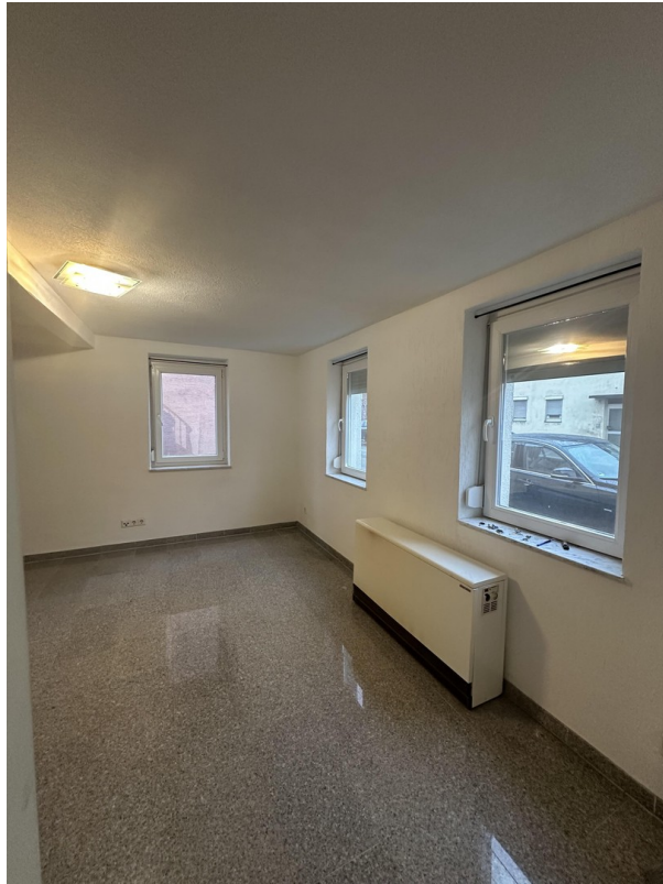
EG Büro/ Schlafzimmer