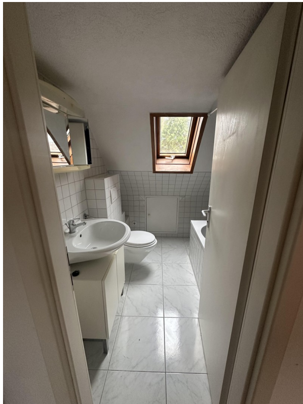
2. OG Badezimmer