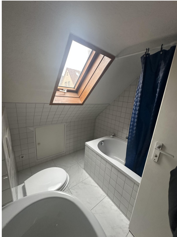
2. OG Badezimmer