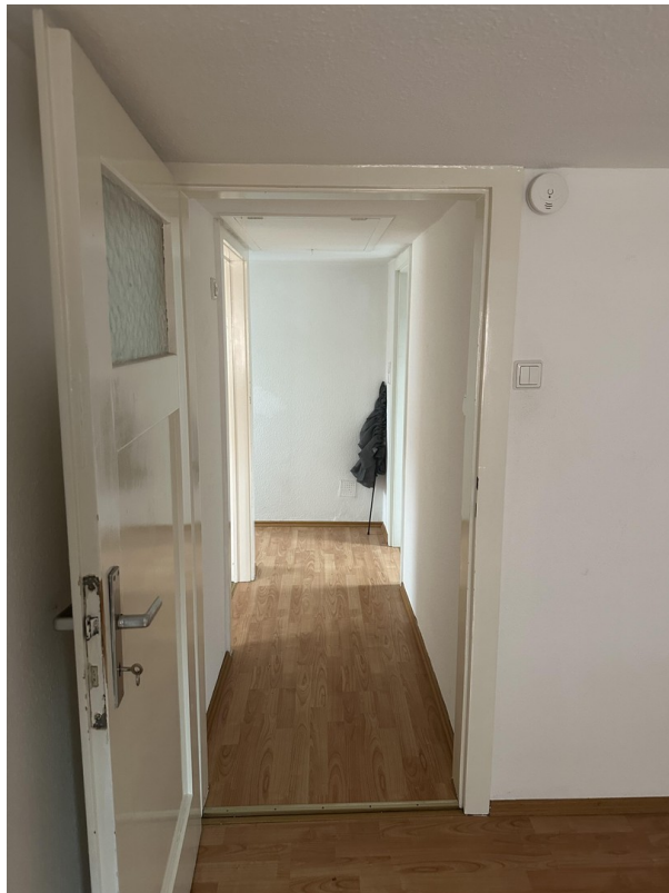
2. OG Flur