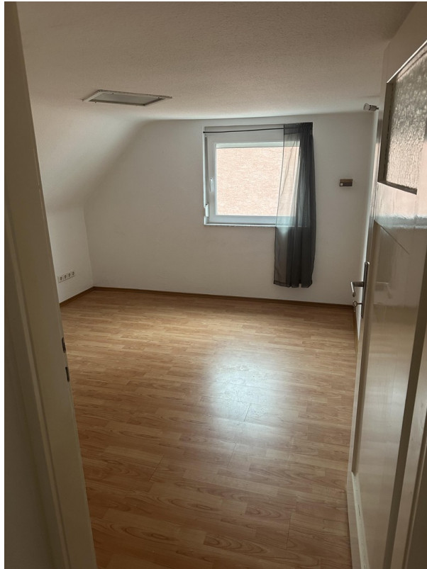
2. OG 1. Schlafzimmer