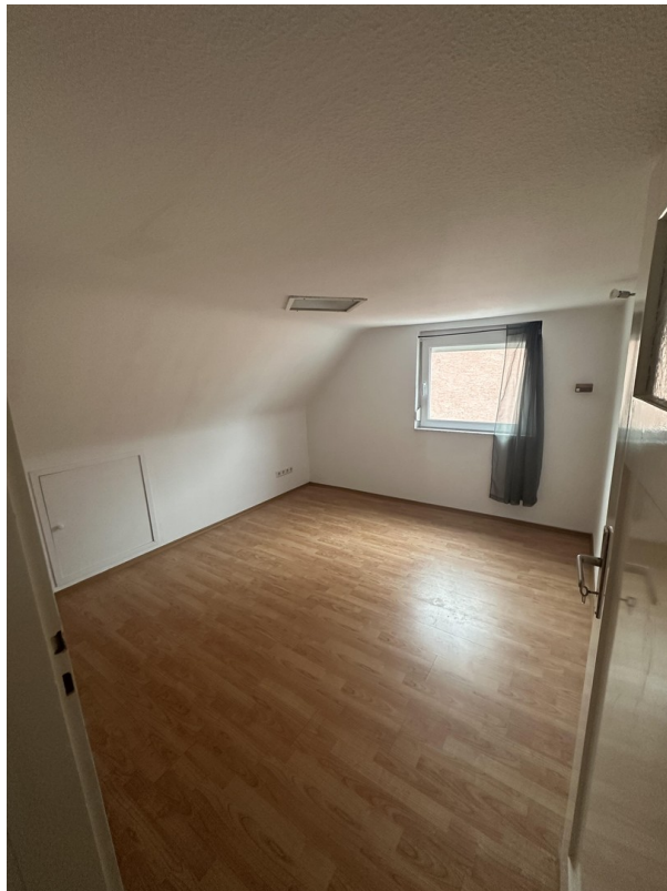
2. OG 1. Schlafzimmer