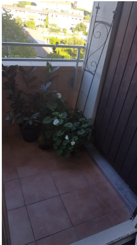
Balkon / Loggia