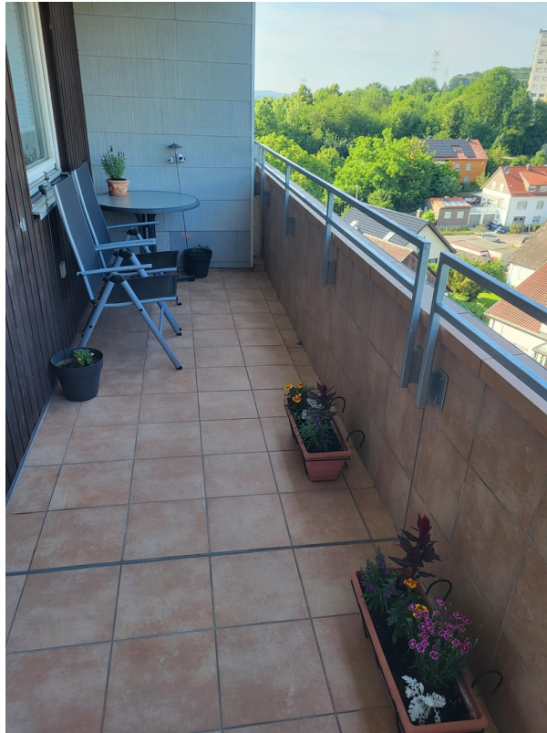
Balkon / Loggia