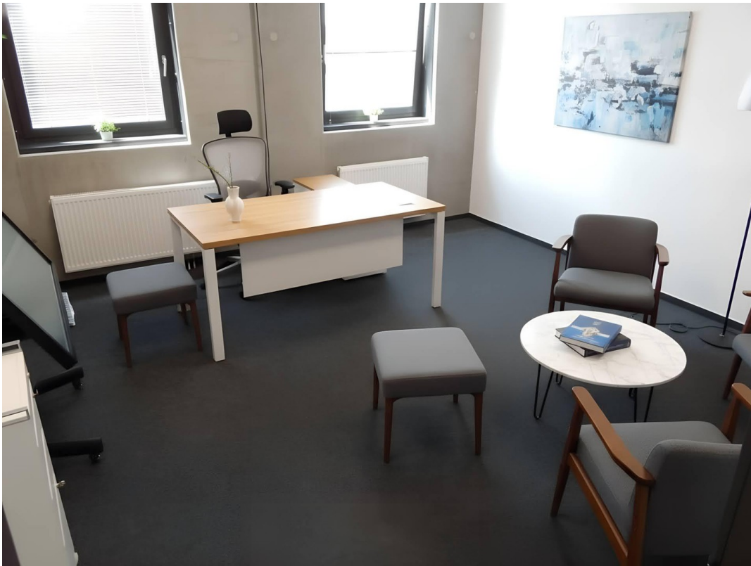
Einzelbüro im Besprechungsecke