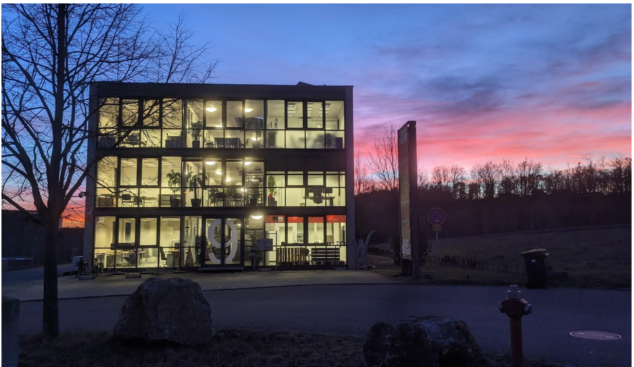
Bürogebäude mit Glasfassade