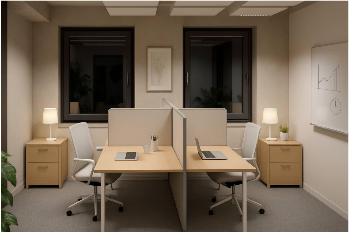
Teambüro mit Akustiktrennwände