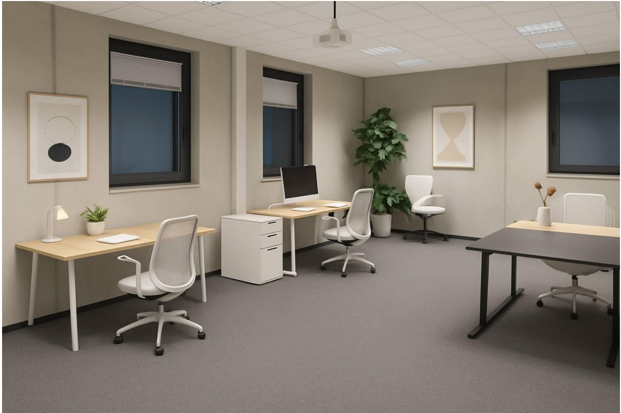
Teambüro mit Beamer an Decke