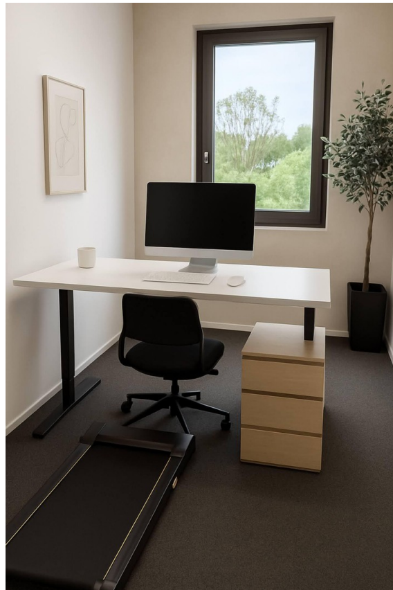
Einzelbüro mit Laufband