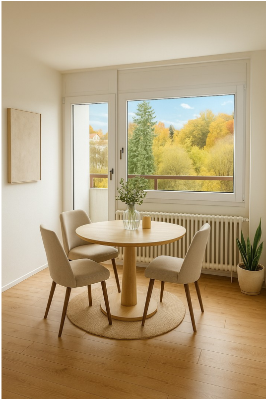
Essbereich mit Loggia