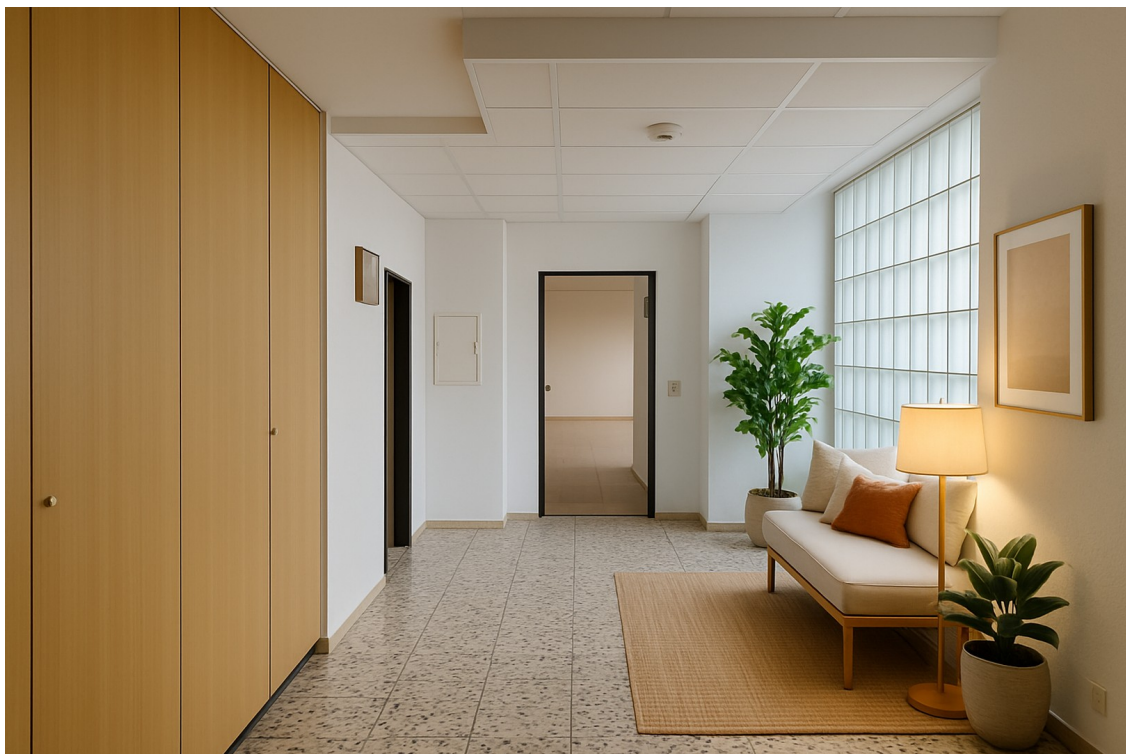
vor der Wohnung