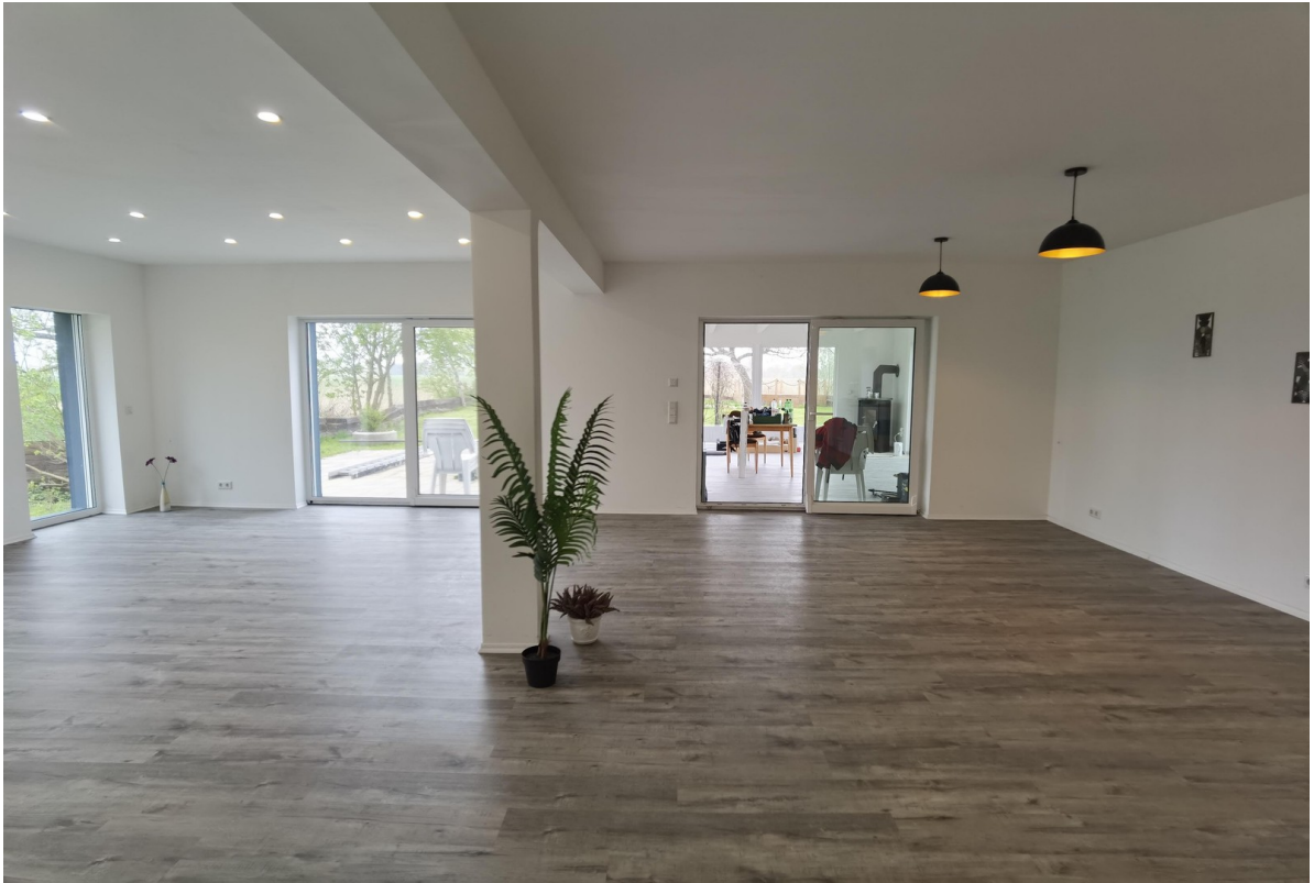
Wohnbereich (ca. 60 qm)