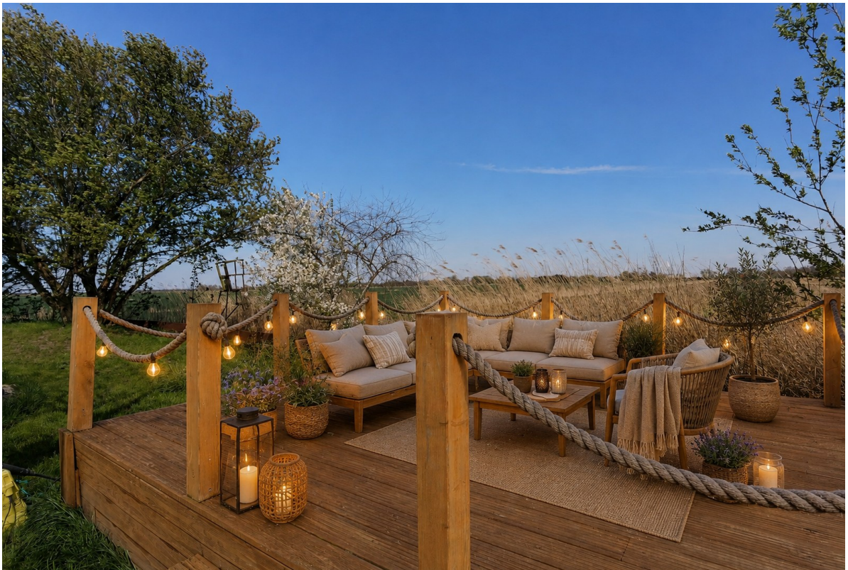
Terrasse 2 mit freiem Blick