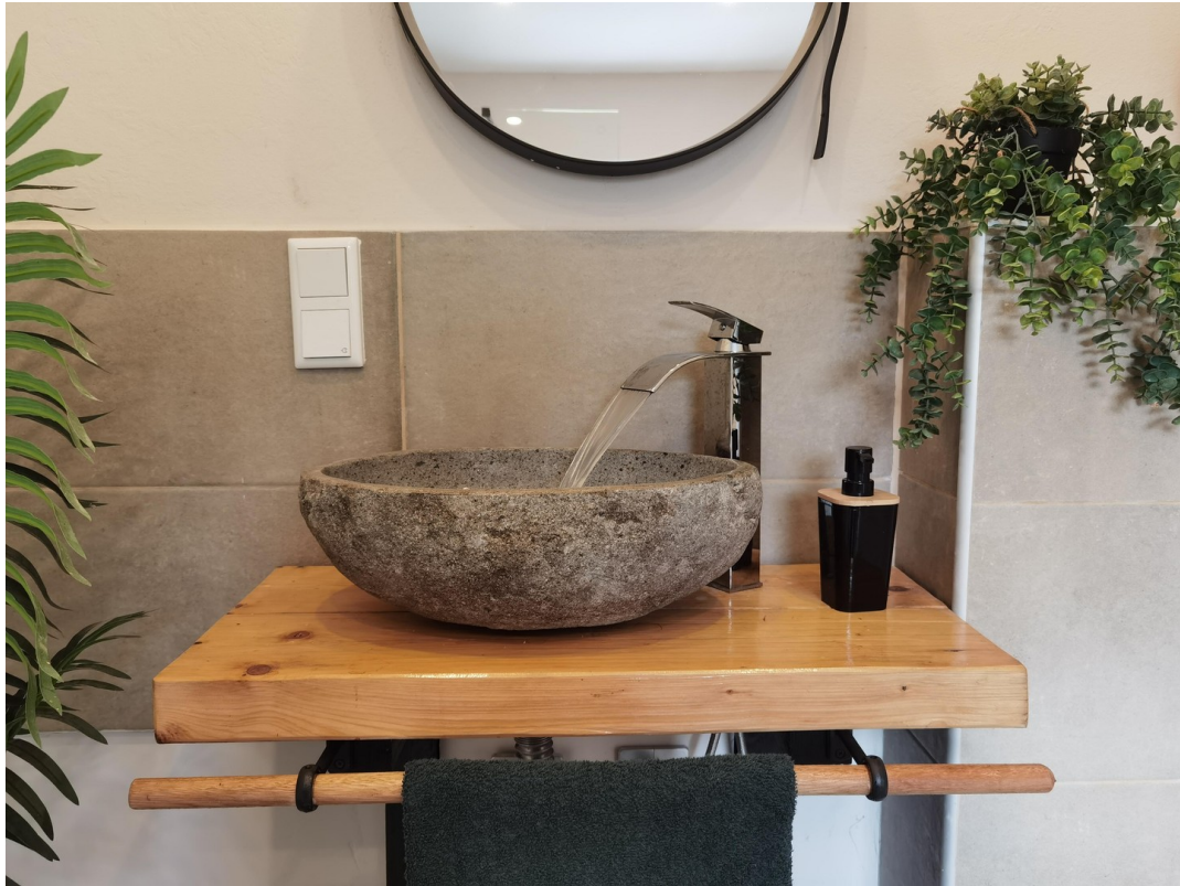
Naturstein-WT mit Schwallausl.