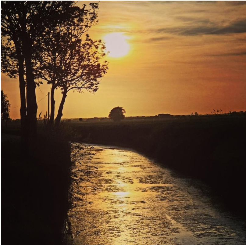
Heringskoope Strom (Grenze)