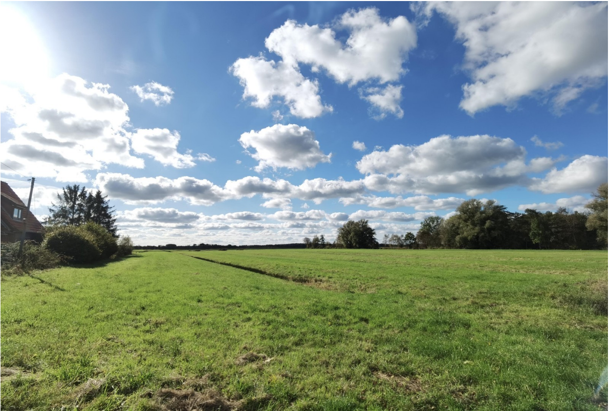
Blick auf die Weiden