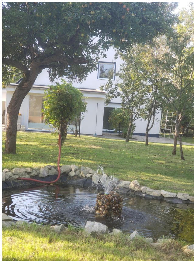
Garten mit Teich und Weinreben