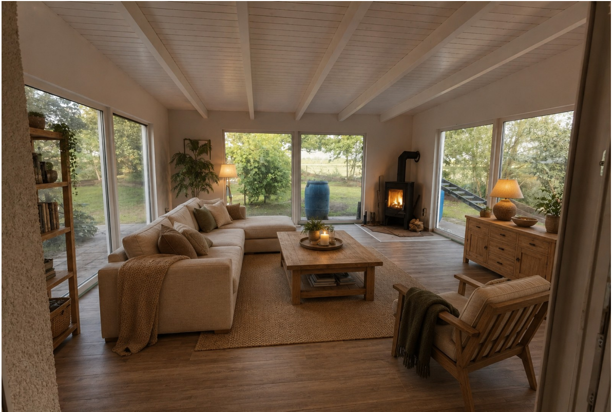
Wintergarten (mit Kaminofen)