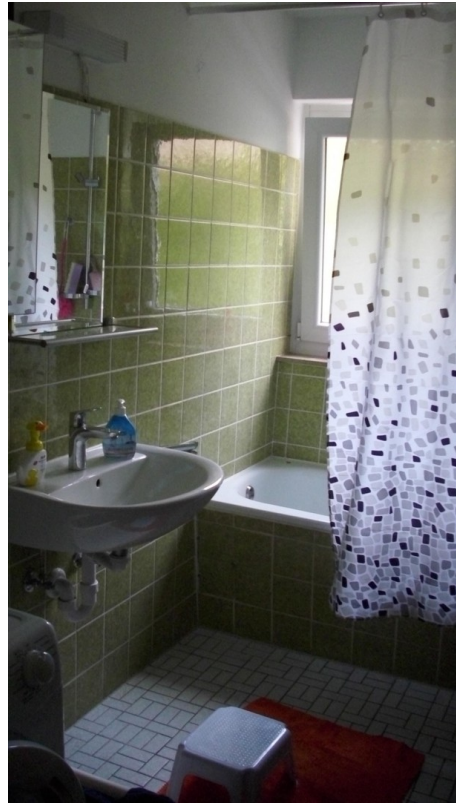
Bad mit Waschmaschinenan.